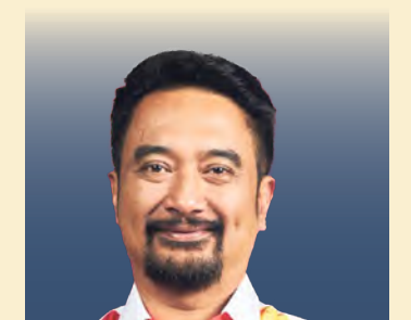
Azmizam Zaman Huri N46 Pelabuhan Klang