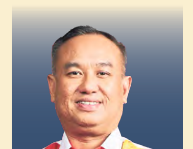
Lwi Kian Keong N56 Sungai Pelek