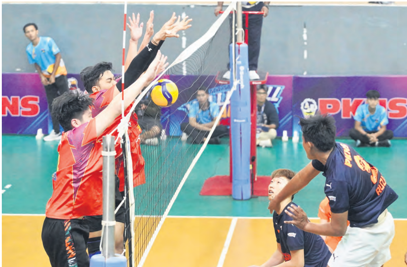
Pemain MBSA (kiri) menghalang percubaan lawan dalam perlawanan akhir Kejohanan Liga Bola Tampar jemputan PKNS di Dewan Bola Tampar MBSA, Shah Alam pada 17 September.