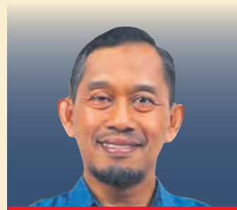
Sallehen Mukhyi N02 Sabak Bernam