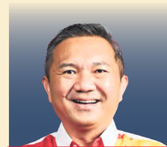
Ng Sze Han N30 Kinrara