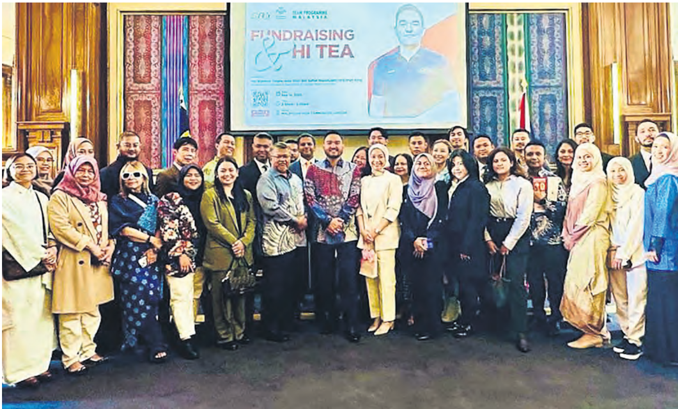
Tengku Amir Shah (tengah) bersama jemputan majlis minum petang di Suruhanjaya Tinggi Malaysia di London, United Kingdom pada 14 September.