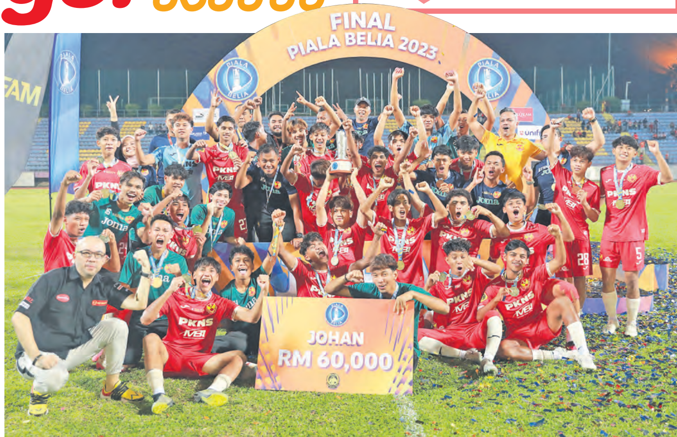
GEMBIRA... Selangor FC B18 kekal juara Piala Belia menewaskan Johor Darul Ta'zim IV dalam perlawanan akhir kedua di Stadium UiTM, Shah Alam pada 17 September. ▶ BERITA MUKA 21

Pada tahun lalu, nasi ambeng diwarta makanan warisan bagi memberi ketetapan untuk ciri-ciri makanan berkenaan yang asli dan berasal dari Selangor.