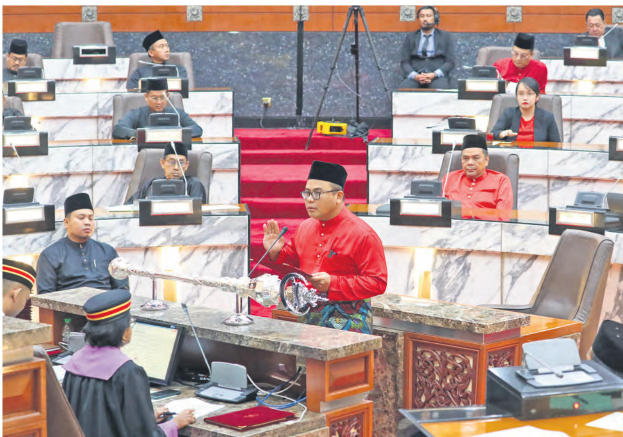
Dato' Menteri Besar Dato' Seri Amirudin Shari mengetuai istiadat angkat sumpah Ahli Dewan Negeri dalam persidangan penggal pertama Dewan Negeri Selangor ke-15 pada 19 September 2023.