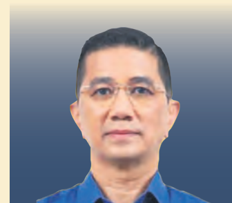
Dato' Seri Mohamed Azmin Ali N18 Hulu Kelang