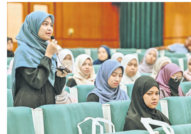
Pelajar mengajukan soalan dalam Bual Bicara Mahasiswa Selangor Timur Tengah di Universiti Yarmouk, Amman