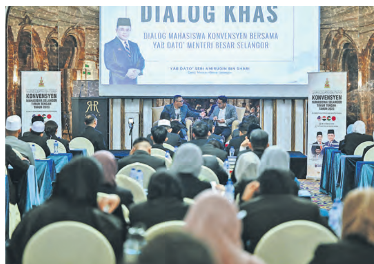
Dato' Menteri Besar bersama pelajar Selangor dari kampus Mesir, Jordan dan Maghribi ketika dialog khas di sebuah hotel di Amman