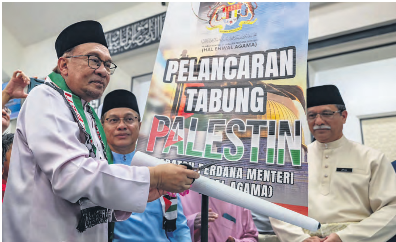
Anwar melancarkan Tabung Palestin seliaan Jabatan Kemajuan Islam Malaysia dan Jabatan Agama Islam Wilayah Persekutuan di Masjid Mahmoodiah, Putrajaya pada 13 Oktober. Hadir sama Menteri Hal Ehwal Agama Dato' Setia Dr Mohd Na'im Mokhtar (tengah).