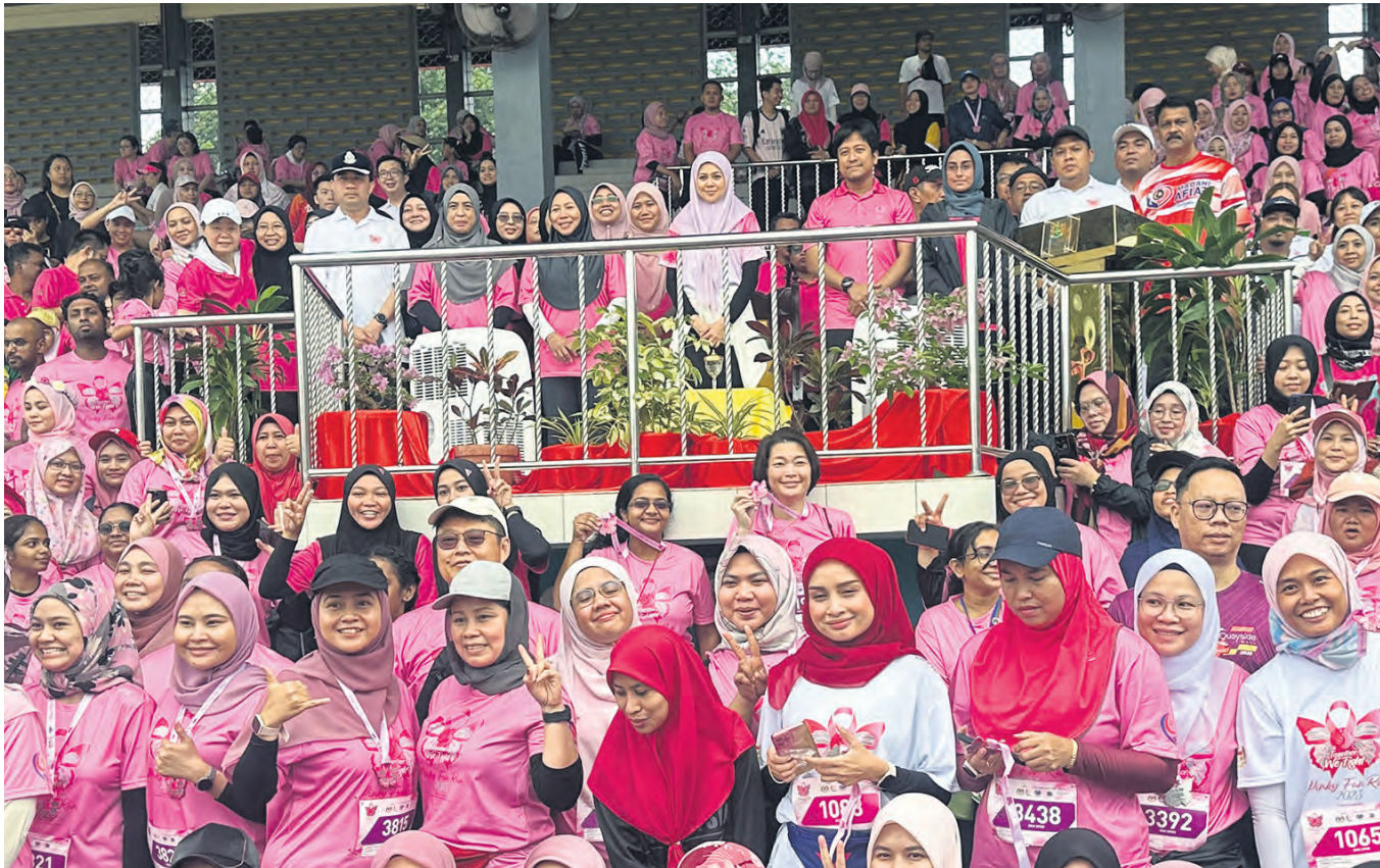
Tengku Permaisuri Hajah Norashikin bersama peserta Pinky Fun Run sempena Hari Tanpa Kenderaan MPK di Padang Sultan Suleiman, Klang pada 15 Oktober.