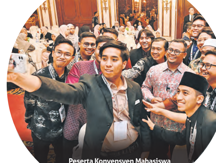
Peserta Konvensyen Mahasiswa Selangor Timur Tengah berswafoto dengan Amirudin