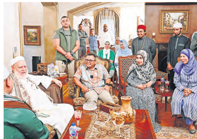
Dato' Menteri Besar menziarahi mantan Mufti Besar Mesir Syeikh Professor Dr Ali Jum'ah di kediamannya di Kaherah