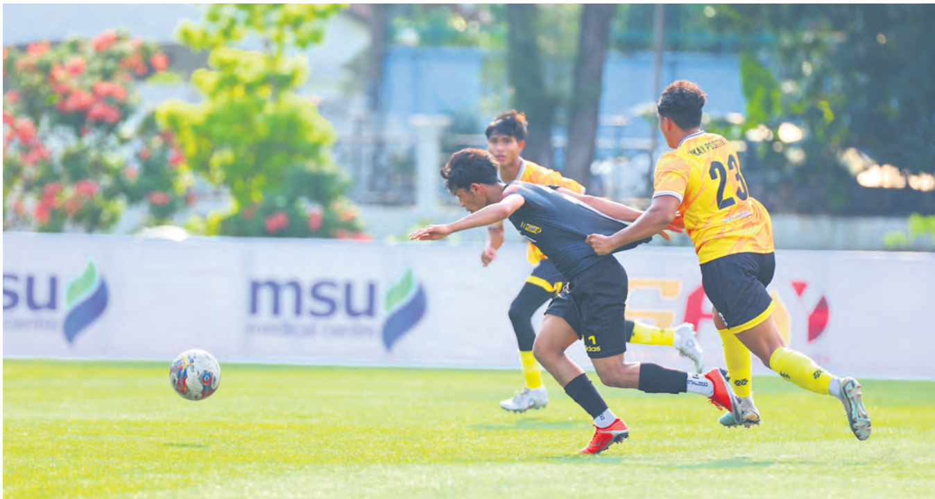
Pemain Ampang Ukay Positive FC (kanan) menyekat pergerakan tonggak Ingress KL FC dalam perlawanan ketiga kumpulan A Liga Juara Selangor di Arena MBSJ, Subang Jaya pada 14 Oktober.