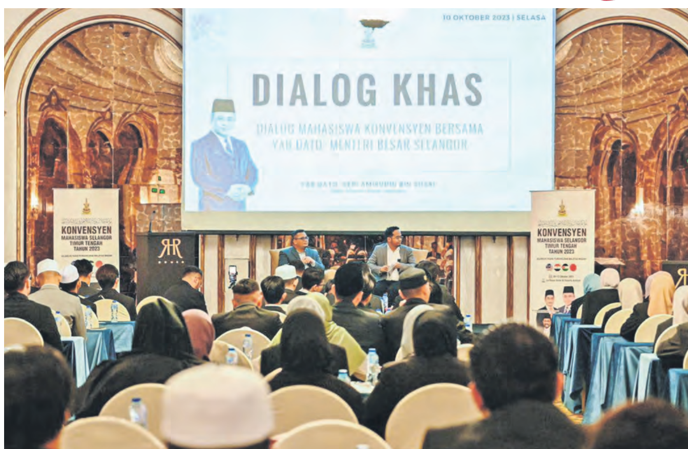
Dato' Menteri Besar Dato' Seri Amirudin Shari mengadakan perbincangan dua hala bersama 300 pelajar dalam Konvensyen Mahasiswa Selangor Timur Tengah 2023 di Amman, Jordan pada 10 Oktober 2023. ▶ BERITA MUKA 2