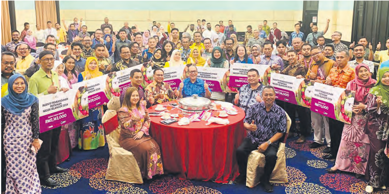
SEMANGAT... EXCO Pertanian Ir Izham Hashim bersama penerima insentif pembangunan pertanian dalam Persidangan Agro Selangor 2023 di Glenmarie, Shah Alam pada 16 Oktober. Seminar tiga hari itu membincangkan pelbagai isu untuk meningkatkan hasil petani.