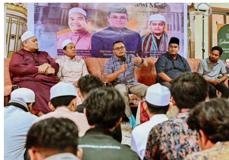
Dato' Menteri Besar berucap dalam pertemuan ramah mesra bersama mahasiswa Selangor di Kaherah