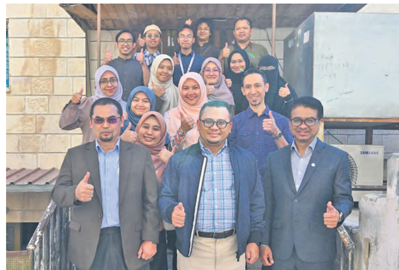
Dato' Menteri Besar bersama penuntut Selangor di hadapan penempatan mahasiswa di Amman