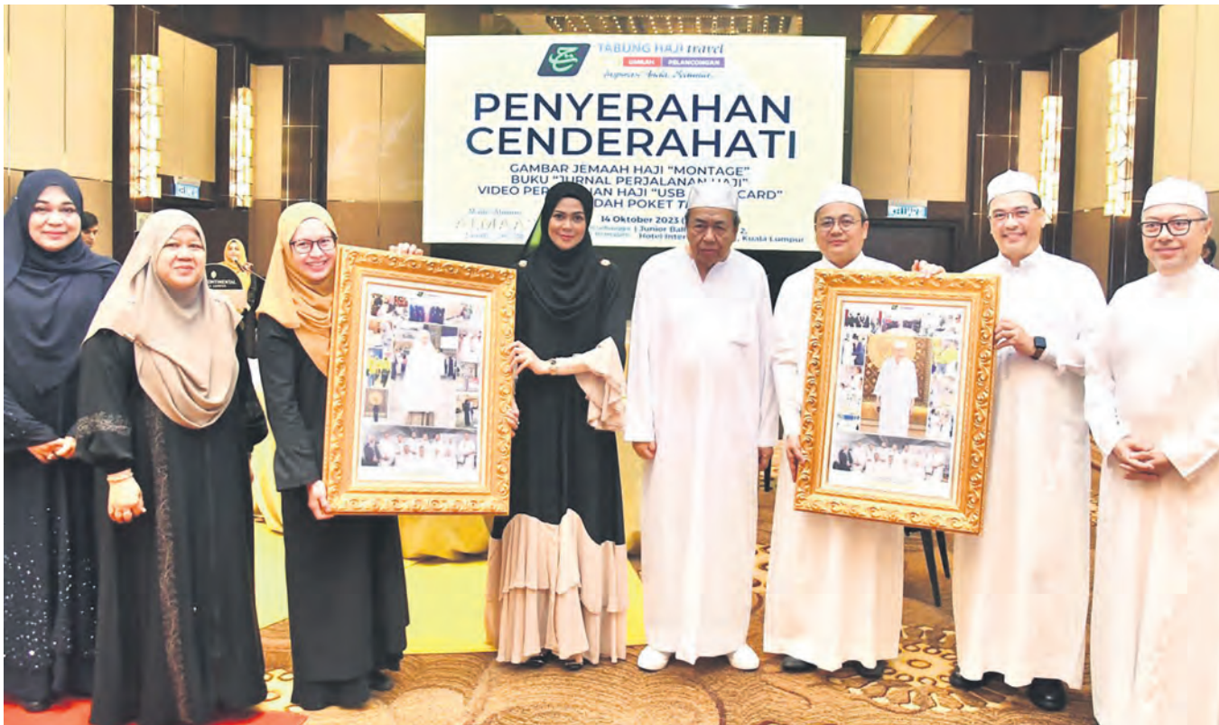
CERIA... Duli Yang Maha Mulia (DYMM) Sultan Sharafuddin Idris Shah Alhaj dan DYMM Tengku Permaisuri Hajah Norashikin berkenan menerima cenderahati sempena Majlis Meraikan Alumni Pakej Haji Almaas Musim Haji 1444H anjuran Tabung Haji Travel & Services di Kuala Lumpur pada 14 Oktober.