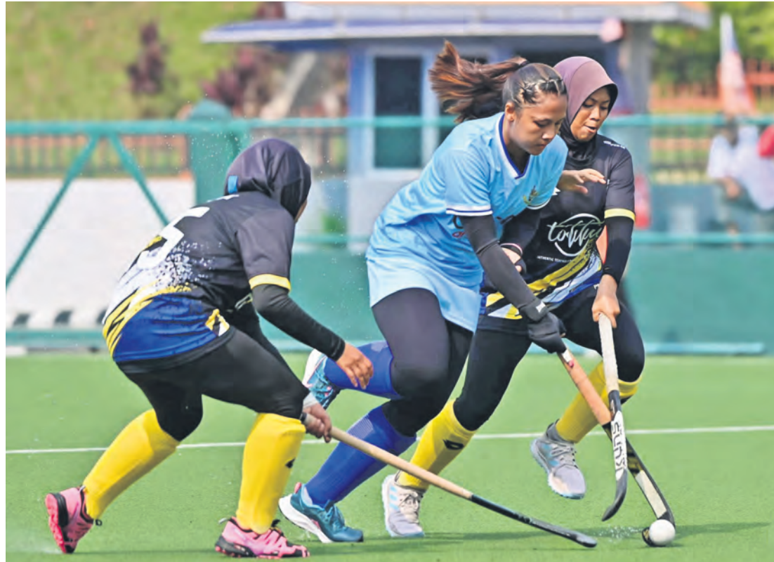
Pemain hoki wanita Selangor (tengah) cuba melepasi kawalan pemain Perak dalam perlawanan kumpulan A TNB Piala Tun Abdul Razak di Stadium Hoki Kementerian Pendidikan Malaysia Lembah Pantai, Kuala Lumpur pada 14 Oktober.

Selain itu, pelbagai kegiatan menarik turut diadakan antaranya mencanting batik, memancing ikan khas untuk kanak-kanak dan sesi bual bicara.