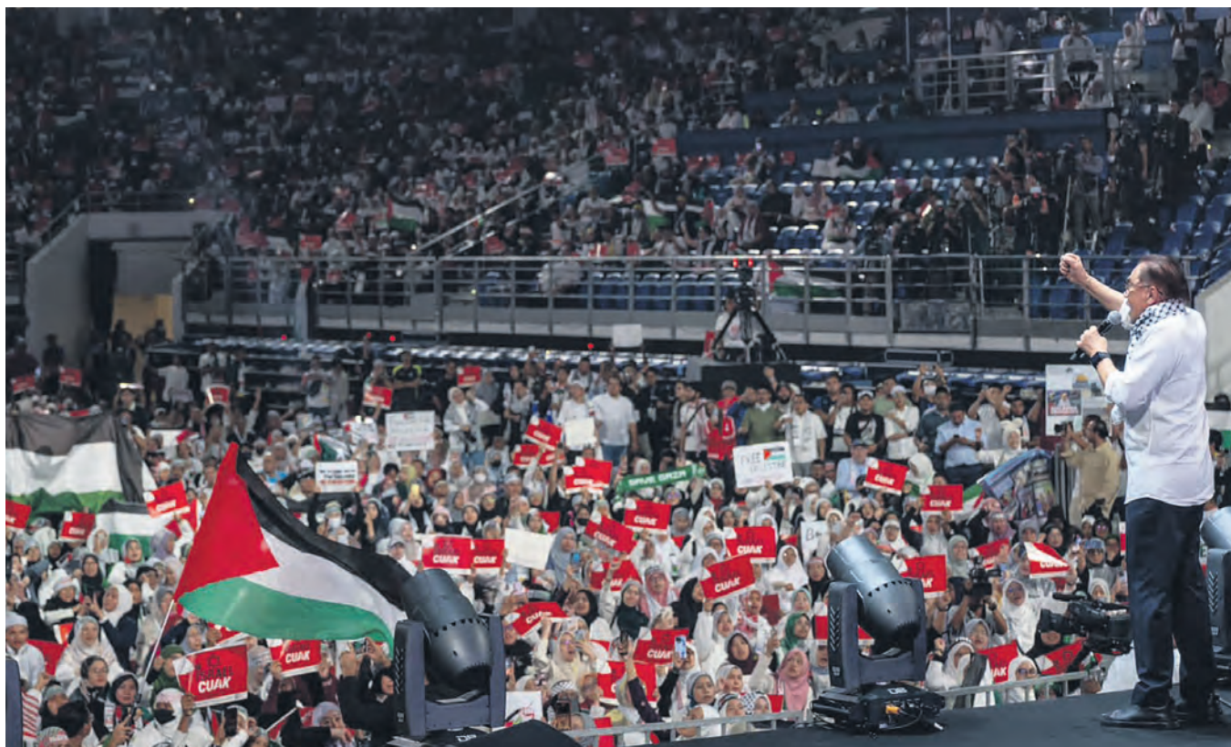
Anwar menegaskan sokongan negara terhadap Palestin ketika berucap depan kira-kira 16,000 orang dalam Himpunan Malaysia Bersama Palestin di Bukit Jalil, Kuala Lumpur pada 24 Oktober.