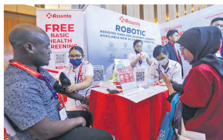
Pembantu perubatan Hospital Assunta melakukan saringan kesihatan percuma untuk pengunjung ketika Ekspo Perubatan Antarabangsa Selangor