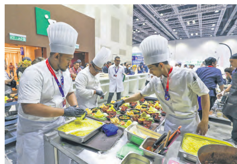
Peserta persidangan menyediakan makanan ketika Ekspo Makanan dan Minuman Antarabangsa Selangor