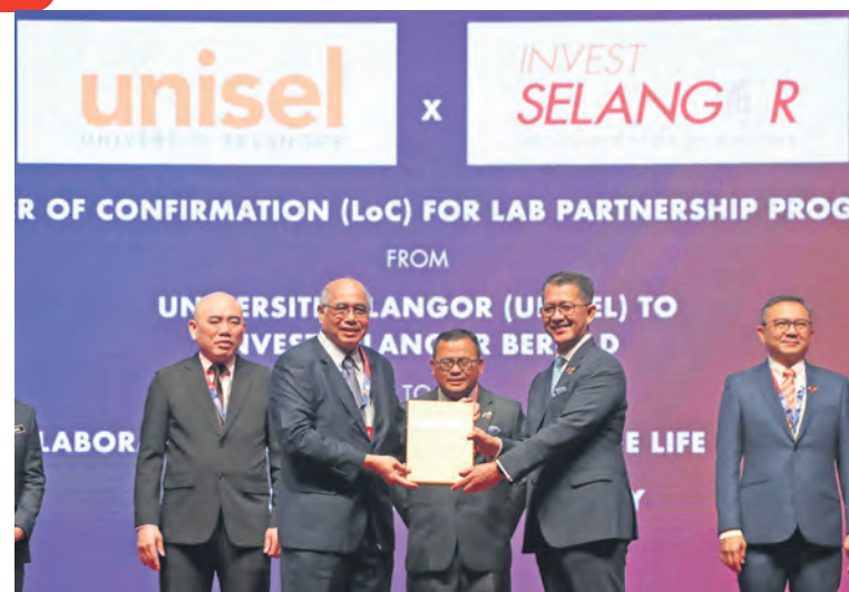
Dato' Menteri Besar menyaksikan penyerahan surat kerjasama dari Unisel kepada Invest bagi Program Perkongsian Makmal Selangor, khusus mengembangkan bidang sains hayat