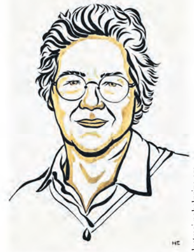
Anne L'Huillier