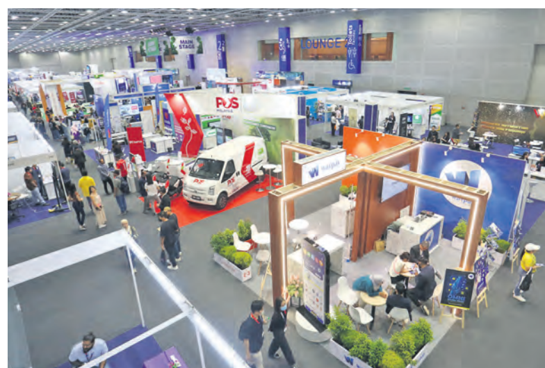
Pengunjung melawat pelbagai jenis reruai yang menawarkan perkhidmatan di Ekspo Taman Perindustrian Selangor