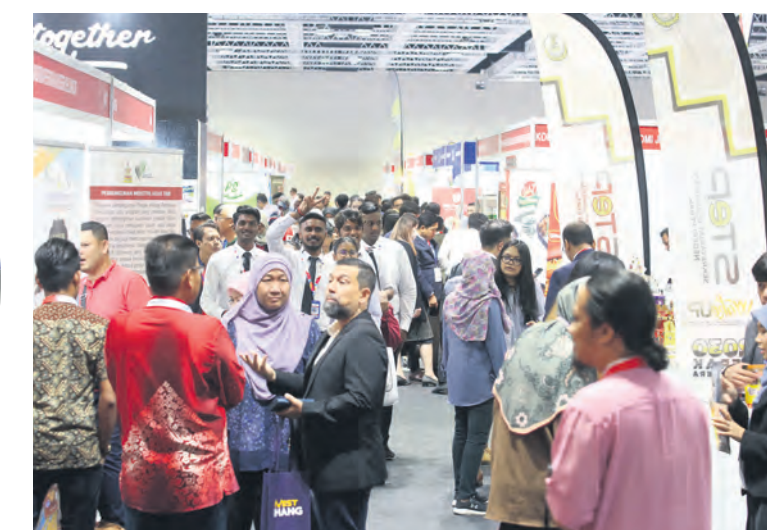
Peserta persidangan SIBS melawat reruai Ekspo Makanan dan Minuman Antarabangsa Selangor pada hari pertama