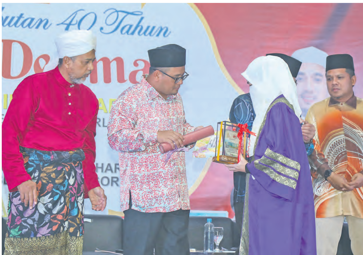
Dato' Menteri Besar Datu' Seri Amirudin Shari menyampaikan sijil kecemerlangan hafazan 30 juzuk dan pelajar cemerlang Sijil Pelajaran Malaysia sempena sambutan 40 Tahun Jubli Delima Pusat Pendidikan Hafiz di Klang pada 21 Oktober 2023. ▶ BERITA MUKA 2