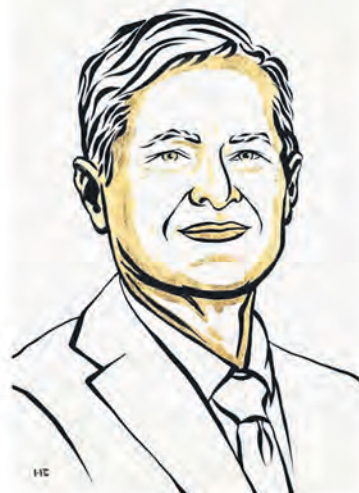
III. Niklas Elmehed © Nobel Prize Outreach Ferenc Krausz