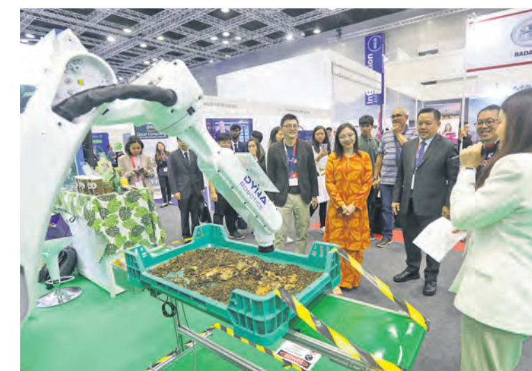
EXCO Kesihatan Jamaliah melawat reruai Entomal Mobile Bioconversion (EMBC) yang menyediakan sistem pemprosesan sisa makanan di Ekspo Taman Perindustrian Selangor