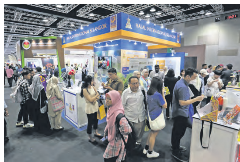
Orang ramai boleh menikmati sampel produk syarikat yang terlibat dalam Ekspo Makanan dan Minuman Antarabangsa Selangor