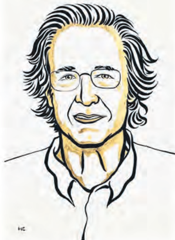
III. Pierre Agostini

Namun, cabarannya kelakuan elektron sulit untuk dikaji kerana ia bergerak dengan sangat