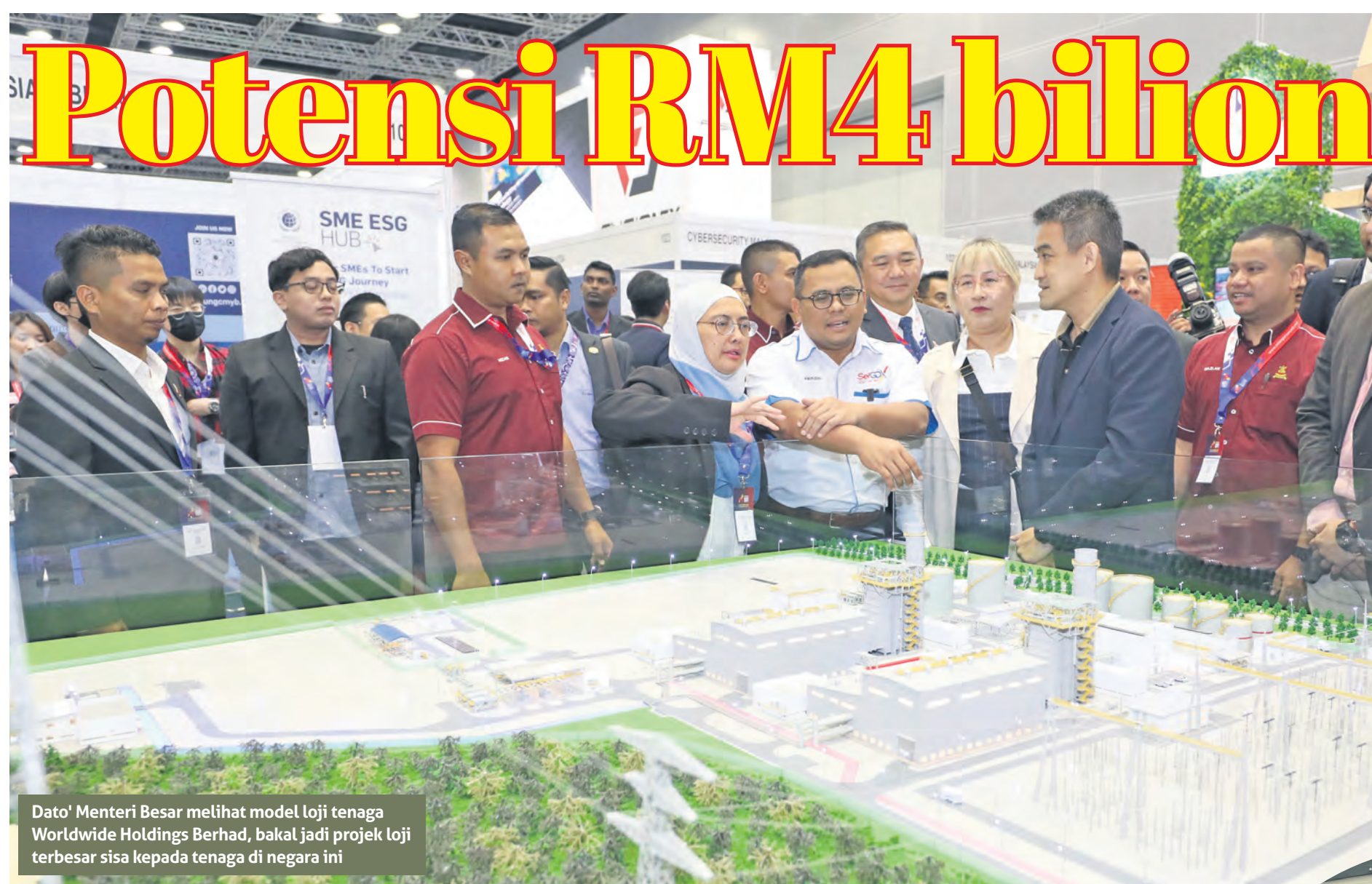
Dato' Menteri Besar melihat model loji tenaga Worldwide Holdings Berhad, bakal jadi projek loji terbesar sisa kepada tenaga di negara ini

SIDANG Kemuncak Perniagaan Antarabangsa Selangor (SIBS) di Pusat Konvensyen Kuala Lumpur (KLCC) selama empat hari mulai 19 Oktober dihadiri kira-kira 50,000 pengunjung tempatan dan luar negara.