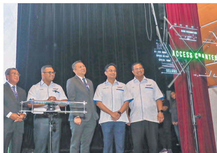
Dato' Menteri Besar melancarkan Perkongsian Data Negeri Selangor (SelGDX), portal pertukaran data bersepadu antara 70 jabatan dan agensi yang pertama dibangunkan di negara ini