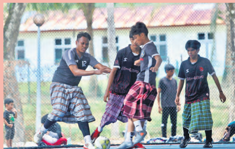
Remaja menyertai pertandingan futsal berkain pelekat dalam Karnival Perpaduan, sebahagian aktiviti program Gagasan Rumpun Selangor di Hulu Selangor pada 22 Februari