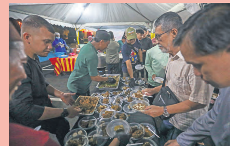
Orang ramai mengambil pelbagai juadah ketika rumah terbuka Aidilfitri di Institut Kemahiran Belia Negara Dusun Tua sempena program Rumpun Selangor peringkat Hulu Langat pada 25 April