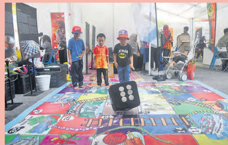
Tiga kanak-kanak seronok membalik dadu permainan dam ular gergasi semasa Karnival Perpaduan Rumpun Selangor di Kuala Kubu Bharu pada 22 Februari