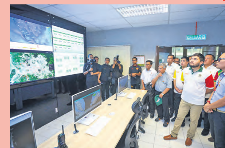
Raja Muda Selangor mendengar penerangan ketika melawat pusat pemantauan maklumat banjir Jabatan Pengairan dan Saliran Selangor di Shah Alam pada 19 Jun