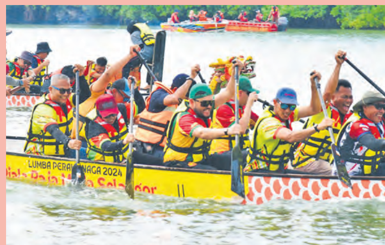
Tengku Amir Shah turut bersama peserta menyertai lomba perahu naga Piala Raja Muda Selangor di jeti nelayan Sungai Besar, Sepang pada 11 Mei