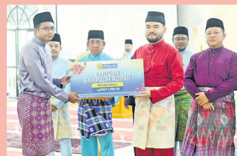
Tengku Amir Shah menyampaikan sumbangan baik pulih rumah RM17,590 di Masjid Jamek Ar-Rahimah, Kuala Kubu Bharu pada 23 Februari. Empat asnaf di Hulu Selangor mendapat bantuan