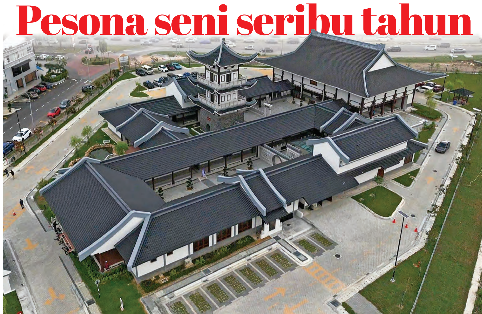
Pemandangan masjid dari udara dirakam pada 22 Ogos. Rumah ibadat itu menyediakan perpustakaan, bilik kuliah, bilik persinggahan, kedai cenderamata dan restoran