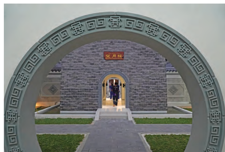
Reka bentuk yang dikenali gerbang bulan terletak berdekatan menara masjid turut dihiasai corak bermotifkan tradisi Cina lama pada 22 Ogos