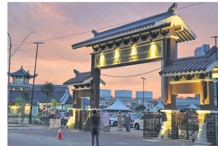
Gerbang ke rumah ibadat Cina muslim dihiasi cahaya lampu limpah yang menyerlahkan keindahan seni bina tradisi kaum itu ketika waktu senja pada 22 Ogos

Jurufoto HARUN TAJUDIN merakam sebahagian keunikan di masjid tersebut. Keterangan oleh HAFIZAN TAIB.