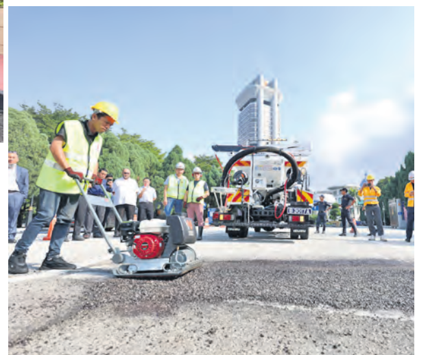
Demonstrasi menampal jalan menggunakan Jentera Baiki Jalan Jetpatcher Infracel pada 10 September 2024