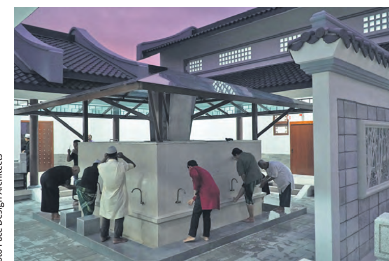
Umat Islam mengambil wuduk untuk menunaikan solat berjemaah buat pertama kali pada waktu maghrib ketika hari pembukaannya di Bandar Botanik, Klang pada 22 Ogos