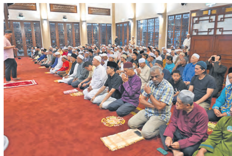
Hampir 500 jemaah mengerjakan solat maghrib yang pertama pada 22 Ogos. Rumah ibadat berkenaan mampu menampung 1,000 jemaah