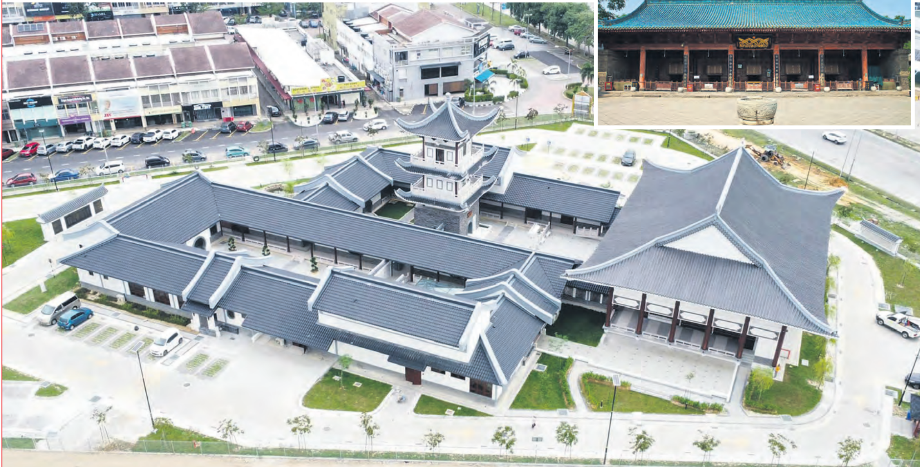
Dewan solat Masjid Besar Xi'an di China