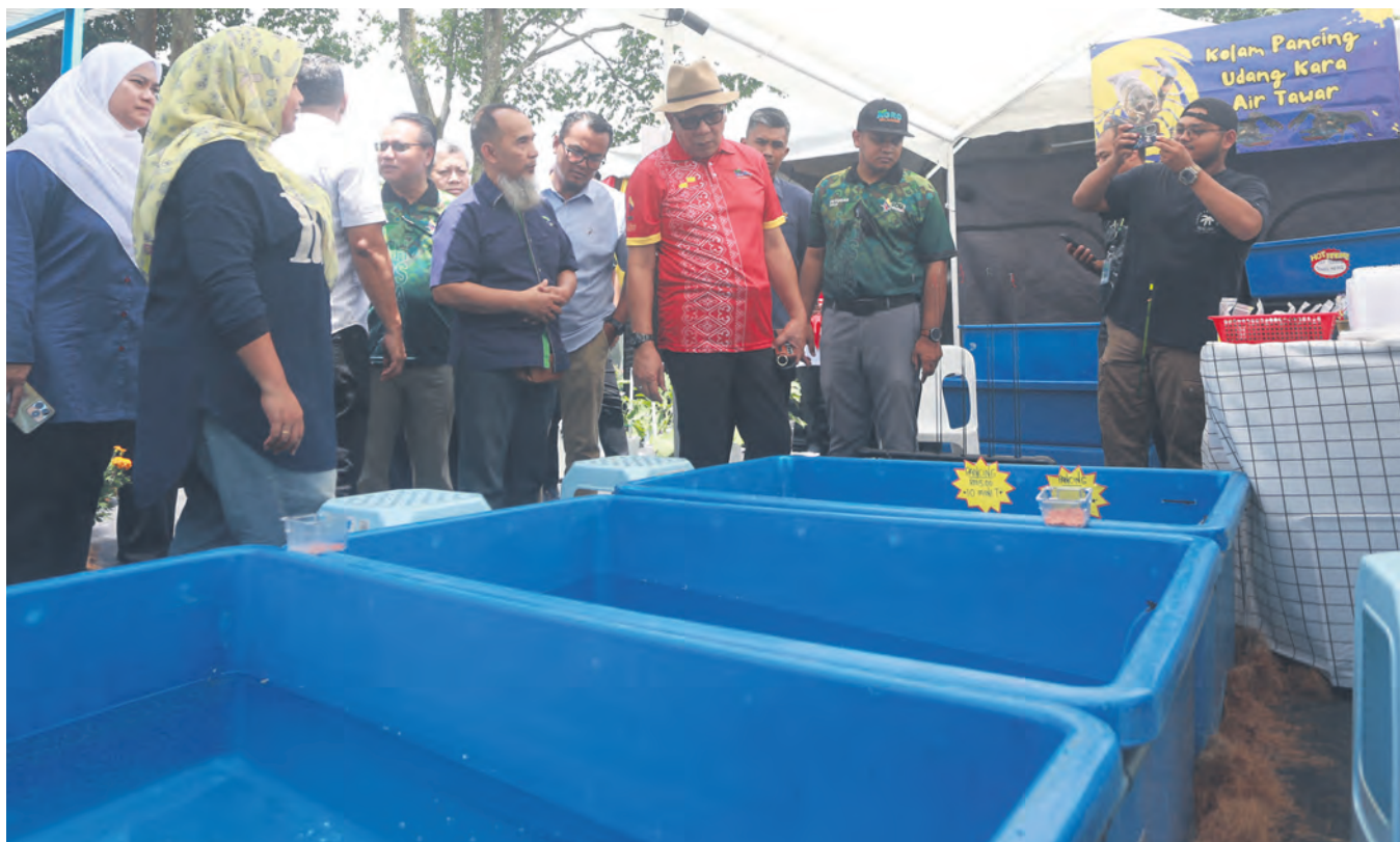
PELIHARA... EXCO Pertanian Ir Izham Hashim (tiga, kanan) melawat Pavilion Selangor sempena Pameran Pertanian, Hortikultur Pelancongan Malaysia (MAHA) 2024 di Maeps Serdang, Subang Jaya pada 11 September. ▶ BERITA MUKA 4