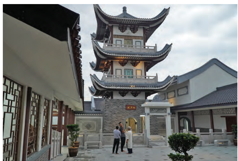
Pengunjung teruja melihat keunikan menara sebelum masuk waktu solat maghrib pada 22 Ogos. Dikenali Menara Cahaya Bulan, ia menempatkan pembesar suara laungan azan