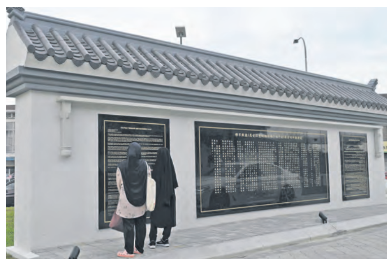
Pengunjung wanita membaca teks khutbah terakhir Nabi Muhammad SAW pada dinding di hadapan pintu masjid pada 7 September. Teks ditulis dalam bahasa Melayu, Cina, Inggeris dan Arab