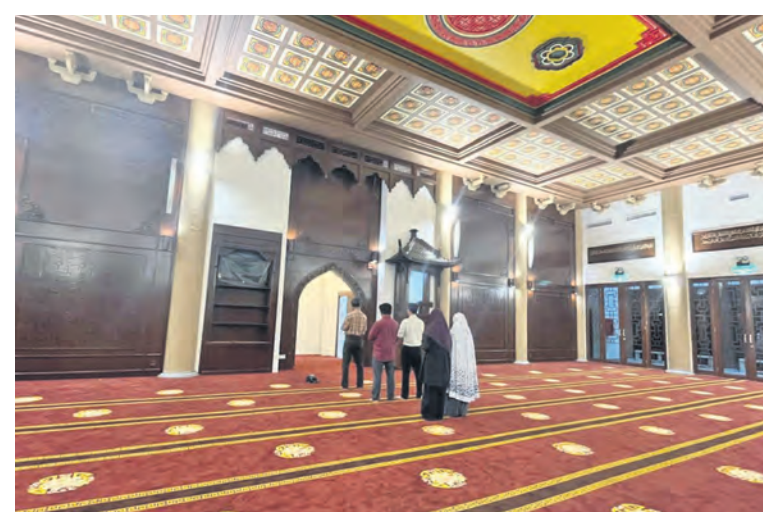
Sekumpulan umat Islam menunaikan solat berjemaah di dewan solat utama pada 22 Ogos. Ruang siling dan karpet diterapkan elemen corak bunga dan motif Cina