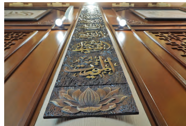
Keunikan hiasan dinding dengan corak bermotif bunga lotus dan kaligrafi Arab tertulis nama-nama Allah menghiasi dewan solat utama masjid tersebut