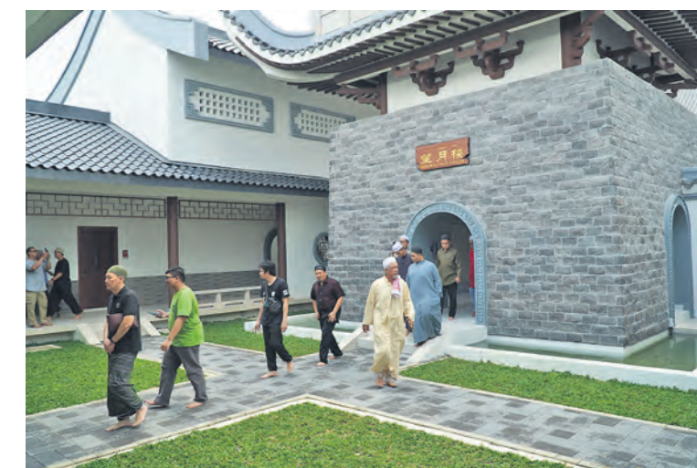
Orang ramai bergerak keluar melalui gerbang Menara Cahaya Bulan selepas selesai menunaikan solat Jumaat pertama di masjid itu pada 23 Ogos