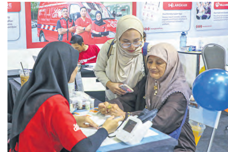
Petugas memeriksa kesihatan warga emas yang menyertai saringan percuma di reruai anak syarikat PKNS Selcare dalam SELBIZ di Pusat Konvensyen Setia City pada 5 Oktober