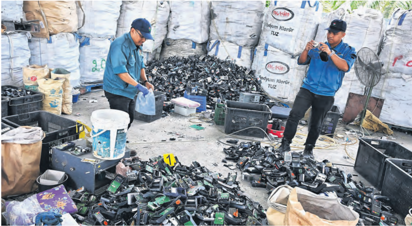
RAMPAS... Penguat kuasa Majlis Perbandaran Kuala Selangor memeriksa sisa elektronik dalam serbuan ke sebuah kilang yang beroperasi tanpa kebenaran di Kampung Sungai Terap baru-baru ini. Jabatan Alam Sekitar turut mengambil sampel barangan untuk dianalisis ke Jabatan Kimia.