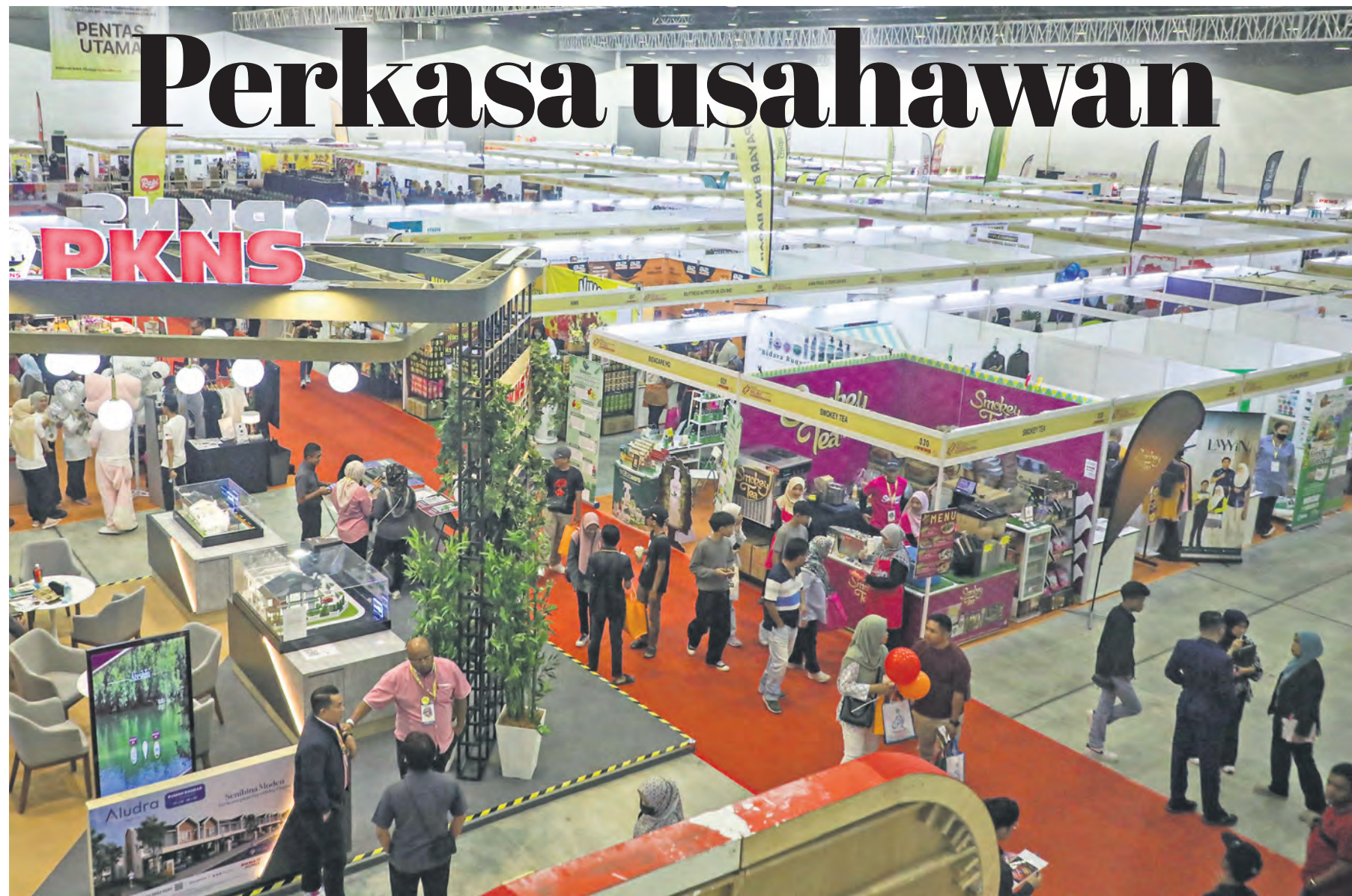
Orang ramai memenuhi ruang pameran SELBIZ di Pusat Konvensyen Setia City pada 5 Oktober. Ekspo berlangsung tiga hari sehingga 6 Oktober

PULUHAN RIBU orang berkunjung ke Ekspo Usahawan Selangor (SELBIZ) 2024 yang berlangsung tiga hari di Pusat Konvensyen Setia City (SCCC), Setia Alam, Shah Alam bermula 4 Oktober.