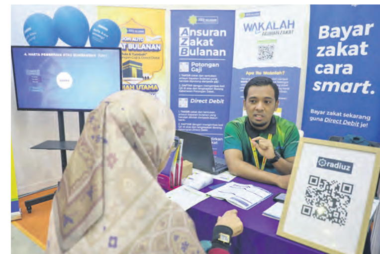
Petugas Lembaga Zakat Selangor menerangkan kepada pengunjung mengenai kaedah pembayaran zakat melalui potongan gaji pada 5 Oktober

Jurufoto FIKRI YUSOF, NUR ADIBAH AHMAD IZAM dan ELYANA NATASHA MOHD ZAIDI merakamkan sebahagian aktiviti dijalankan dalam ekspo yang berakhir 6 Oktober. Keterangan oleh HAFIZAN TAIB.