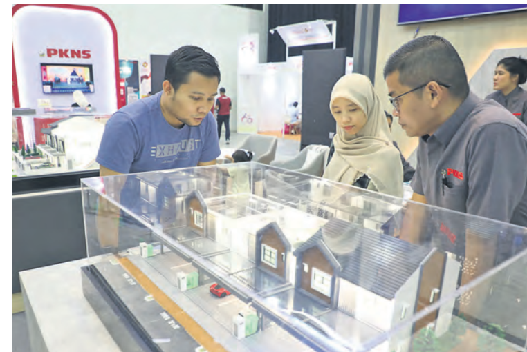
Pelawat tertarik dengan model kediaman dan mendapatkan maklumat projek perumahan Aludra yang dibangunkan PKNS ketika mengunjungi ekspo pada 5 Oktober