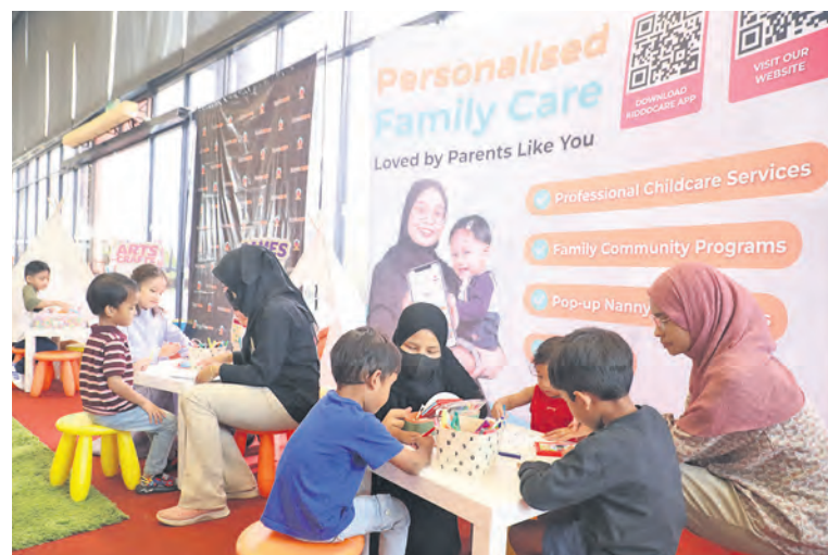
Syarikat Kidzo Care menyediakan penjaga kanak-kanak, kemudahan untuk ibu bapa yang mengunjungi SELBIZ di Shah Alam pada 5 Oktober