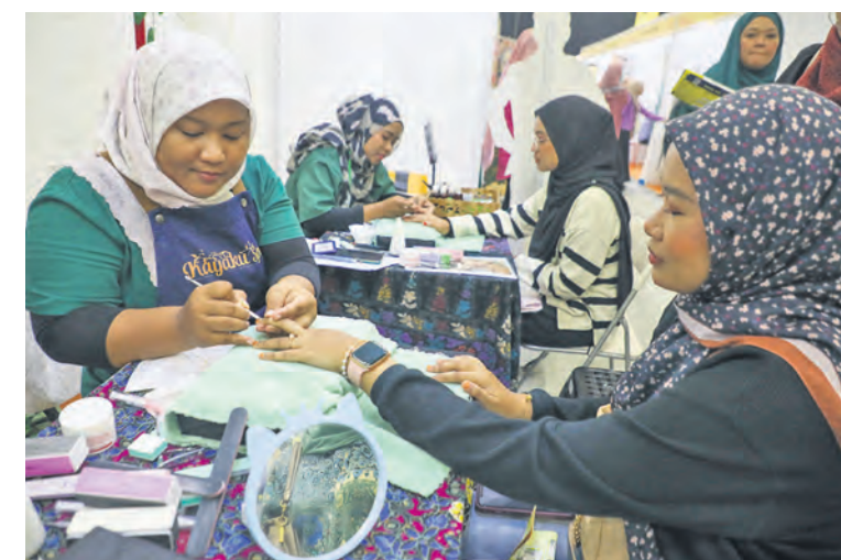
Pengunjung wanita mencuba perkhidmatan merias dan menghias kuku di reruai Kayaku Spa ketika Ekspo Usahawan Selangor pada 5 Oktober