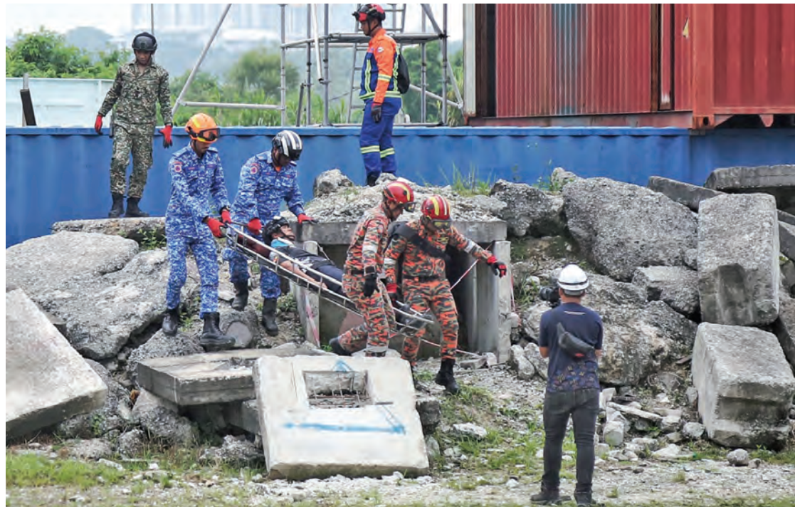
GIGIH... Prosedur menyelamat mangsa yang dipersembahkan dalam majlis penutup Program Latihan Simulasi Bencana Tanah Runtuh Bagi Kesiapsiagaan Agensi Respon peringkat negeri 2024 di Puchong, Subang Jaya pada 7 Oktober.

"SIBF kali ini turut melibatkan pempamer, penerbit, penulis, pemain industri buku daripada pelbagai negara luar seperti Indonesia, Arab Saudi dan Emiriah Arab Bersatu," katanya pada 8 Oktober.