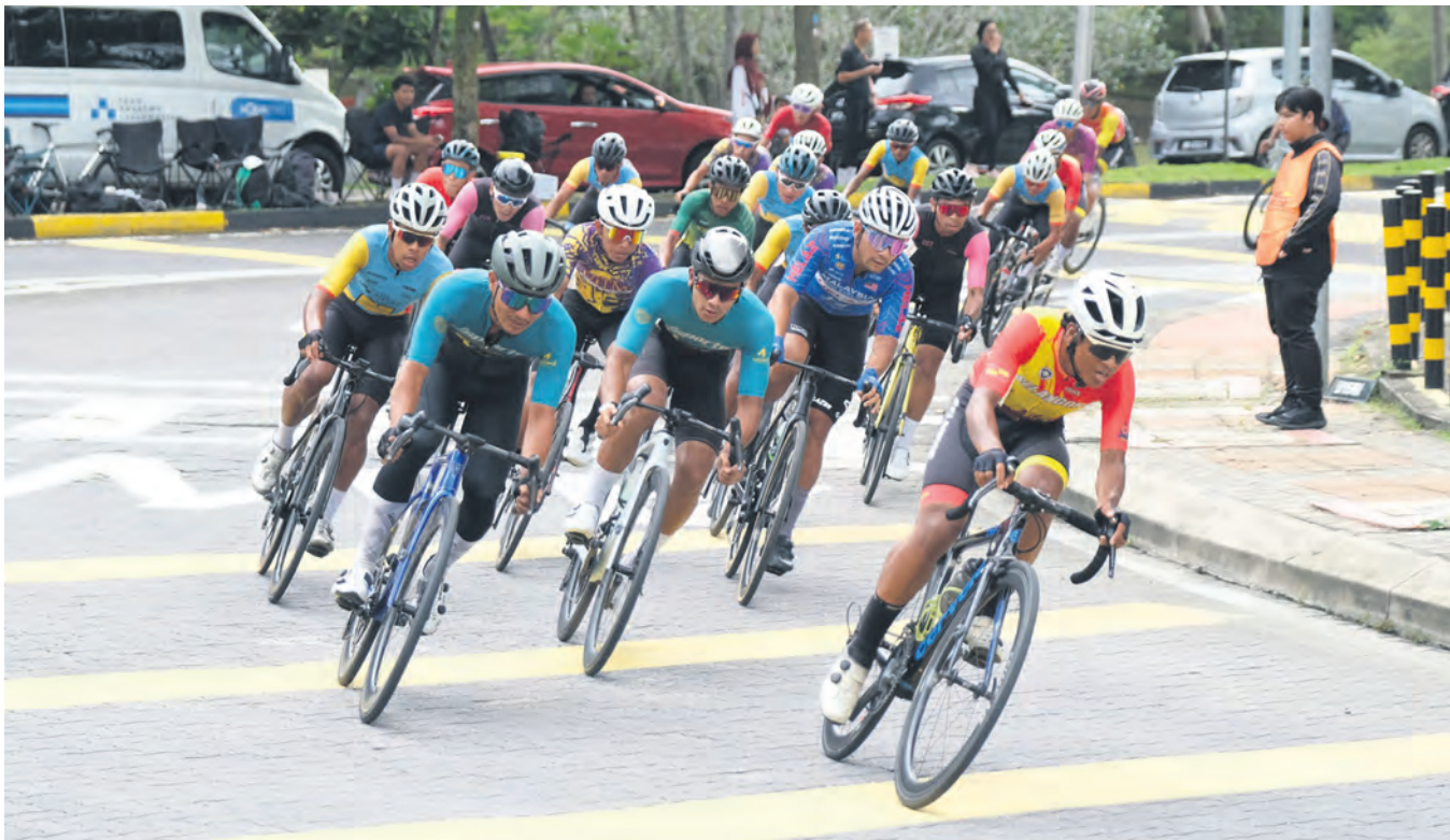
SEMANGAT... Aksi peserta perlumbaan Kriterium Selangor Siri 1 2024 sempena ulang tahun ke-24 bandar raya itu di Taman Tasik Shah Alam pada 6 Oktober.