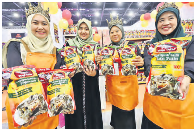
Wakil pengedar CV Raja Patin menunjukkan produk keropok kulit ikan patin di reruai syarikat pada 4 Oktober. Sebanyak 3,000 pek keropok dijual sepanjang pameran