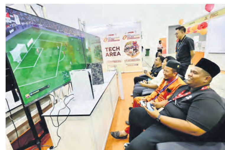
Pelawat ekspo seronok bermain simulasi perlawanan bola sepak digital yang disediakan di sudut interaktif Tech Area SELBIZ pada 4 Oktober