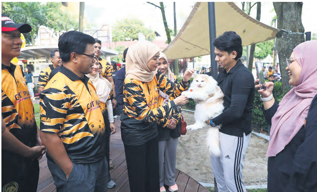
MESRA... Duli Yang Maha Mulia Tengku Permaisuri Selangor Tengku Permaisuri Hajah Norashikin berkenan melawat sekitar Taman Kucing Shah Alam selepas majlis perasmian di Dataran Kemerdekaan, Shah Alam pada 9 Februari. ▶ BERITA MUKA 3