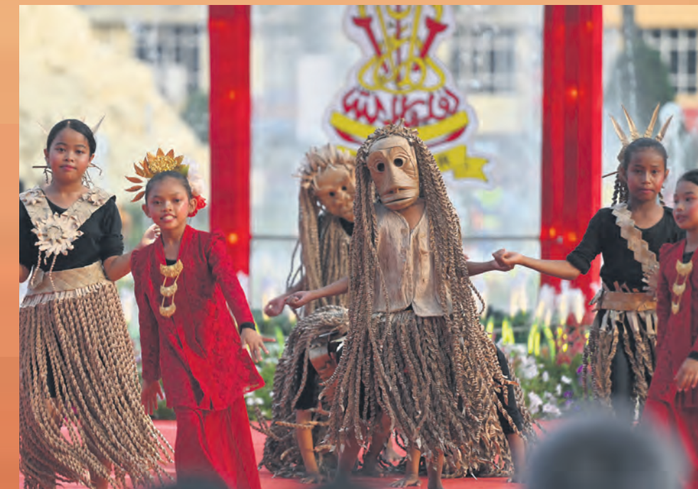
Murid Sekolah Kebangsaan Sungai Judah Pulau Carey mempersembahkan Tarian Inang dan Iboq