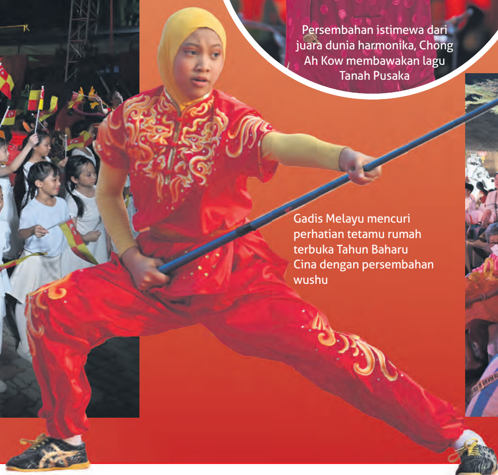
Gadis Melayu mencuri perhatian tetamu rumah terbuka Tahun Baharu Cina dengan persembahan wushu