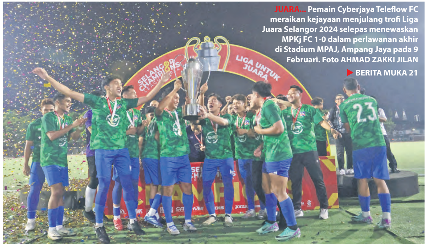
JUARA... Pemain Cyberjaya Teleflow FC meraikan kejayaan menjuang trofi Liga Juara Selangor 2024 selepas menewaskan MPKj FC 1-0 dalam perlawanan akhir di Stadium MPAJ, Ampang Jaya pada 9 Februari.