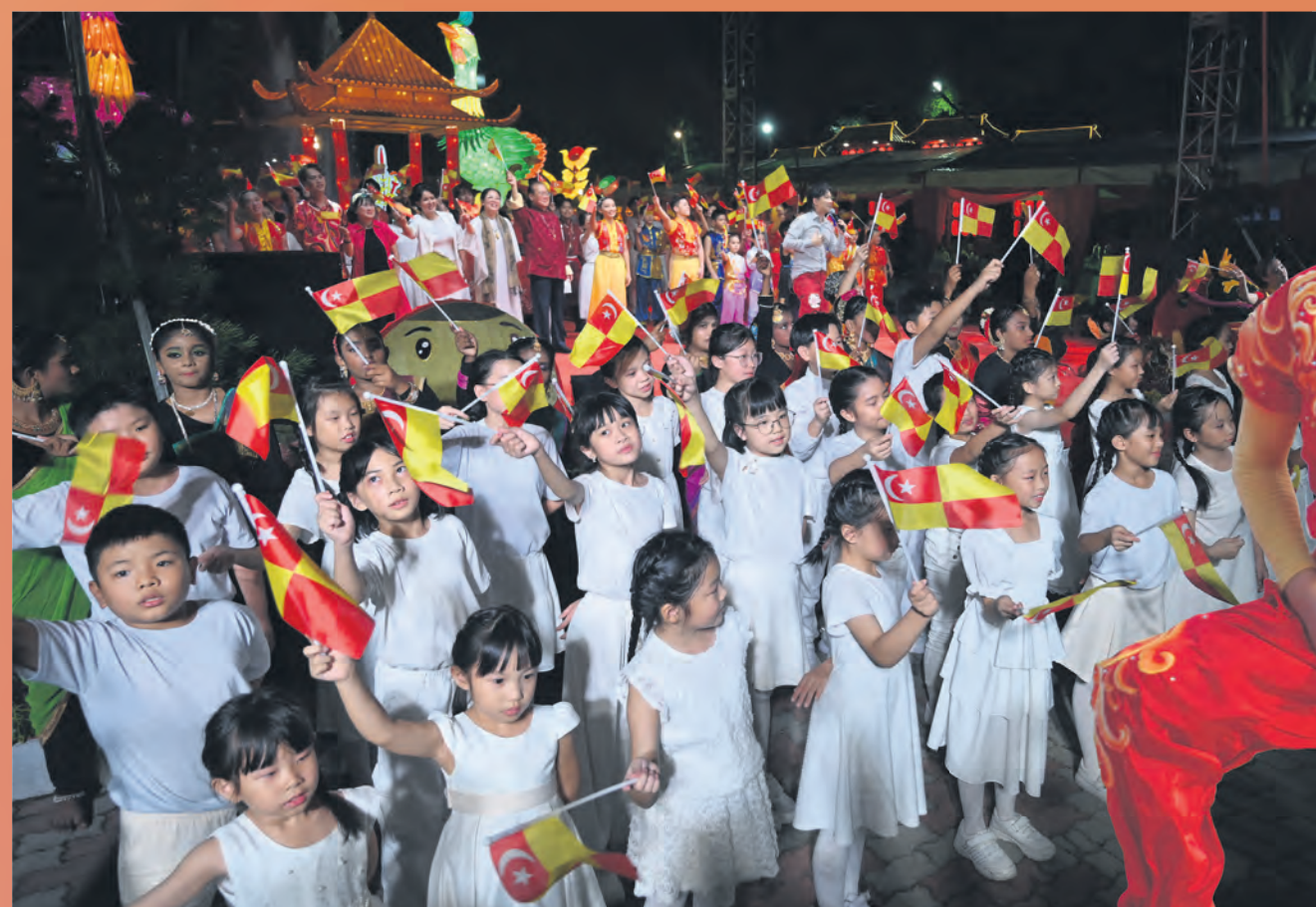
Kumpulan Koir Dandelion Kanak-kanak Kuil Dong Zen mengibarkan bendera Selangor mengiringi persembahan penyanyi lelaki popular, Ah Niu