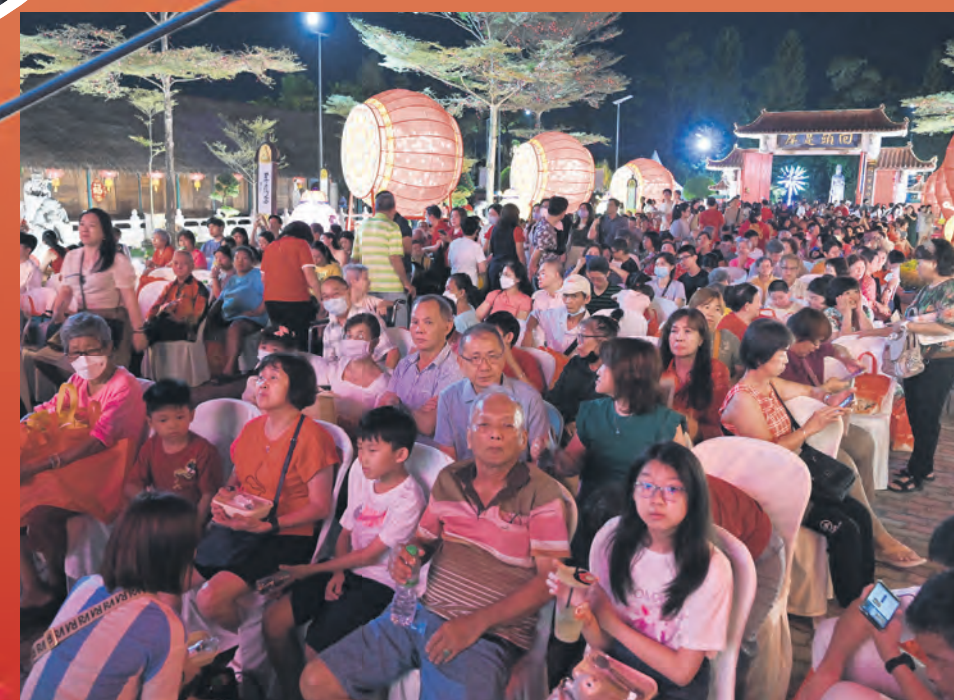
Lebih 30,000 pengunjung direkodkan memeriahkan sambutan rumah terbuka bermula jam 5 petang hingga tengah malam