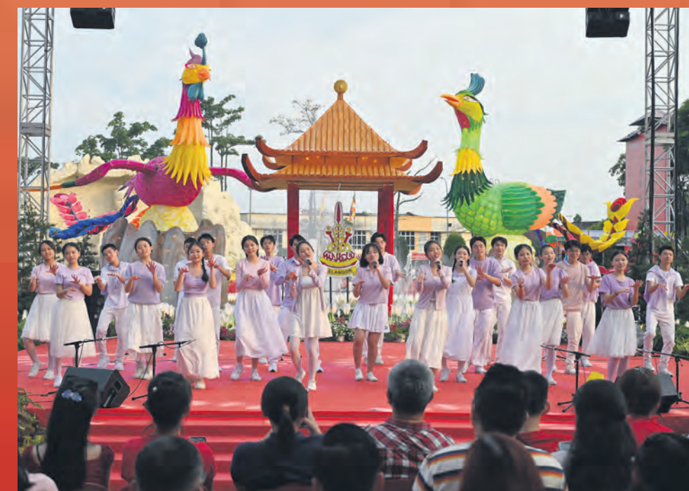
Kumpulan Koir Dandelion memeriahkan rumah terbuka Kerajaan Negeri dengan persembahan pembukaan sejak jam 5 petang