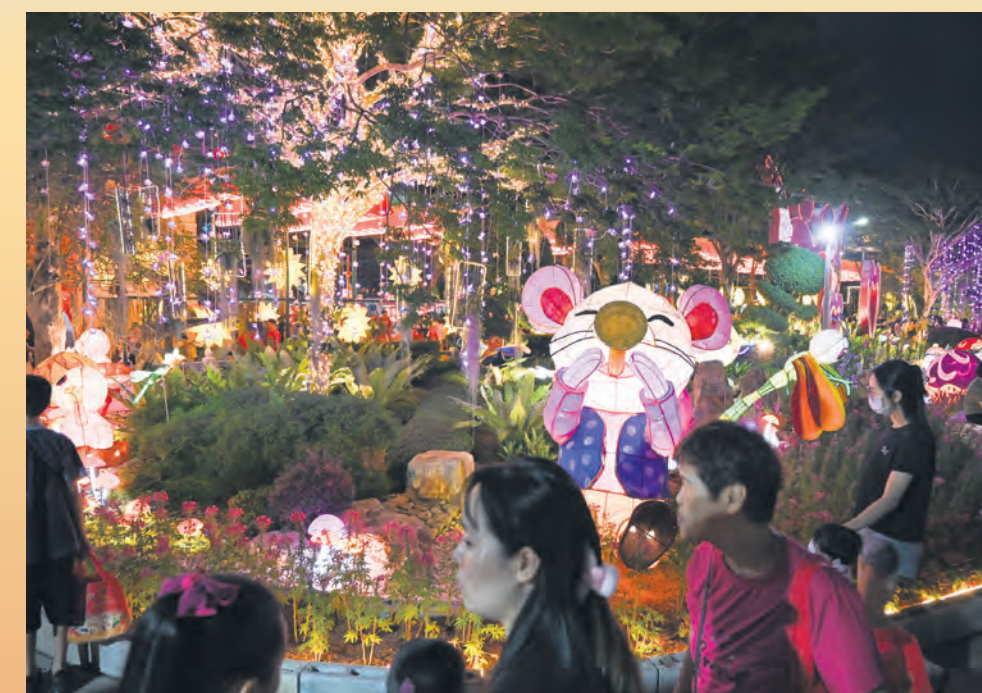
Taman Lumbini dalam Tokong Fo Guang Shan Dong Zen dihiasi lampu diod pemancar cahaya dan patung tikus gergasi menarik perhatian pengunjung