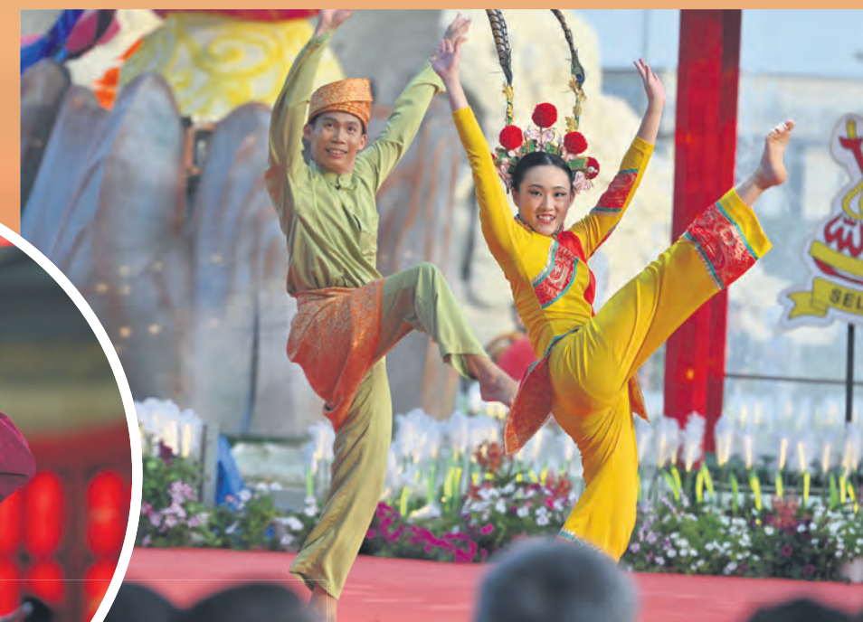
Lelaki Melayu dan wanita Cina lengkap berpakaian kebangsaan mempersembahkan tarian kebudayaan masing-masing