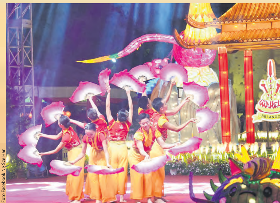
Pasukan tarian Dua Space Dance Theatre mempersembahkan Tarian Ular Emas atau dikenali Jin She Kuang Wu