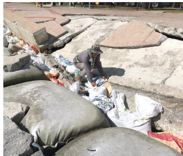
▲工人抢修摩立海边的损坏防堤，以迎接10月中旬的第二波大涨潮。