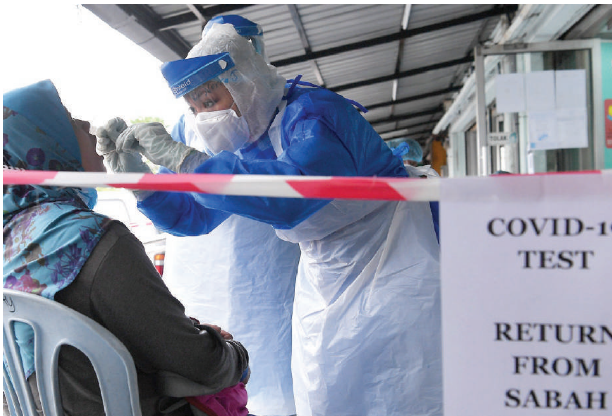
▲Selcare医护人员在蒲种的诊疗所为曾在近期前往沙巴的民众采集唾液样本, 以检测新型冠状病毒。

这些抗疫举措获得雪州人民的认同, 认为州政府的抗疫步骤迅速, 相信能及时遏止疫情在社区内蔓延。