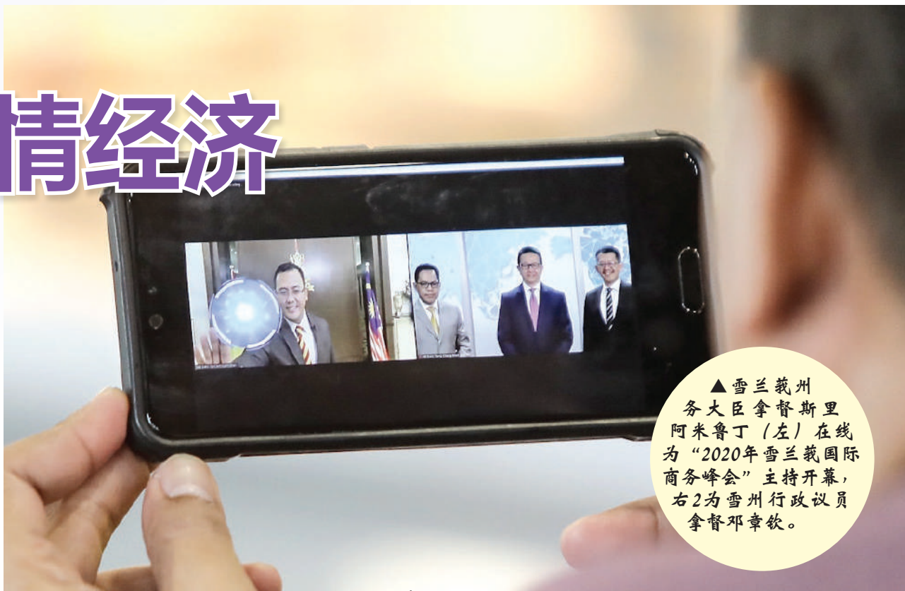
▲雪兰莪州务大臣拿督斯里阿米鲁丁(左)在线为“2020年雪兰莪国际商务峰会”主持开幕, 右2为雪州行政议员拿督邓章钦。

“州政府的远见和努力让雪州和本区域的制造商、决策者、出口商和进口商, 有机会继续