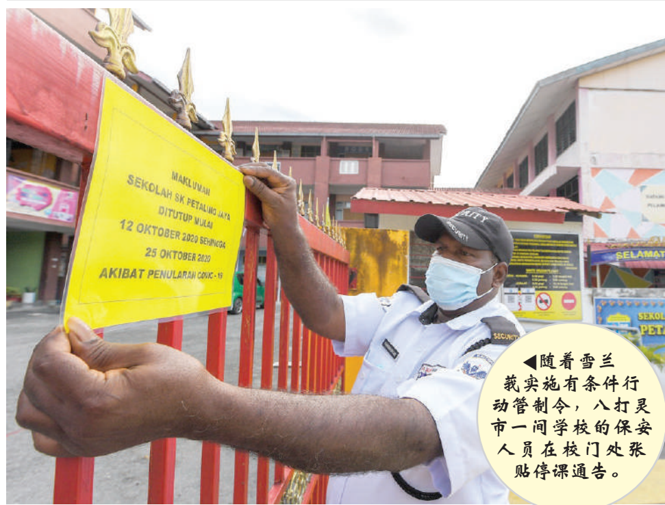
◀随着雪兰莪实施有条件行动管制令，八打灵市一间学校的保安人员在校门处张贴停课通告。

“学校在关闭期间，校长将确保老师和学生实施在家教学和学习，在家教学手册可以从教育部官方网站下载。”