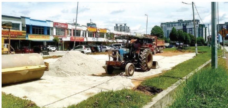
▲承包商施工在蒲种14里政府诊疗所旁的空地增建停车位。

他称早在三个月前已与黄思汉洽商此事, 计划较后在今年8月获得雪州经济策划单位的批准。