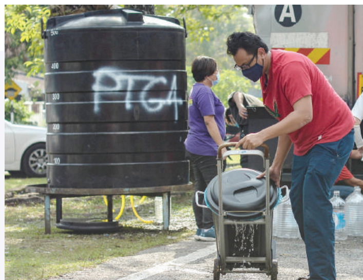
▲联邦政府拟修订1974年环境素质法令以严惩污染水源者，避免再有河流受污染，以致人民面对断水之苦。

环境及水务部长拿督端依布拉欣表示，政府拟修订1974年环境素质法令以严惩污染水源者，把最高的罚款额从现有的50万令吉提高至1000万令吉，预计在11月份提呈这项修正案至国会下议院。