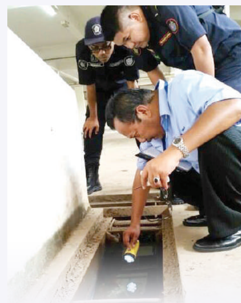
▲莎阿南市政厅官员检查各单位，确保没有黑斑蚊孑孓的存在。

他说，虽然卫生部目前全力对抗新冠肺炎疫情，但仍对骨痛热症采取了公共医疗行动，令今年的情况有所改善。