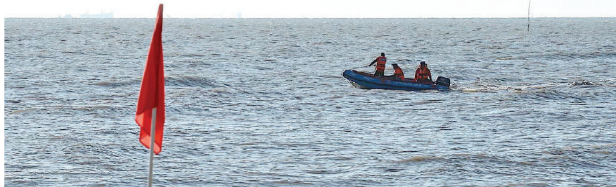
▲消防及拯救员加紧在海上巡逻，为第二波大涨潮做好防范工作。