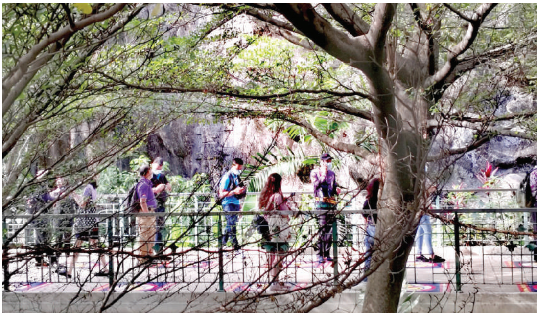
▲第三波的新冠肺炎疫情严重冲击我国各行各业，预计本地旅游业和酒店住宿业大受影响。（照片取自雪州旅游局网站）