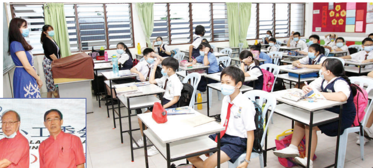
▲雪隆董联会要求联邦政府和雪州政府在八打灵县增建华小, 以纾缓大型华小每年学额爆满的问题。(档案照)

“我希望各造, 包括联邦政府一起配合, 批准兴建全新的独中, 而不是分校或迁校。只要人口稠密的地区有所需求, 我们就必须兴建全新的学校。”