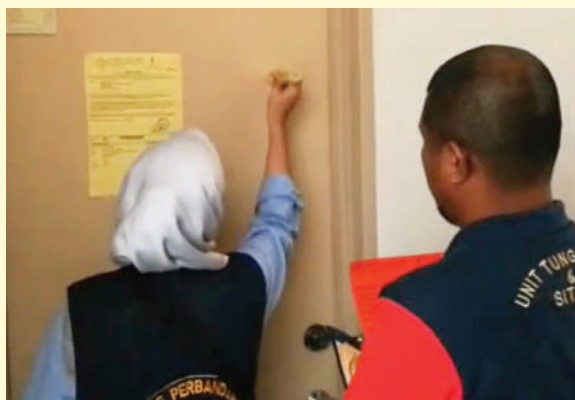
▲安邦再也市议会官员上门向拖欠门牌税的业主追讨税务。（档案照）