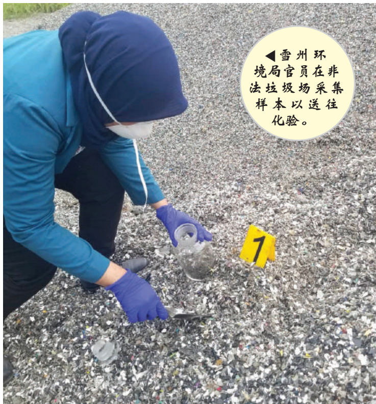
◀雪州环境局官员在非法垃圾场采集样本以送往化验。

(万津讯) 万津区一超市附近的空地被揭发遭人焚烧电子垃圾废弃物, 导致当地空气大受污染, 雪州环境局目前已查封有关非法垃圾场, 以彻查污染源头。