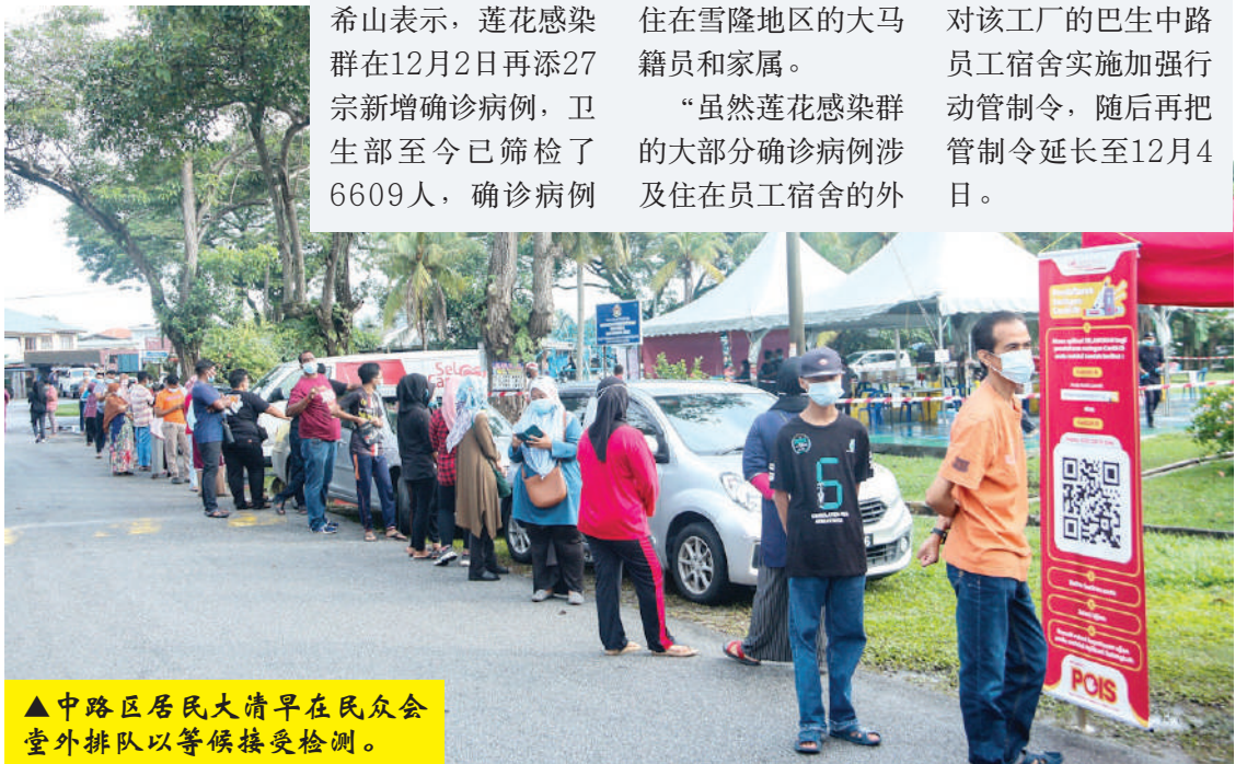
▲ 中路区居民大清早在民众会堂外排队以等候接受检测。