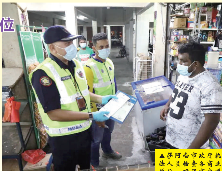
他希望全体莎阿南市民能严守标准作业程序，以配合当局尽快截断新型冠状病毒的传播链。

“市政厅在疫情期间也扩大消毒范围，消毒地点包括住宅区、警察局、商业中心等，以遏制新型冠状病毒的蔓延。”