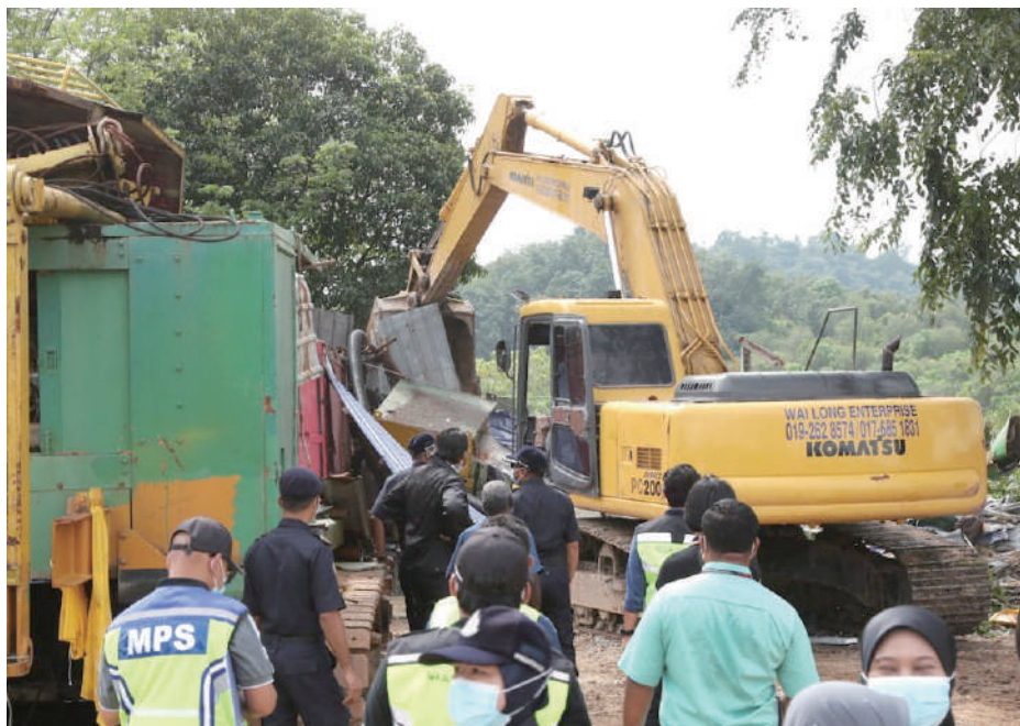
▲士拉央市议会执法人员连同鹅麦县土地局官员拆除一间违例兴建在河边的重型机械维修厂。

(万挠讯) 士拉央市议会连同鹅麦县土地局在短短一周内，拆除万挠区河边的3间非法重型机械厂，以免这些排放黑油和溶剂的工厂成为河流污染的“计时炸弹”。