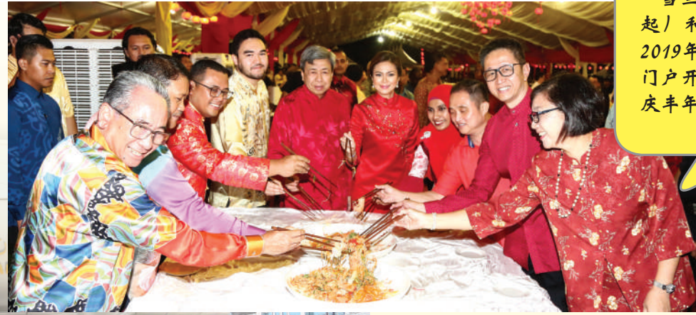
雪兰莪苏丹沙拉夫丁伉俪（右5起）和雪州王储东姑阿米尔沙在2019年2月16日的“雪州政府新春门户开放”活动上，与贵宾们捞生庆丰年。