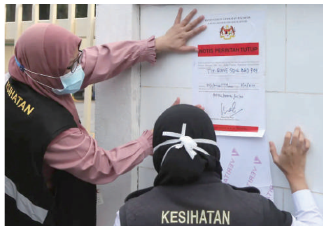
▲巴生县卫生局官员在11月25日关闭顶级手套位于巴生中路区的7间工厂, 以遏制新冠肺炎疫情的扩散。

(莎阿南讯) 由于顶级手套公司的雪州巴生员工宿舍仍出现新冠肺炎新病例, 国家安全理事会宣布该员工宿舍的加强行动管制令 (PKPD) 延长14天, 从12月1日至14日。