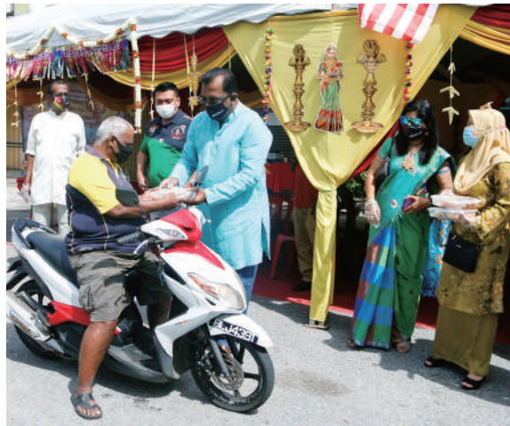
▲圣淘沙区州议员古纳拉（右）通过得来速方式派发礼品及食品给宾客。

此外，圣淘沙区州议员服务中心配合屠妖节也举办“屠妖节居家装饰活动”，优胜者可获得丰富的奖品。