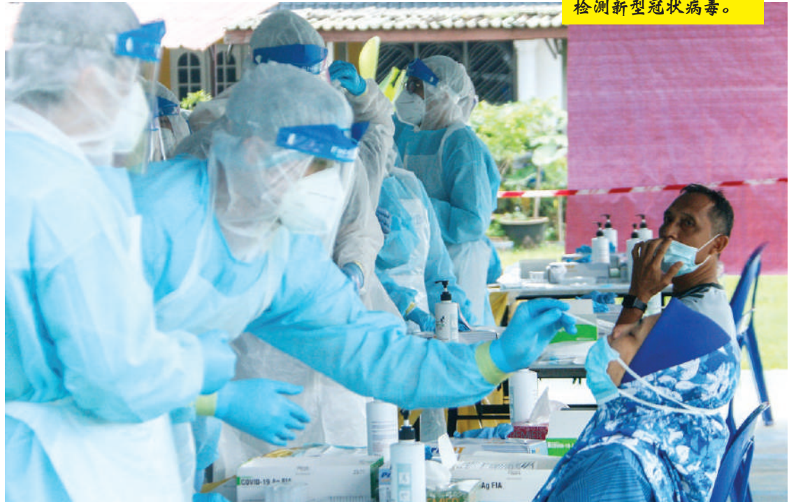
▼ 医护人员为中路居民检测新型冠状病毒。