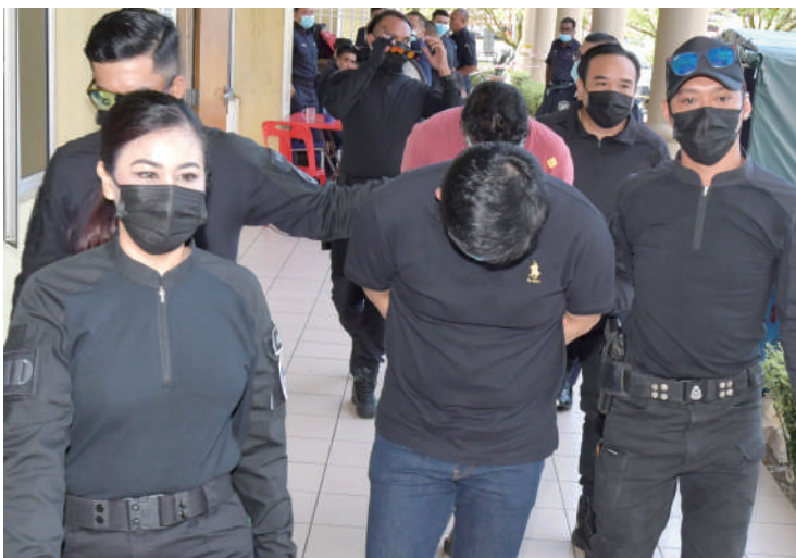
▲两名男被告11月23日被带上士拉央法庭面控。

他说，由工厂流出的黑油和溶剂成为河流污染的最大肇因，因此州政府在此课题上绝不妥协。