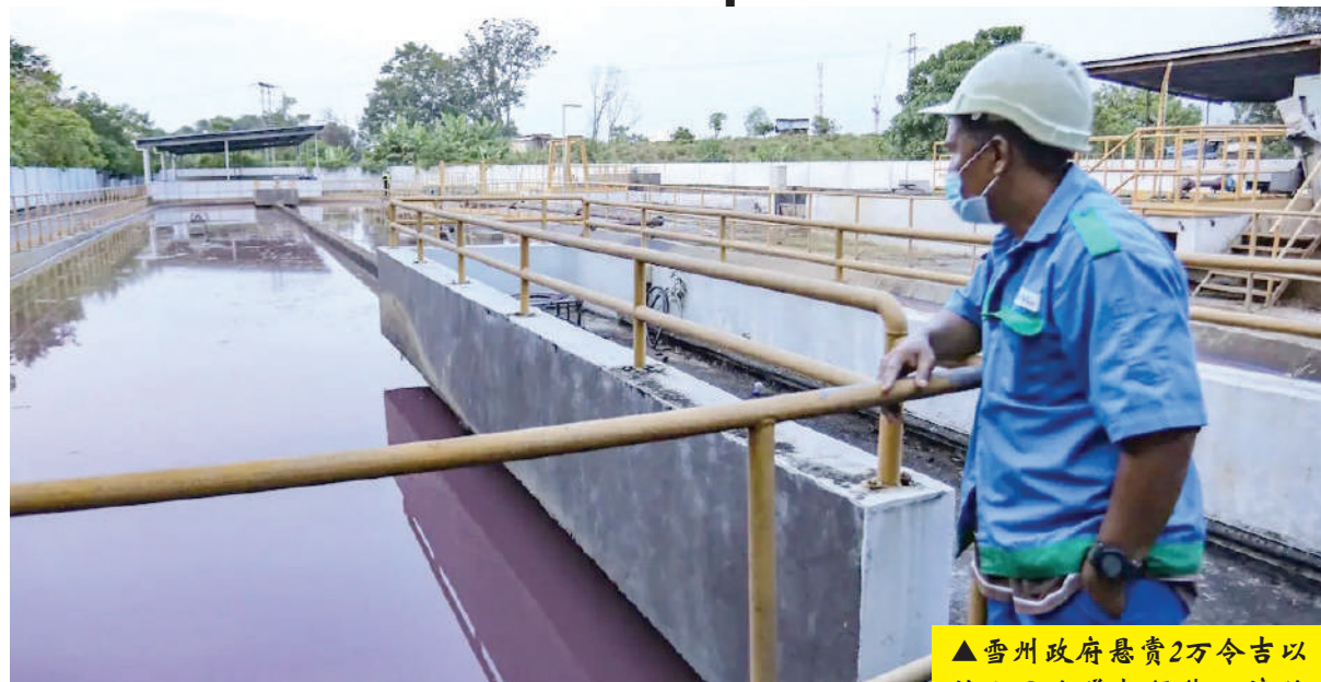
▲雪州政府悬赏2万令吉以鼓励民众举报污染环境的祸首。