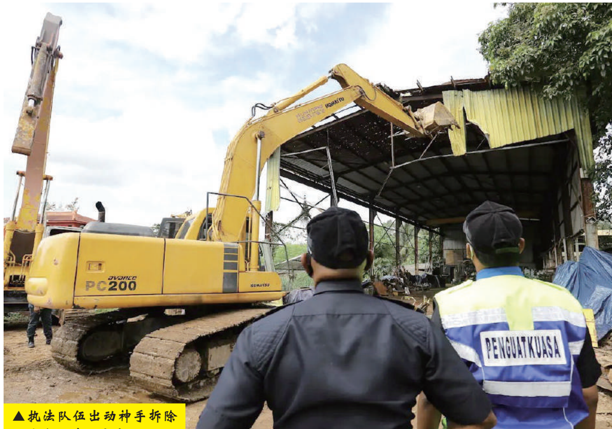
▲执法队伍出动神手拆除兴建在河畔的非法工厂。