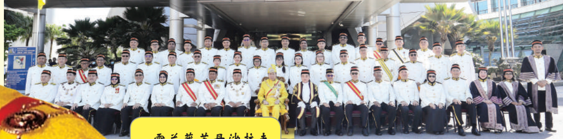
雪兰莪苏丹沙拉夫丁出席雪州足球杯赛事时与足球队员问好。