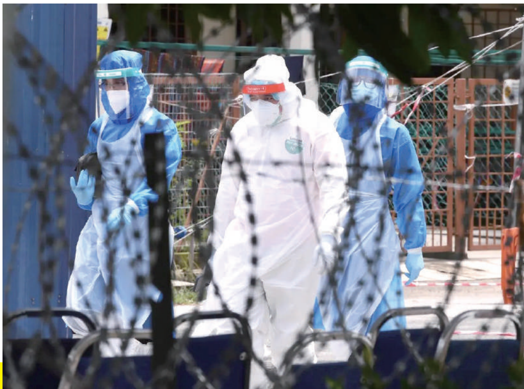
►医护人员在雪州巴生中路的加强行动管制区展开筛检工作。

随着国内的加雅感染群涉及吉隆坡国际机场的货运工人, 州政府采取积极措施以截断该感染群的病毒传播。