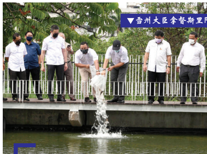
▼雪州大臣拿督斯里阿米鲁丁(左4)在巴生石头码头公园主持鱼只放生仪式, 左3是雪州行政议员拿督邓章钦。

他欢迎有兴趣捐款者可联络017-600 7026查询, 或把款项汇入建校委员会的马来西亚(MAYBANK)银行账户, 户口号码: 5128 8421 0251。