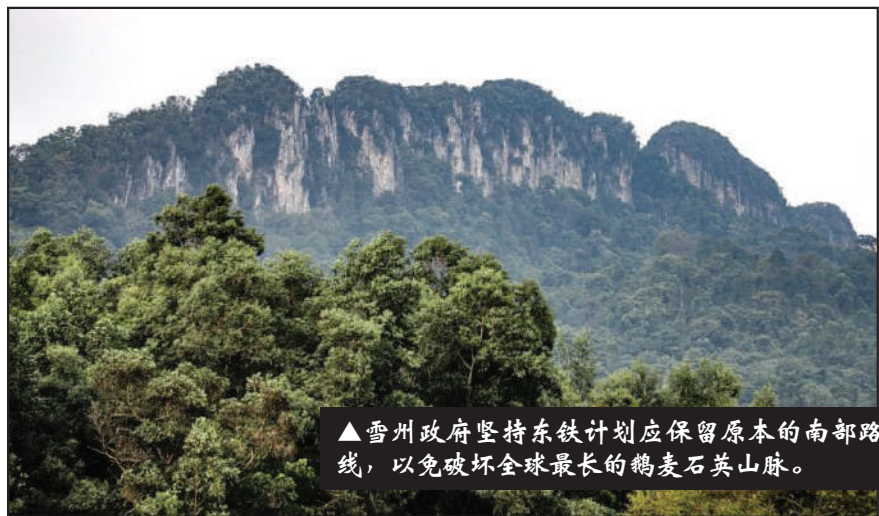
▲雪州政府坚持东铁计划应保留原本的南部路线, 以免破坏全球最长的鹅麦石英山脉。

(莎阿南讯) 雪兰莪州政府的立场始终不变, 坚持东海岸铁路计划 (ECRL) 应保留原本的南部路线, 以免破坏州内的环境和水供系统, 继而影响人民的利益。