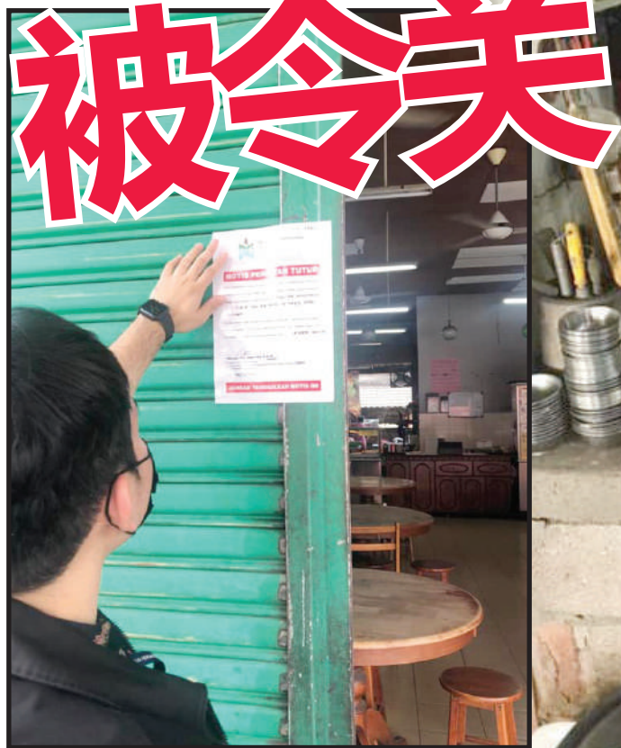
▲加影市议会官员检查各食肆，发现一些食肆的卫生情况恶劣，在肮脏的食肆大门张贴查封令。