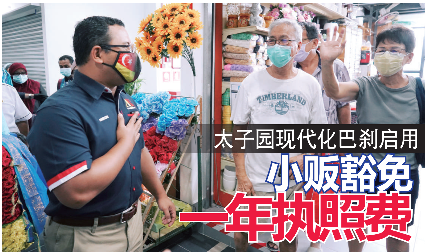
▲雪兰莪州务大臣拿督斯里阿米鲁丁（左）巡视太子园现代化巴刹时，与前来采购货物的华裔顾客交流。