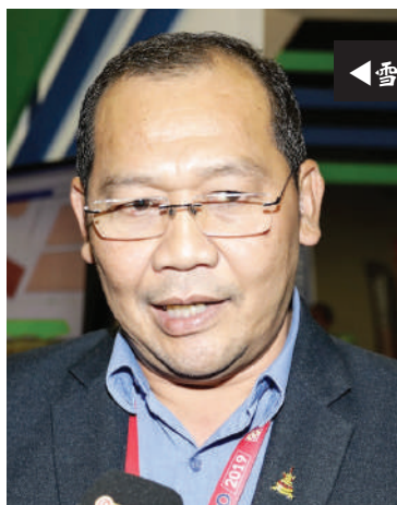
◀雪州行政议员凯鲁丁