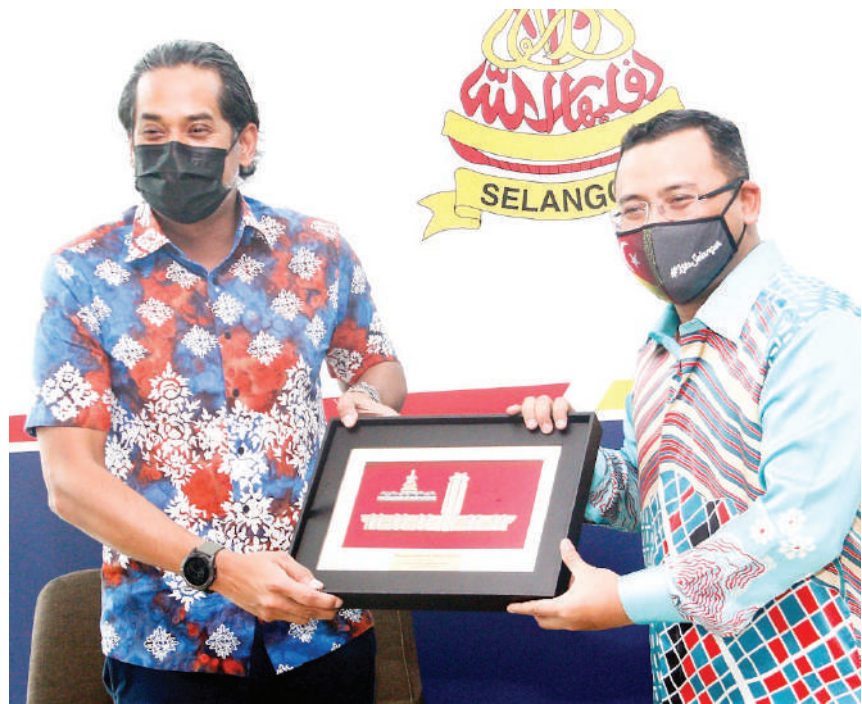
▲雪州大臣拿督斯里阿米鲁丁（右）赠送纪念品给全国新冠疫苗接种计划协调部长凯里。