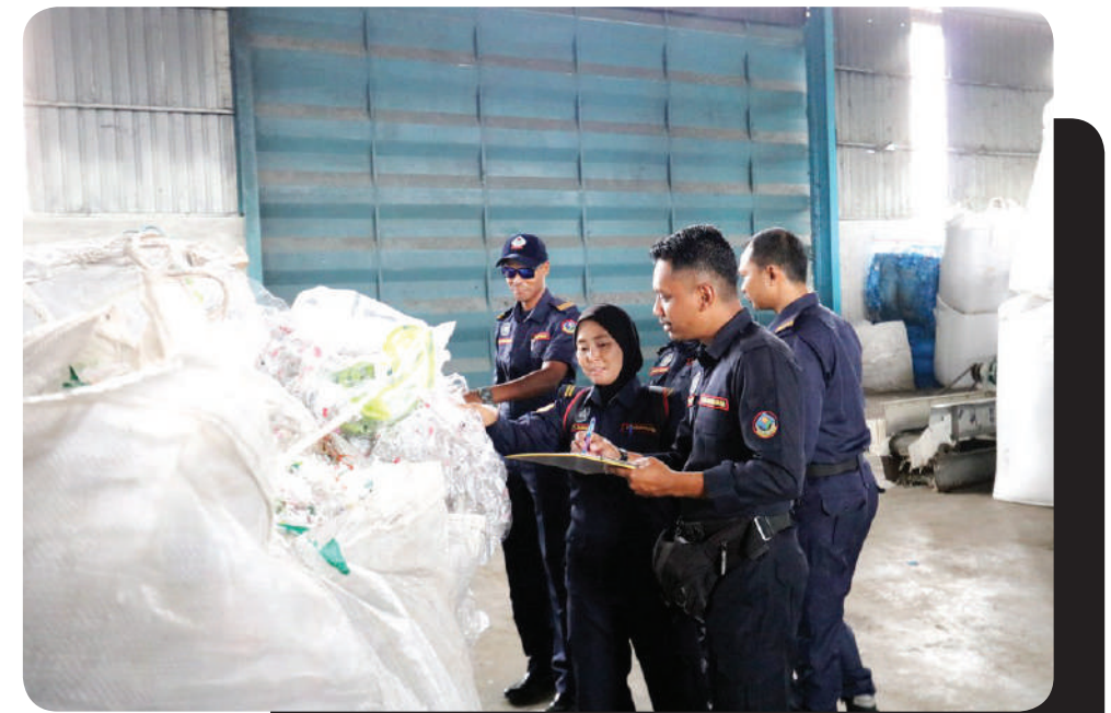
▲雪州政府严打非法洋垃圾厂，在过去3年来已关闭了200间非法洋垃圾厂。

“只要接获破坏环境或抵触法令的工厂举报，州政府即会与相关单位采取对付行动，也不允许这些工厂参与漂白计划或合法化他们的工厂，以维护雪州和人民的权益。”