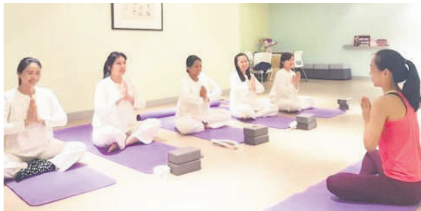
▲陪月中心为产妇顾客提供瑜伽课程。

时说，若没有持有由地方政府发出的合法执照，陪月中心业者在为客户处理保险等事务时也诸多不便。