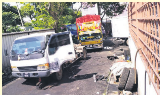
▲一家印刷公司违例在后巷维修重型车辆，因此接获士拉央市议会开出的罚单。