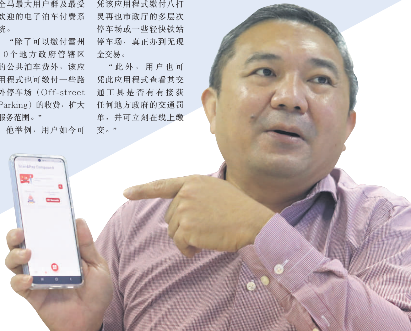
雪州行政议员黄思汉向记者介绍“雪州精明泊车”手机应用程序的使用好处。