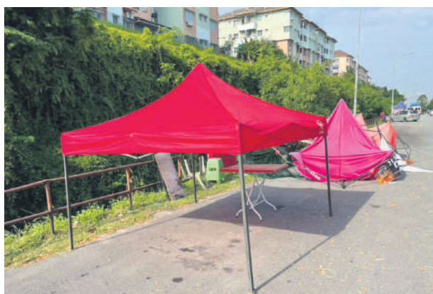
▲加影市议会执法官员取缔先锋镇花园路边的非法摊位。

这5个废油回收站地点分别是:直乐园的D' Muara 烧鱼店、大港的Kuala Kurau餐馆沙白Tebedu Sabak路的美食中心、大港的英雄花园,以及适耕庄的Sri Kassim餐馆。