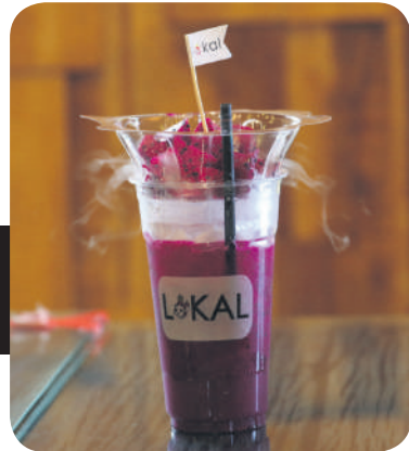
▶火龙果摇身一变成成为桌上的各式菜肴主角，包括清爽可口的火龙果汁、家乡风味的火龙果面包咖喱鸡，以及色彩斑斓的火龙果椰浆饭。