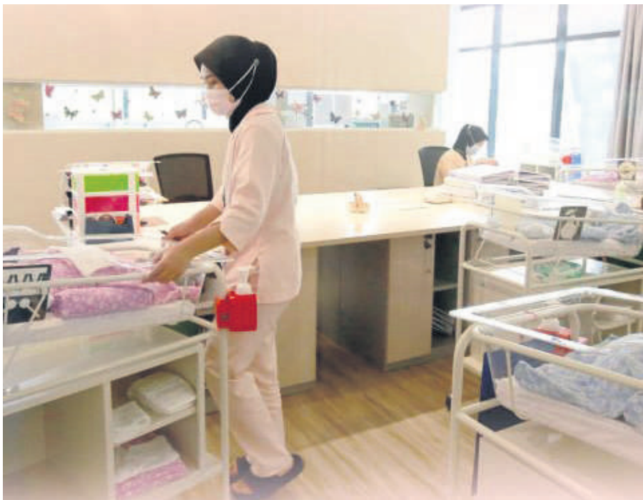
▲巴生谷的陪月中心如雨后春笋般涌现，为母婴提供专业的陪月照料服务。

(莎阿南讯)雪州政府推出指南以合法化陪月中心，确保这些中心在符合安全标准下营业，保障母婴的安全，成为全马首个立法管制陪月中心的州属。