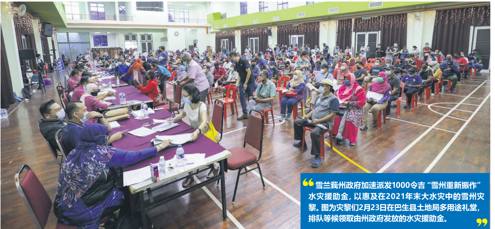
“雪兰莪州政府加速派发1000令吉“雪州重新振作”水灾援助金, 以惠及在2021年末大水灾中的雪州灾黎。图为灾黎们2月23日在巴生县土地局多用途礼堂, 排队等候领取由州政府发放的水灾援助金。”

州政府截至2022年2月21日已发放逾7260万令吉水灾援助金, 惠及7万2451户水灾灾黎, 包括发放13万令吉的抚恤金给予13户罹难者家属。