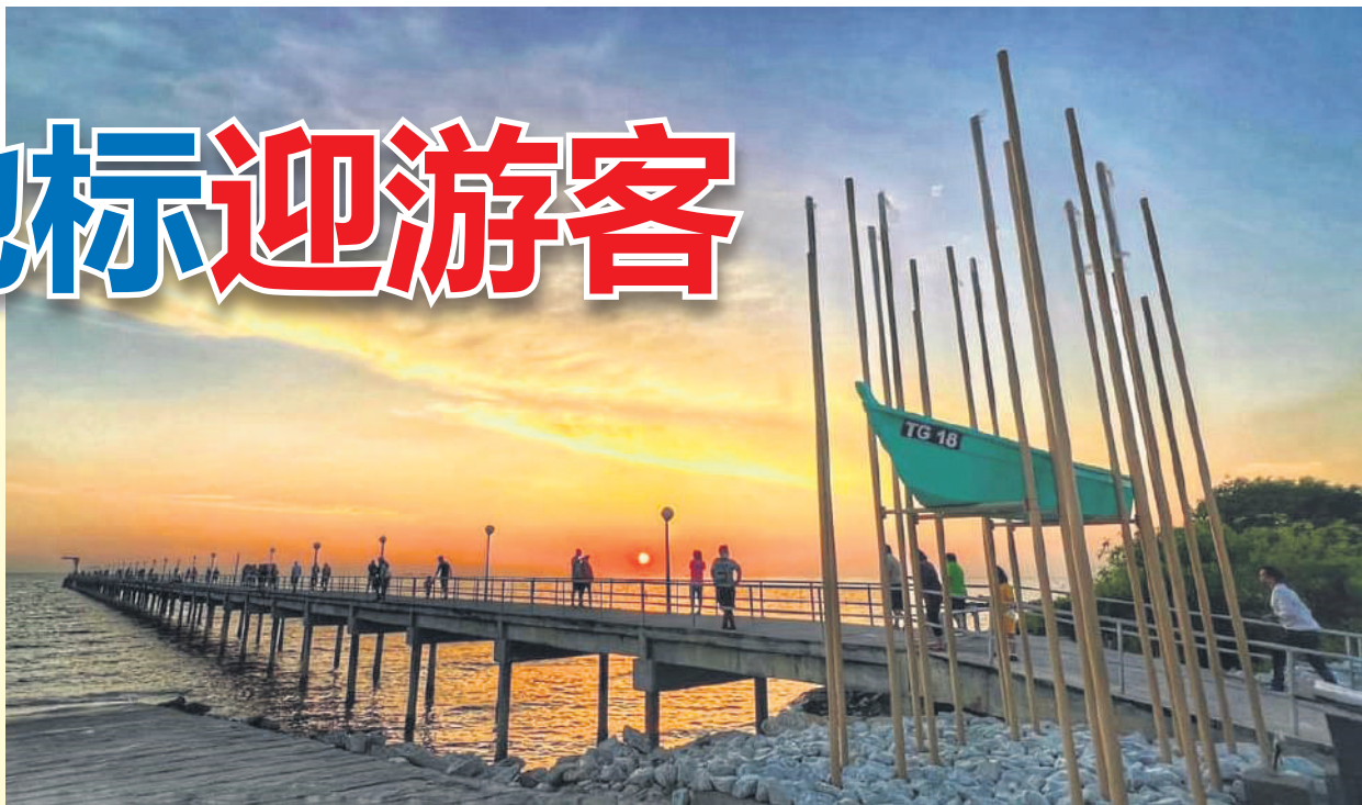
▲“红树林中的船”坐落在情人桥旁，在夕阳下，一幅美丽的风景尽收眼帘。

他说，在情人桥旁设有一座美食中心，由瓜冷市议会出资300万令吉打造，里面有6间美