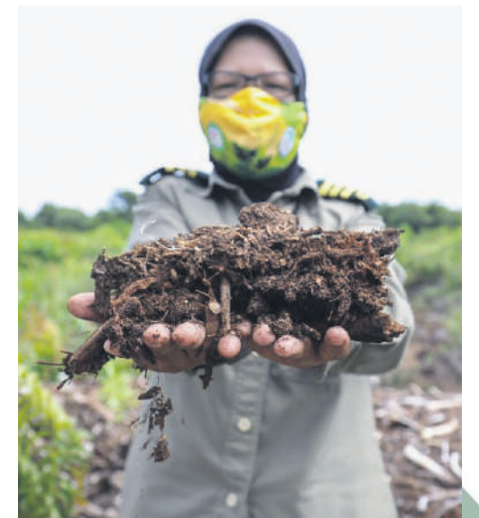
▲双溪班让森林保留地吸收雨水的能力强，有助防止水灾等自然灾害。