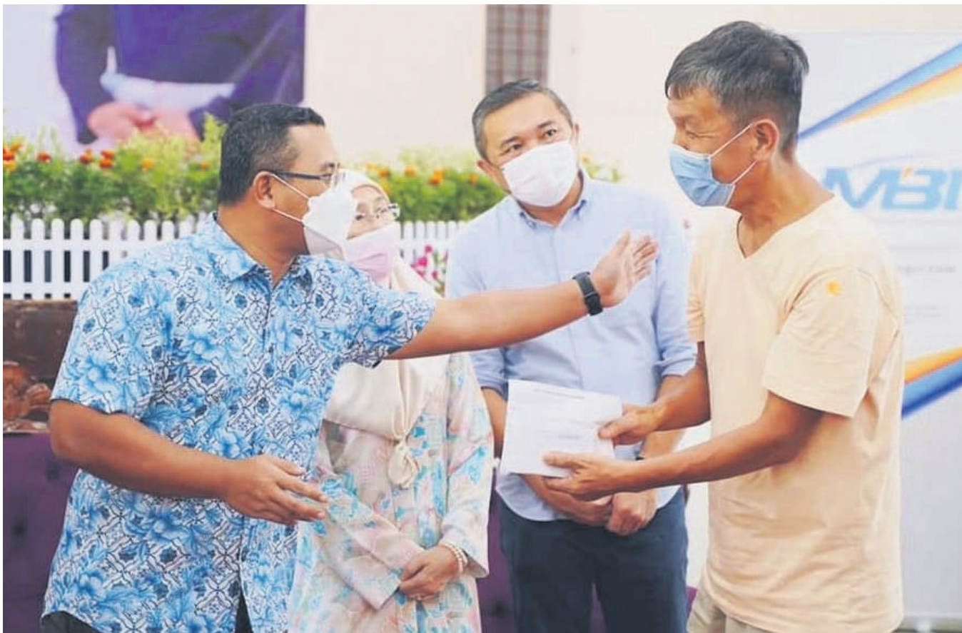
▲雪州大臣拿督斯里阿米鲁丁(左)移交援助金给一户灾黎代表,左2起班丹区国会议员拿督斯里旺阿兹莎和雪州行政议员黄思汉。

雪州安邦武吉柏迈(2)花园在今年3月10日发生土崩事故,夺走4条人命,同时摧毁15间民宅和10辆交通工具。