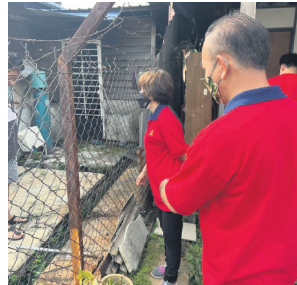
▲仁嘉隆新村村委会成员在屋外向村民说明如何杜绝蚊虫滋生。