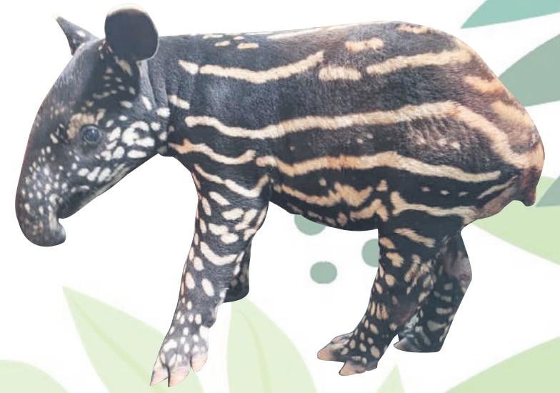
▲双溪杜顺保育中心在今年3月份喜迎一只马来貘幼崽。