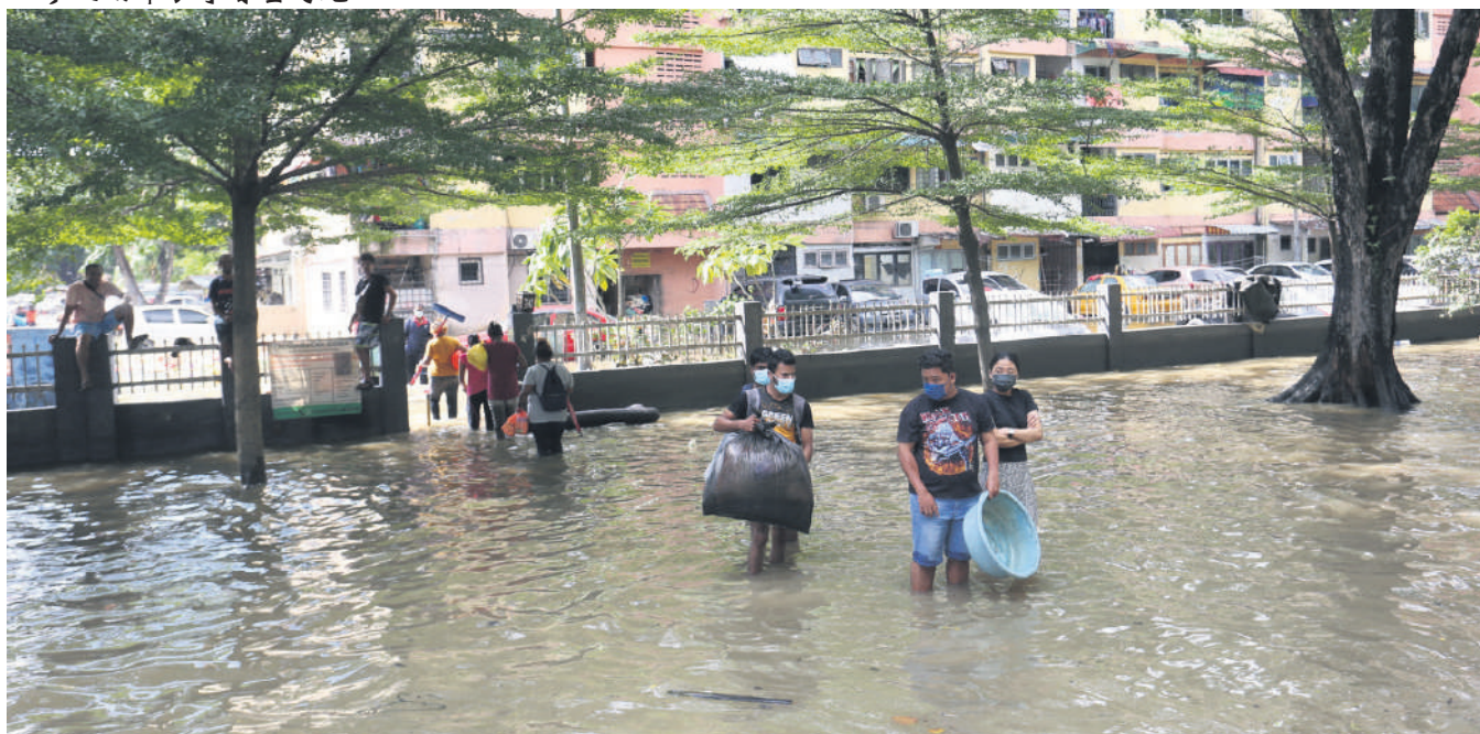
▲莎阿南市政厅拨款1亿5000万令吉根治管辖区内的水患问题，太子园是其中一个重点治水区。

“国州议员的意见非常重要，确保这项大型的防洪蓝图能够一次性的解决和整顿各区的水灾问题，协助居民摆脱水患困扰。”