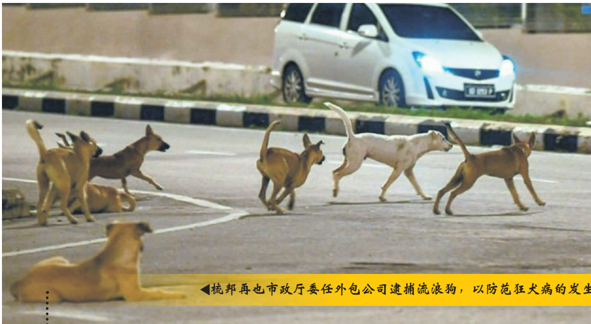
◀梳邦再也市政厅委任外包公司逮捕流浪狗，以防范狂犬病的发生。