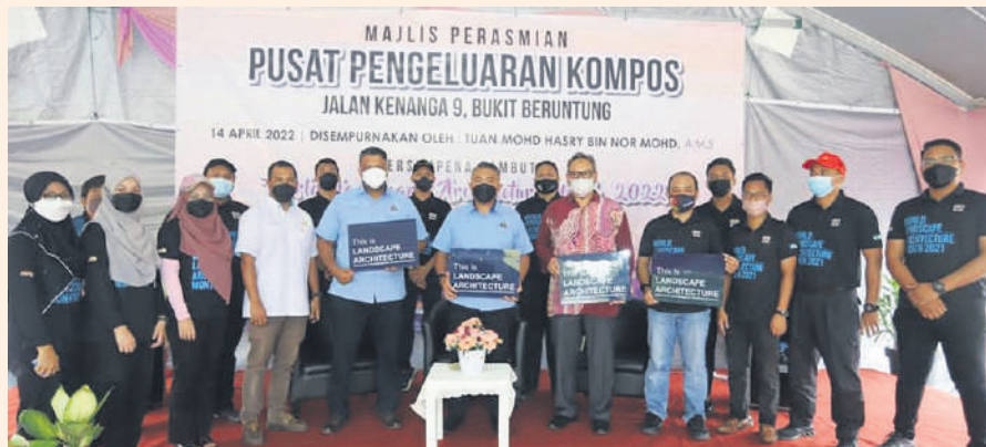
▲乌鲁雪兰莪市议会设立堆肥中心，把管辖区的园艺垃圾变成有机肥料。

他说，市议会希望藉此堆肥中心的存在，能够为管辖区的园景增加附加价值，同时堆肥中心所生产的肥料也可成为市议会的额外收入来源。