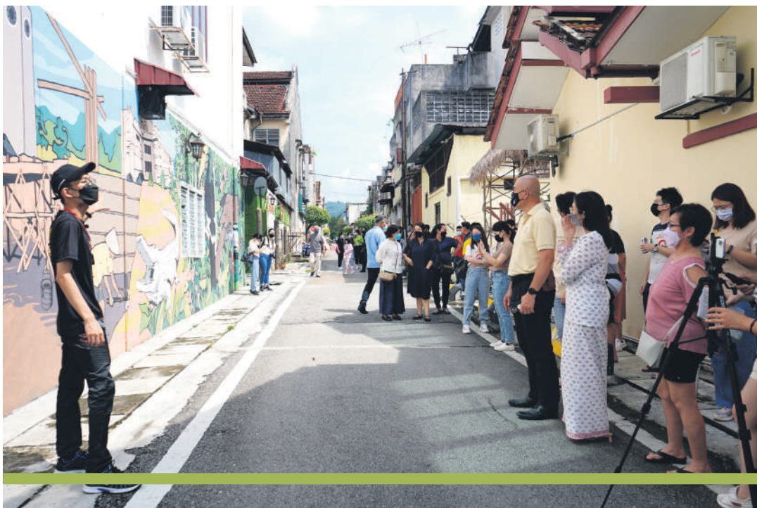
▲参与者在地方青年导游的带领下穿越老街，发掘新古毛的人文历史。

她感谢《雪州誌》002期，以20页篇幅详细及深入报导新古毛的人文历史，让新古毛走向世界，同时也让世界认识新古毛。