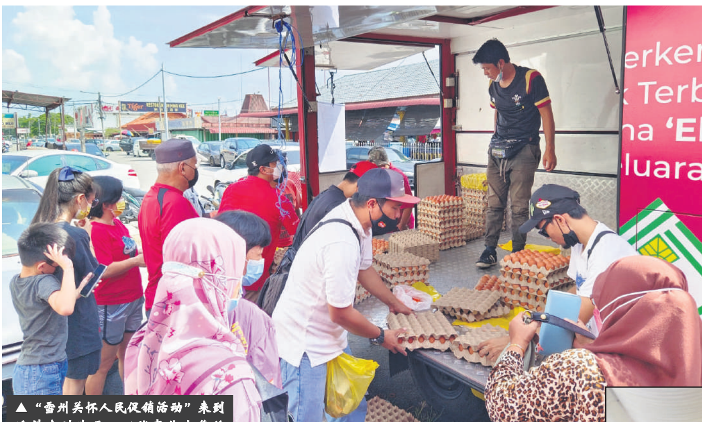
▲“雪州关怀人民促销活动”来到适耕庄州选区，以优惠价出售的600托鸡蛋和300只净鸡，在短短两小时内被抢光！

他说，每立方米水的真正成本是3令吉，用户目前只支付1令吉50仙，其余由雪州水供管理公司承担。