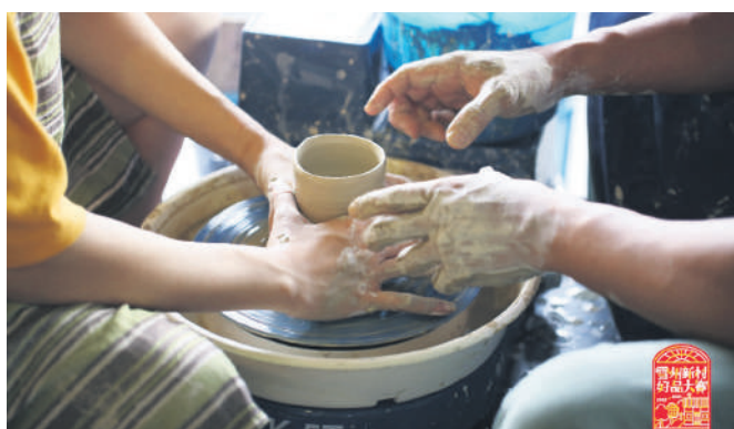
▲魅力市集有手工软陶,让民众过一过“手瘾”。