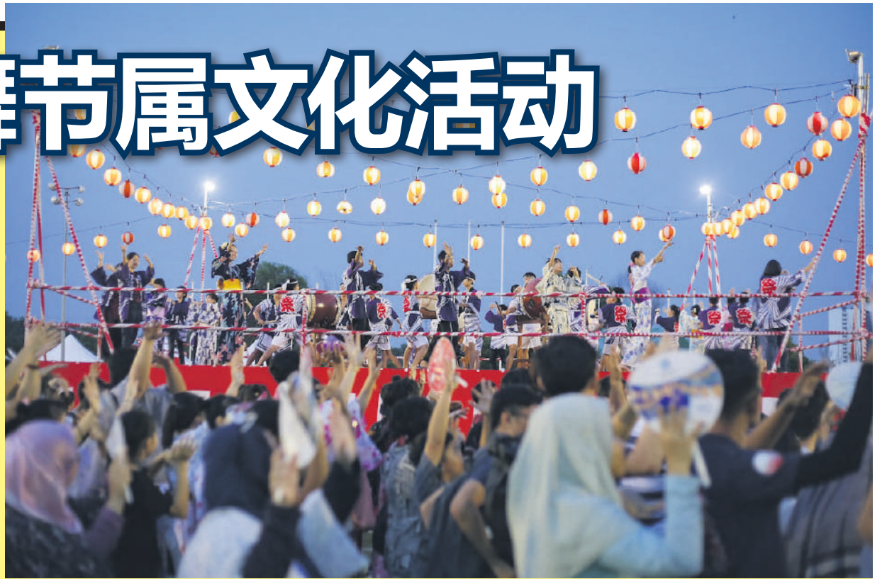
▲日本盆舞节连续多年在莎阿南体育馆举办，促进日本与雪州人民的文化交流。

殿下也建议掌管宗教事务的首相署部长亲自参与7月16日，在莎阿南国家体育馆举办的盆舞节活