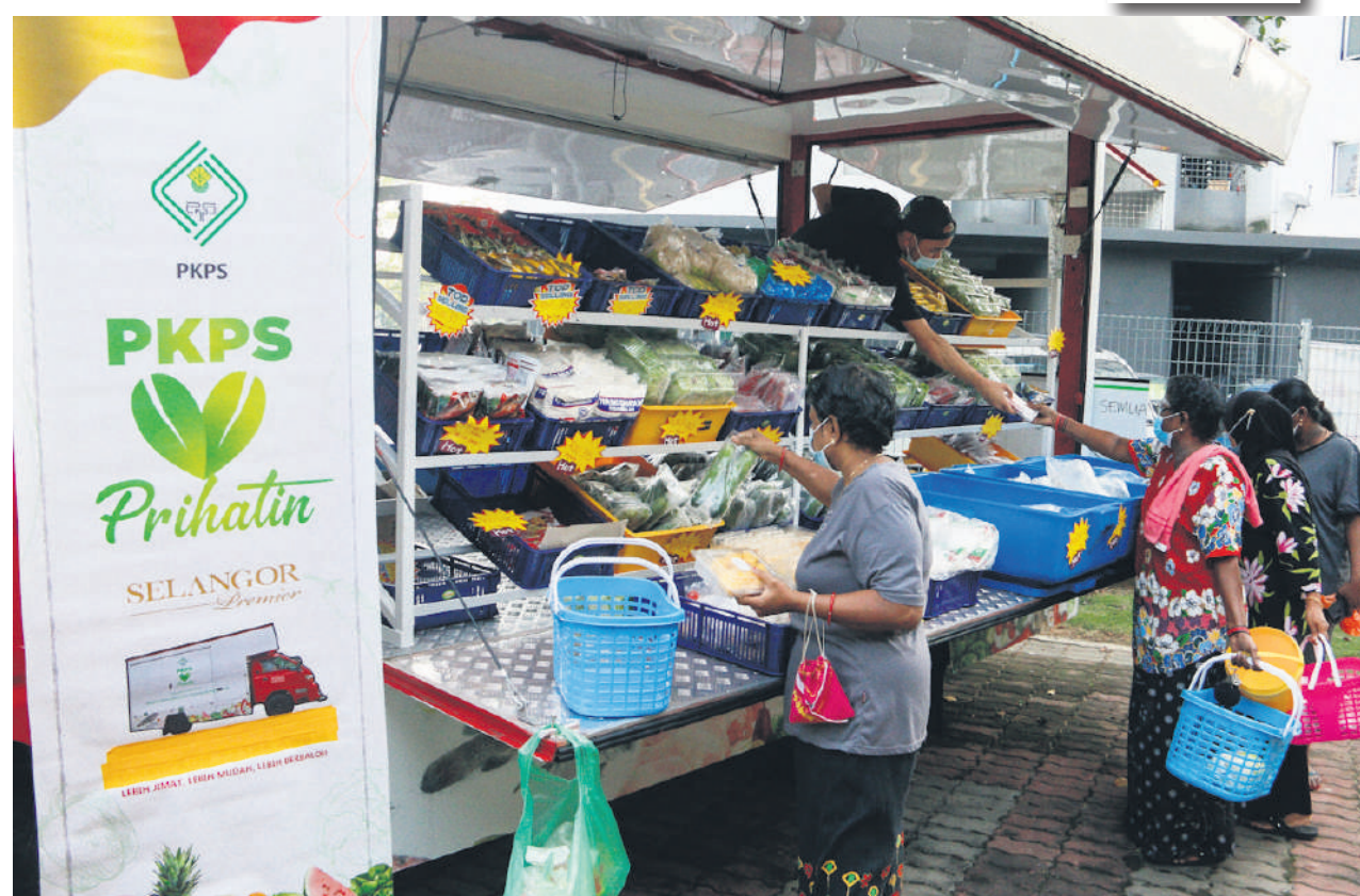
▲雪州农业发展机构致力打造粮食安全网，着重发展雪州种植业和农业。

“一旦这项跨州种植玉米合作计划收成，有助雪州在未来减少对进口饲料的依赖，鼓励自给自给和让农民以更优惠价购买本地饲料。”