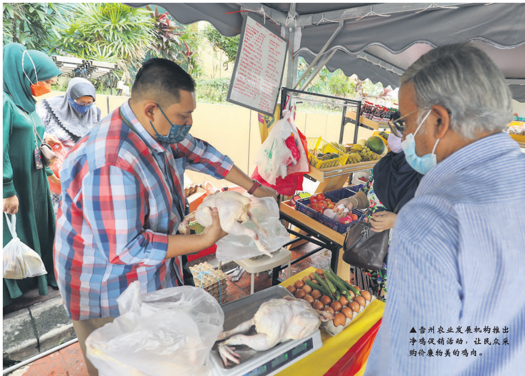
▲雪州农业发展机构推出净鸡促销活动，让民众采购价廉物美的鸡肉。

人民逾两年来面对新冠疫情和物价高涨带来的冲击，促使州政府此时必须介入应对，以保障人民的利益。