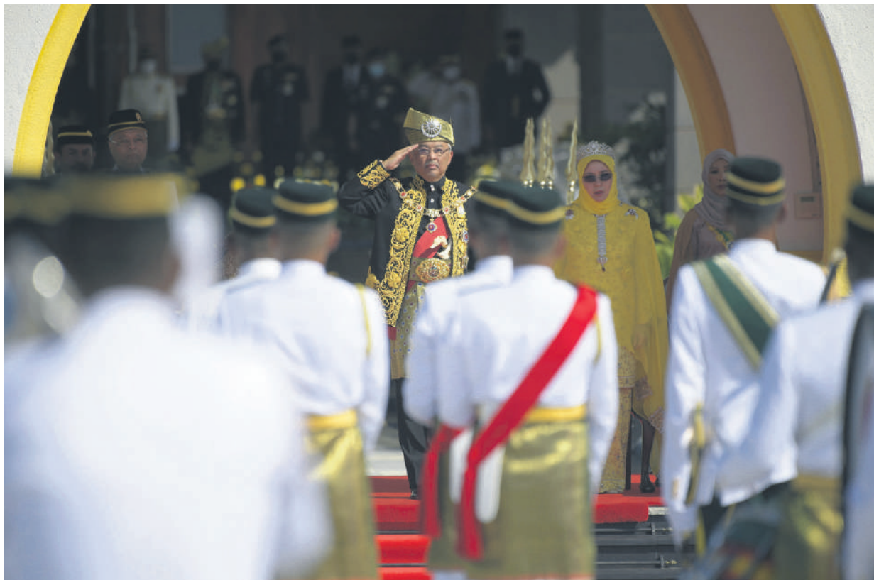
▲国家元首苏丹阿都拉陛下检阅仪仗队。