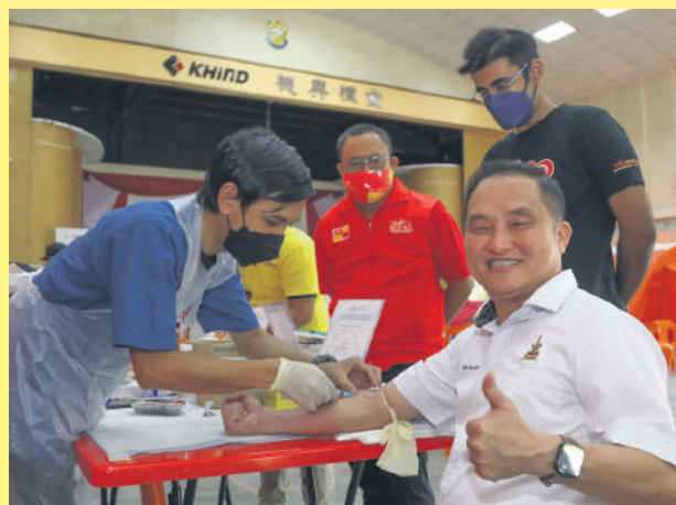
▲适耕庄区州议员黄瑞林（右）也趁机接受身体检查，确保有健康体魄为民服务。

她说，由于许多民众没有定期接受身体检查，以致对身患糖尿病、高血压等慢性疾病毫不知情，一旦发现时的病情已趋严重。