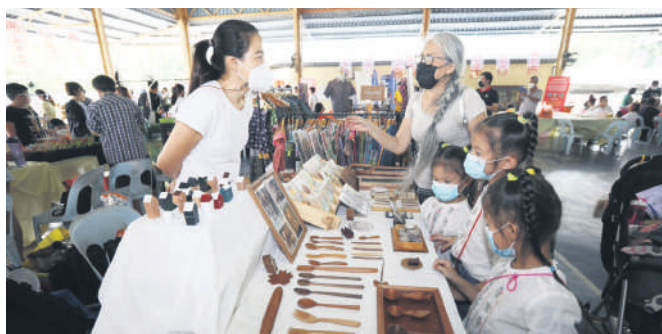
▲“相遇,在新村”雪州魅力市集汇聚各特色的手作品。