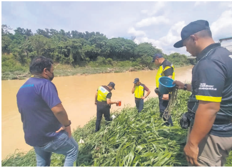
▲雪州水务管理局官员频密采集河水检测，确保滤水站运作不受影响。

(莎阿南讯)雪州水务管理局(LUAS)连续两天迅速行动以鉴定污染源，令邻近的冷岳河免受污染，保住雪隆区3个滤水站的运作。