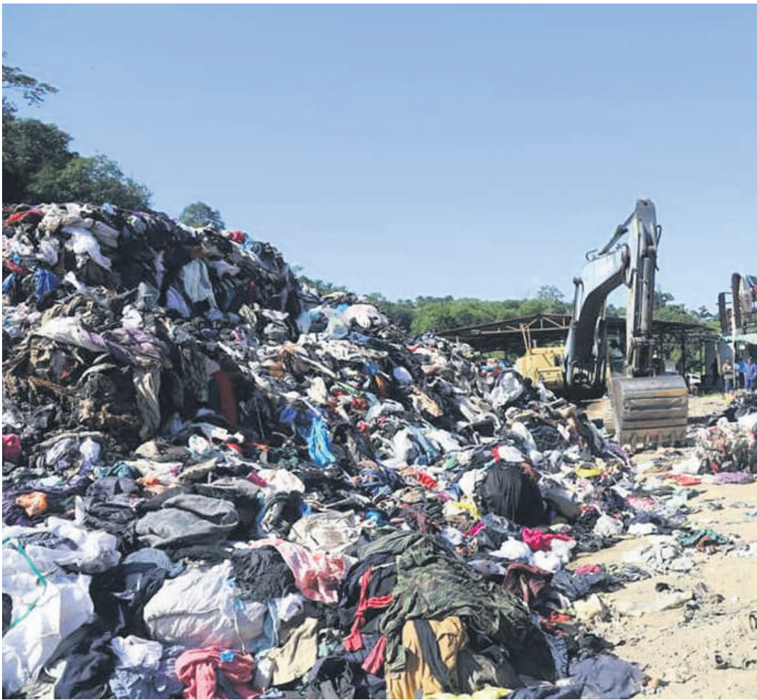
▲二手衣回收厂非法营业遭乌雪市议会查封。