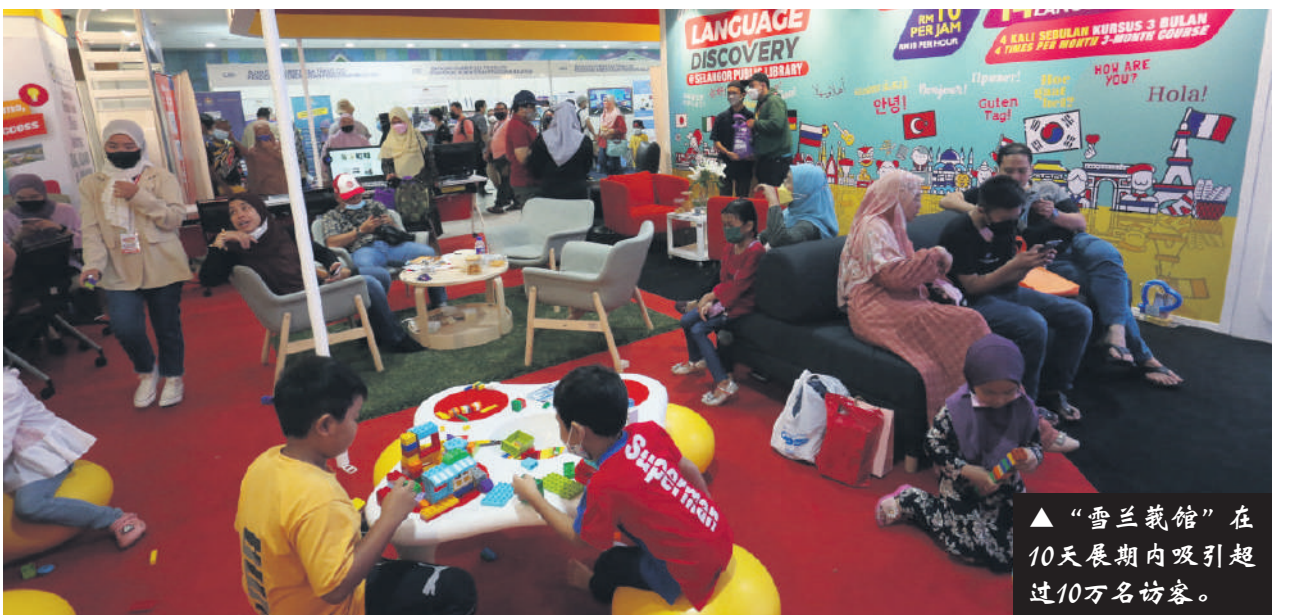
▲“雪兰莪馆”在10天展期内吸引超过10万名访客。

2022年吉隆坡国际书展经历两年的线上举办模式后，6月3日至12日以实体方式与书迷们会面。