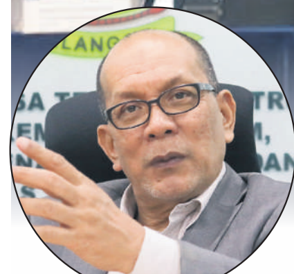
▲雪州行政议员依兹汉