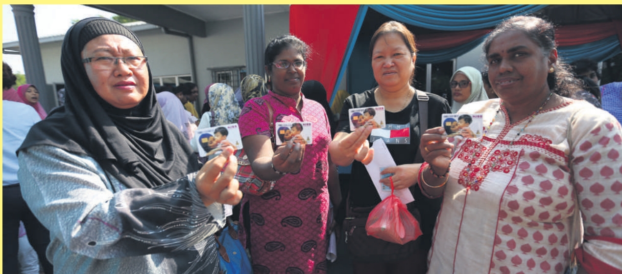
▲雪州政府将在关爱计划巡展上推介一系列的惠民计划。

同时，“精明关爱母亲”计划(KISS)和“精明关爱单亲母亲”计划(KISS-IT)经改良后，易名为“雪州和谐生活补助金”计划，让3万户低收入家庭每年可获得3600令吉，或每月300令吉的生活补助金。