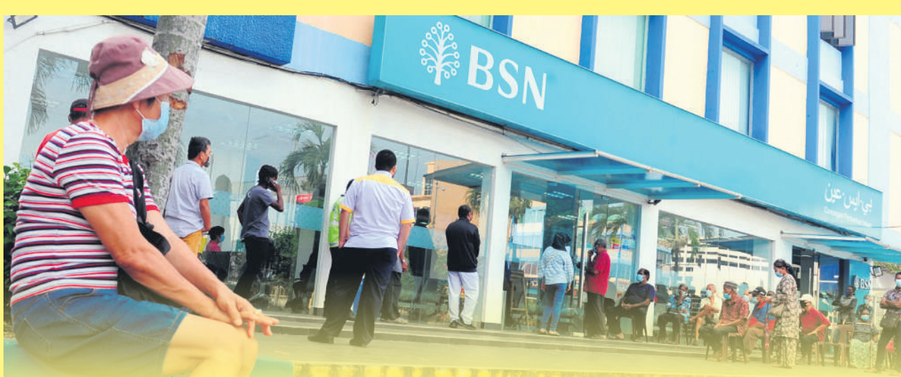
▲希盟反对重启消费税的建议，以免人民的生活负担百上加斤。

卫生部前部长阿汉峇峇5月25日表明，本身愿意配合反贪会对这些医药采购舞弊案的调查。