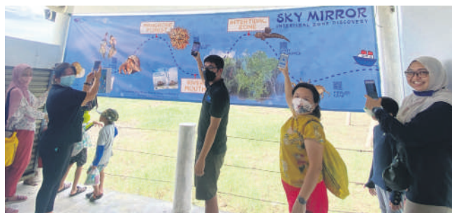
◀游客如今在天空之镜还可借助导赏员的解说, 进一步探索大自然的奥妙。