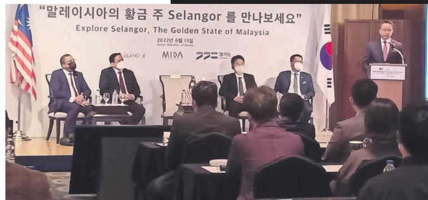
▼雪兰莪州行政议员拿督邓章钦(右)在首尔举行的“雪兰莪州投资研讨会”上发表主旨演讲。

“雪州完善的本地配套产业生态系统和优秀的劳动力，已准备好支持高科技相关企业的扩张或新投资。”