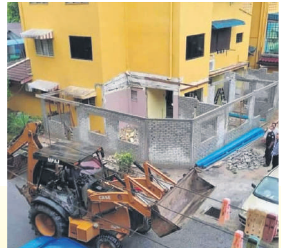
▲安邦再也市议会执法官员拆除违例扩建的组屋单位。

“我们希望民众配合和尽量照顾居家环境的卫生，尤其消除家中的积水区，以免沦为黑斑蚊滋生的温床。”