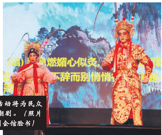
▶ “潮人文化”活动将为民众呈现难得一见的潮剧。

大会当天也设有15档至20档潮味美食, 包括经典卤味(鸭、蛋、肉、肠、豆腐)、蚝煎、腌虾姑、潮州粿、粽子。