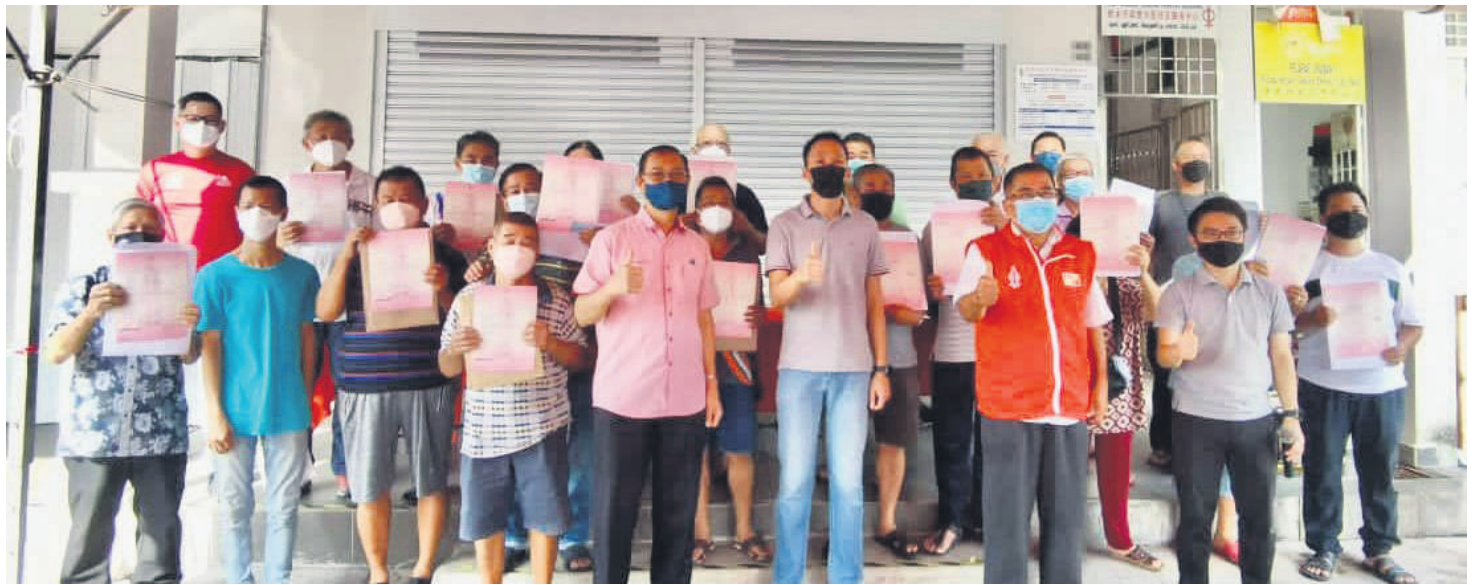
▲第二批的22户顺达花园居民顺利取得一纸家园地契。

1/19a、1/19b、1/19c及1/19d路的顺达山庄双层廉价屋,并于1992年入住。