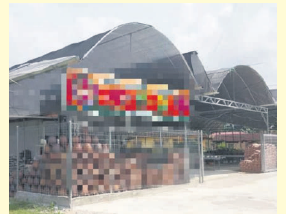
▲瓜冷市议会指示业者尽快拆除非法扩建之处。

此外,市议会提醒市民和商家应先取得当局的批准,才可以动工兴建或装修建筑物,以免受对付。