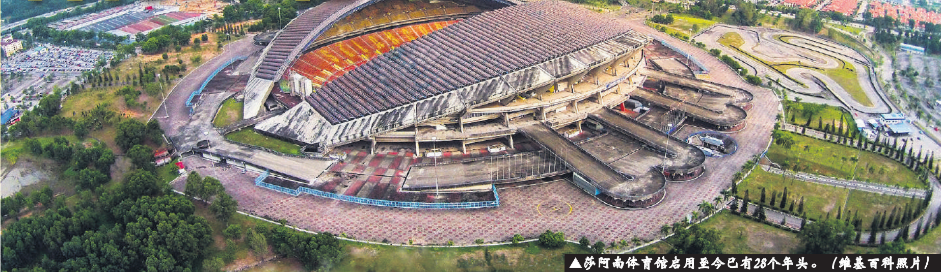
▲莎阿南体育馆启用至今已有28个年头。