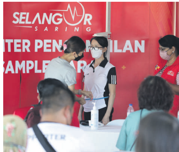
▲雪州政府在各州选区举办免费体检活动, 协助民众保住个人健康。