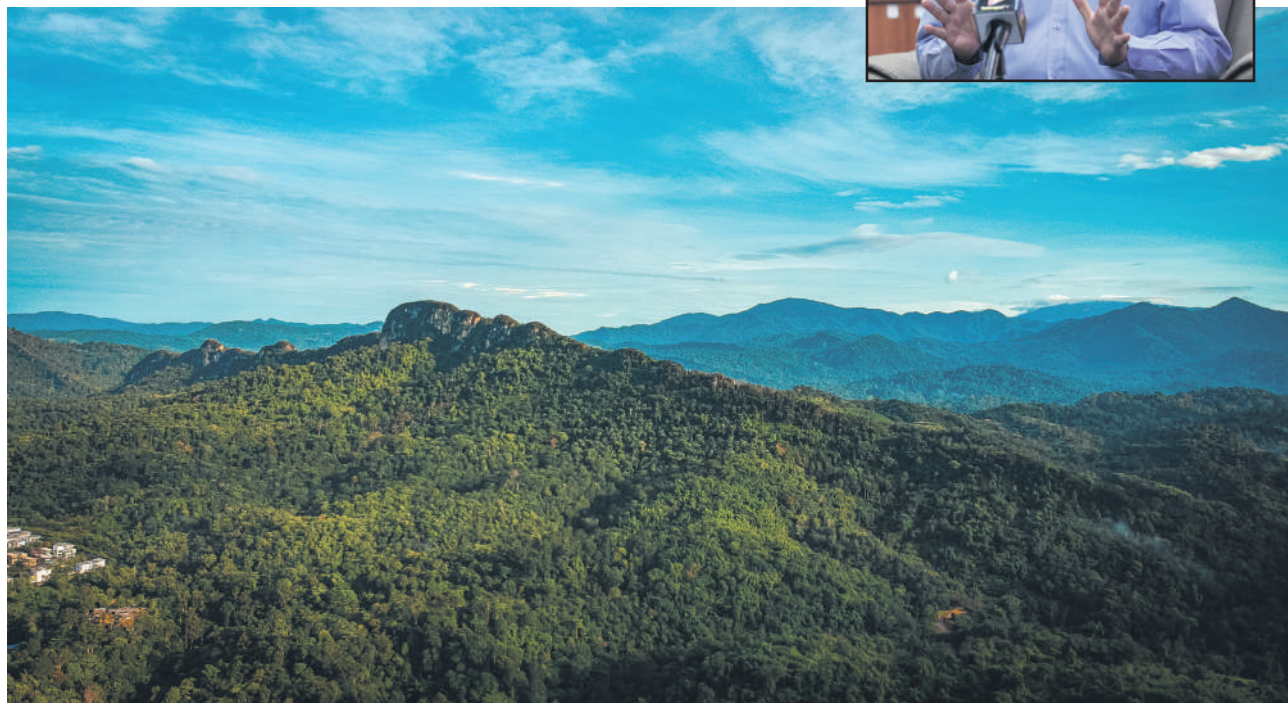
▲长达2亿至2亿2000年历史的鹅唛—乌冷地质公园，拥有花岗岩等珍贵的天然资源。