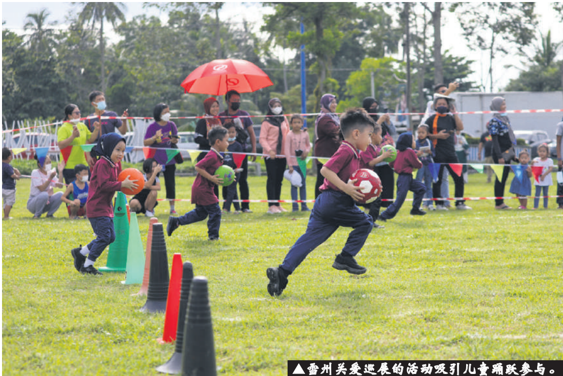
▲雪州关爱巡展的活动吸引儿童踊跃参与。

巡回各县举行的“雪州关爱计划”巡展推出不同的福祉主题，让民众更了解州政府推出的各项惠民计划，惠及各阶层人民。州政府至今已在乌鲁冷岳县、瓜拉冷岳县及瓜拉雪兰莪县举办有关巡展，接下来将在7月24日于八打灵县举行，以及7月31日在鹅唛县举行。