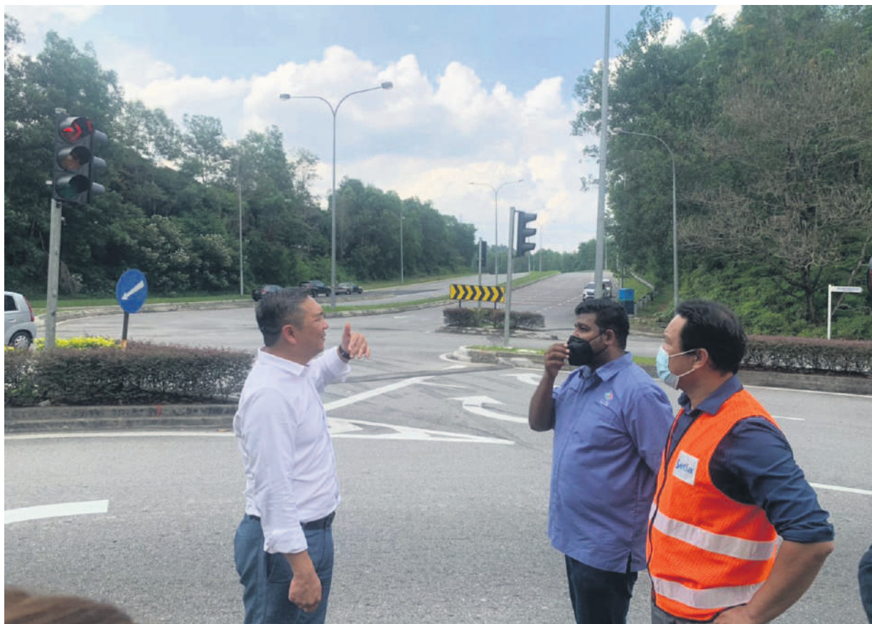
▲金銮区州议员黄思汉 (左) 巡视全面通车后的路段。

他说, 在这条新路未开通之前, 所有车辆需途经公寓前的路段前往蒲种, 加上公寓一带拥有1000户人家, 导致当地的交通非常拥挤。