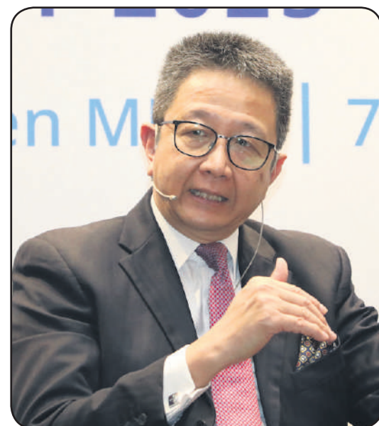
▲雪州行政议员拿督邓章钦。

永续发展: 致力维护环境和天然资源, 以惠及下一代, 并把气候变化作为首要考量。州政府通过建立绿色善善设施, 有效及持续发展固体废物管理, 以达致低排碳量州属的目标。 行政管理: 把雪州公务员机制改革为支持经济增长的先进、具远见和以人为本的组织。利用数码技术改善公共服务, 提高公务员的能力、生产力和敏捷性。