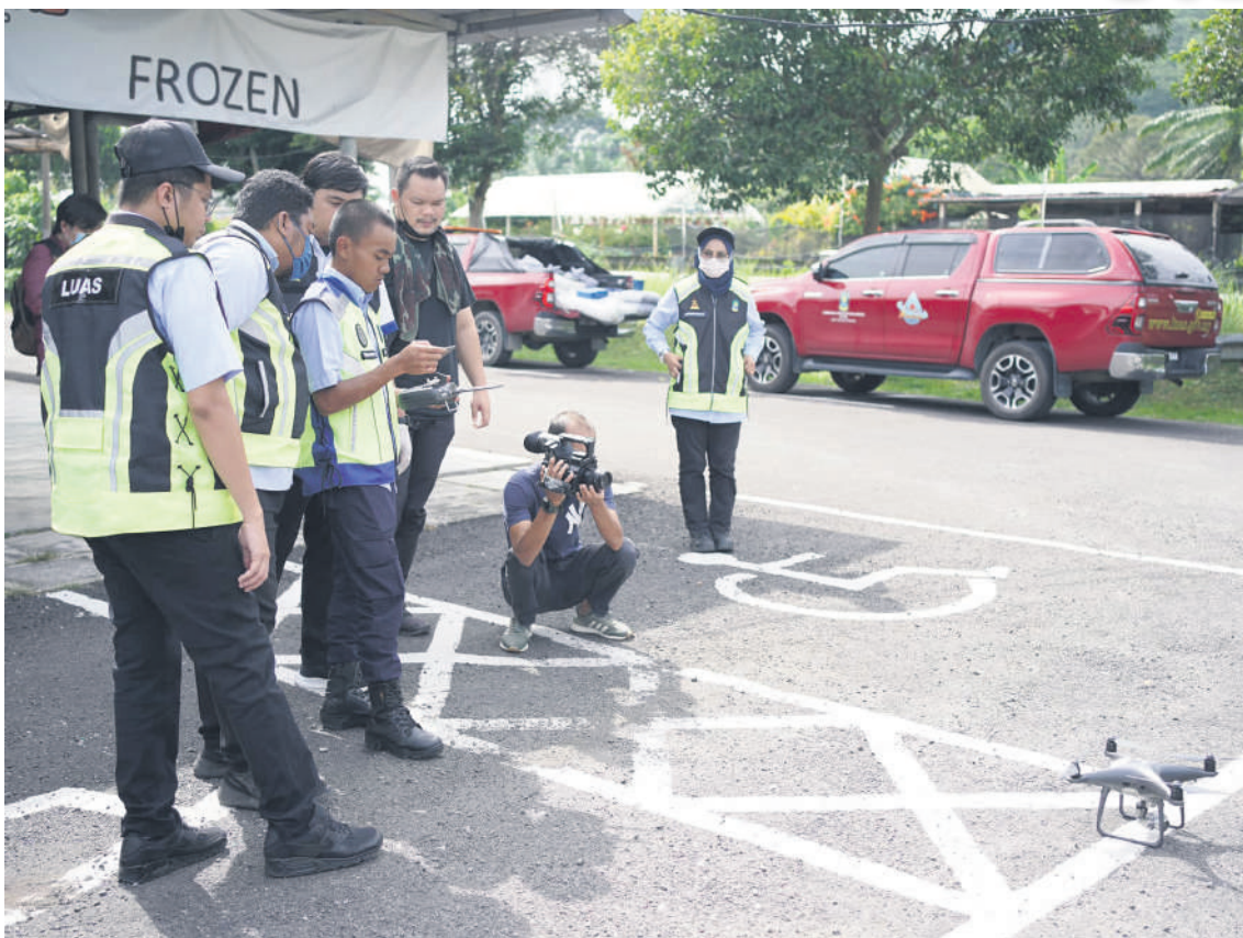
▲雪州水务管理局出动高端无人机，严密监督雪州境内的水源敏感地区。