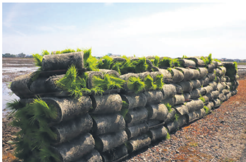
▲堆叠在稻田旁的稻饼,种满了小小的秧苗,等待着自动插秧机安插进稻田里。

黄瑞林也是适耕庄旅游发展协会会长。他日前在适耕庄旅游发展协会年度会员大会上致词时说,本地游客几乎都是多次到访,所以业者必须绞尽脑汁和持续蜕变,为游客提供更多新鲜感,如增设景点、强打不同时期的稻田美景,与深挖