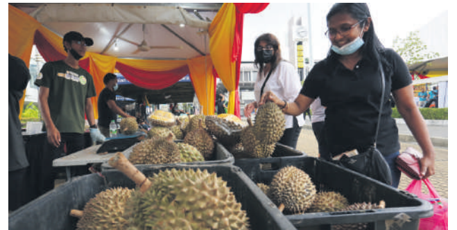
▲雪州农业发展机构现场摆摊,让民众抢购价廉物美的水果。