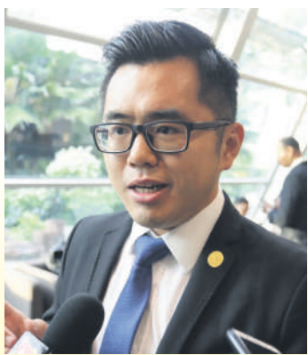
▲万挠区州议员蔡伟杰