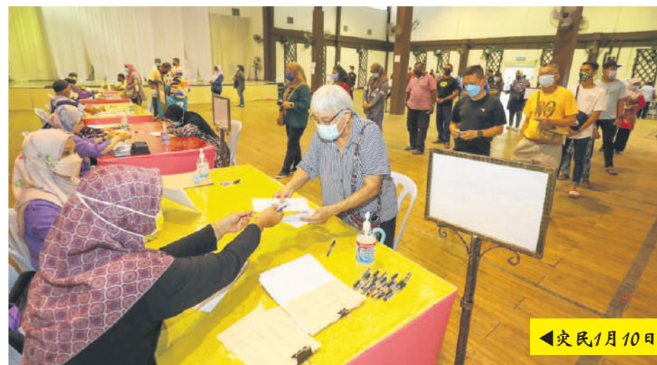
◀灾民1月10日在哥本路莎阿南市政厅礼堂, 领取“雪州重新振作”援助金。