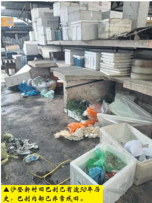
▲沙登新村旧巴刹已有逾50年历史，巴刹内部已非常残旧。