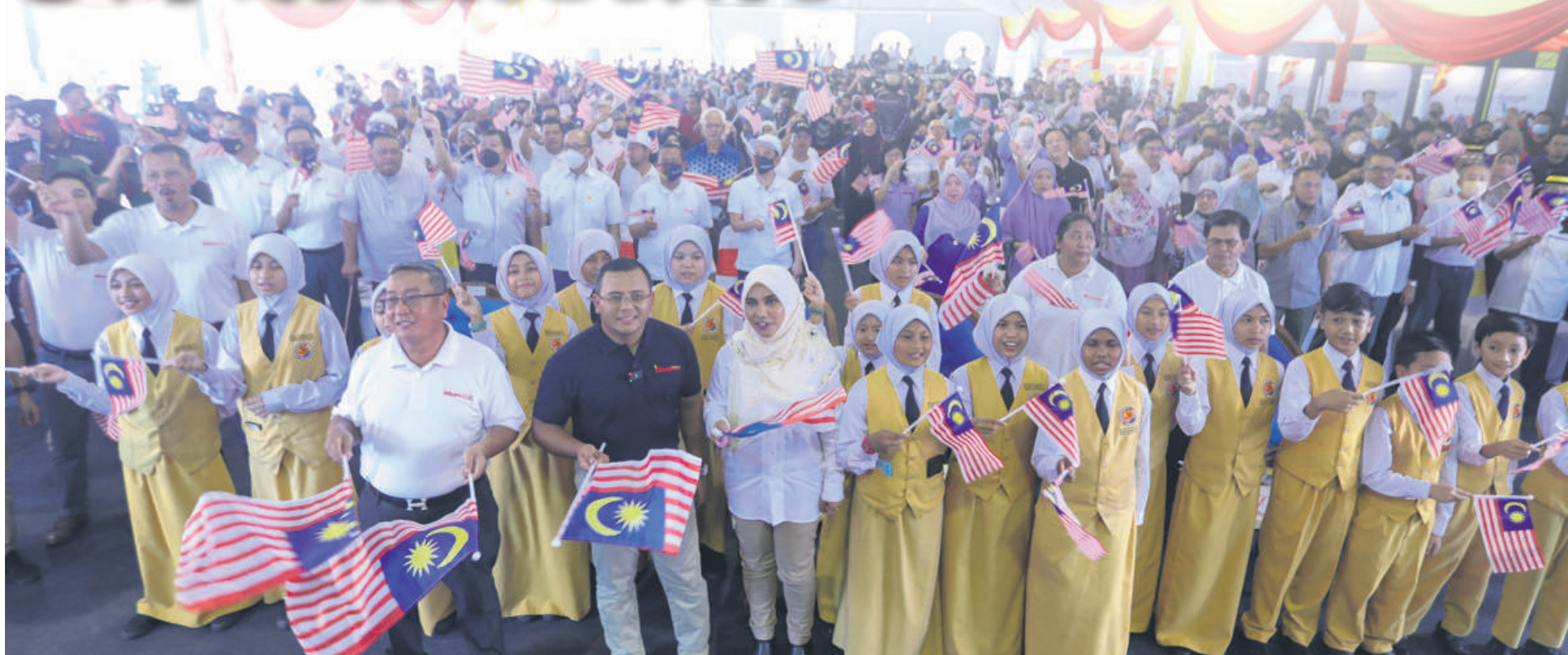
▲雪州政府秘书拿督哈斯里 (前排左起) 连同雪州大臣拿督斯里阿米鲁丁凯里在鹅唛县雪州关爱计划巡展上，与学子们挥动手上的国旗高唱爱国歌曲“辉煌条纹”。