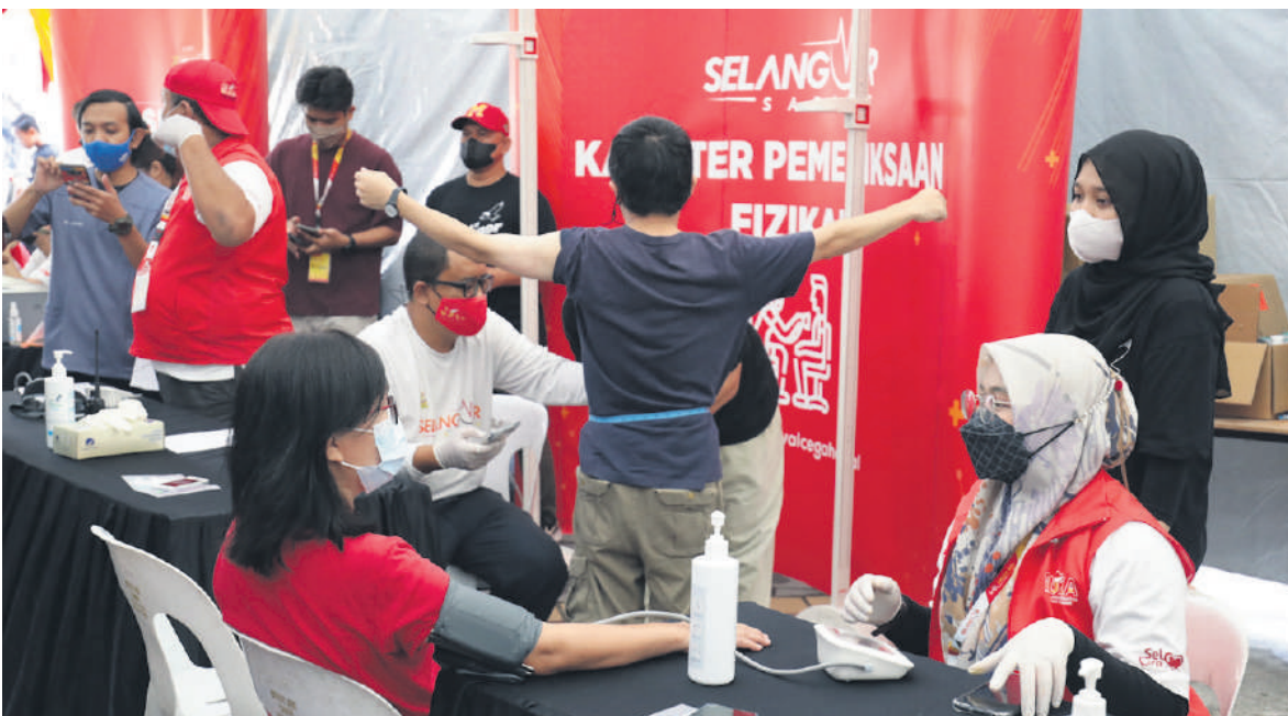
▲民众踊跃接受免费的身体检查,掌握自身的健康状况。