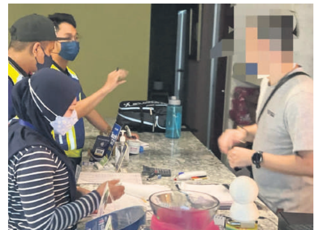
▲八打灵再也市政厅开出罚单给违例的按摩院业者。

(莎阿南讯) 无法出示按摩师和职员的体检报告，两间按摩院业者接获由八打灵再也市政厅发出的各1000令吉罚单！