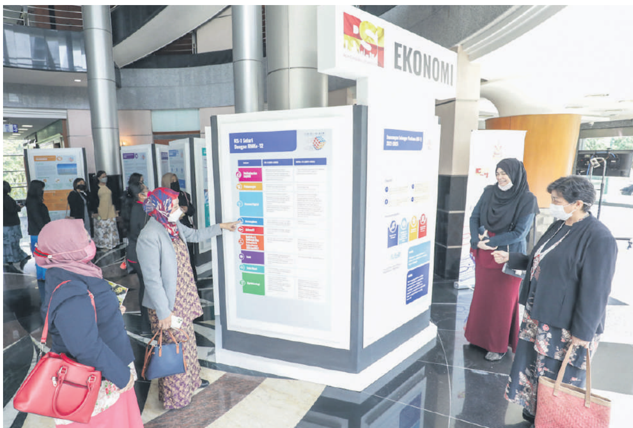
▲官员在雪州政府大厦参观“第一雪兰莪计划”展览，更了解这份五年发展大计的内容。

“此外，雪州已走在前端以实施各项数码化措施，如研发SELangkah手机应用程序、CEPat电子钱包和数码化雪州和谐生活补助金（BING-KAS）的付款方式，已取得明显成果，有助至2025年时达致精明州的目标。”