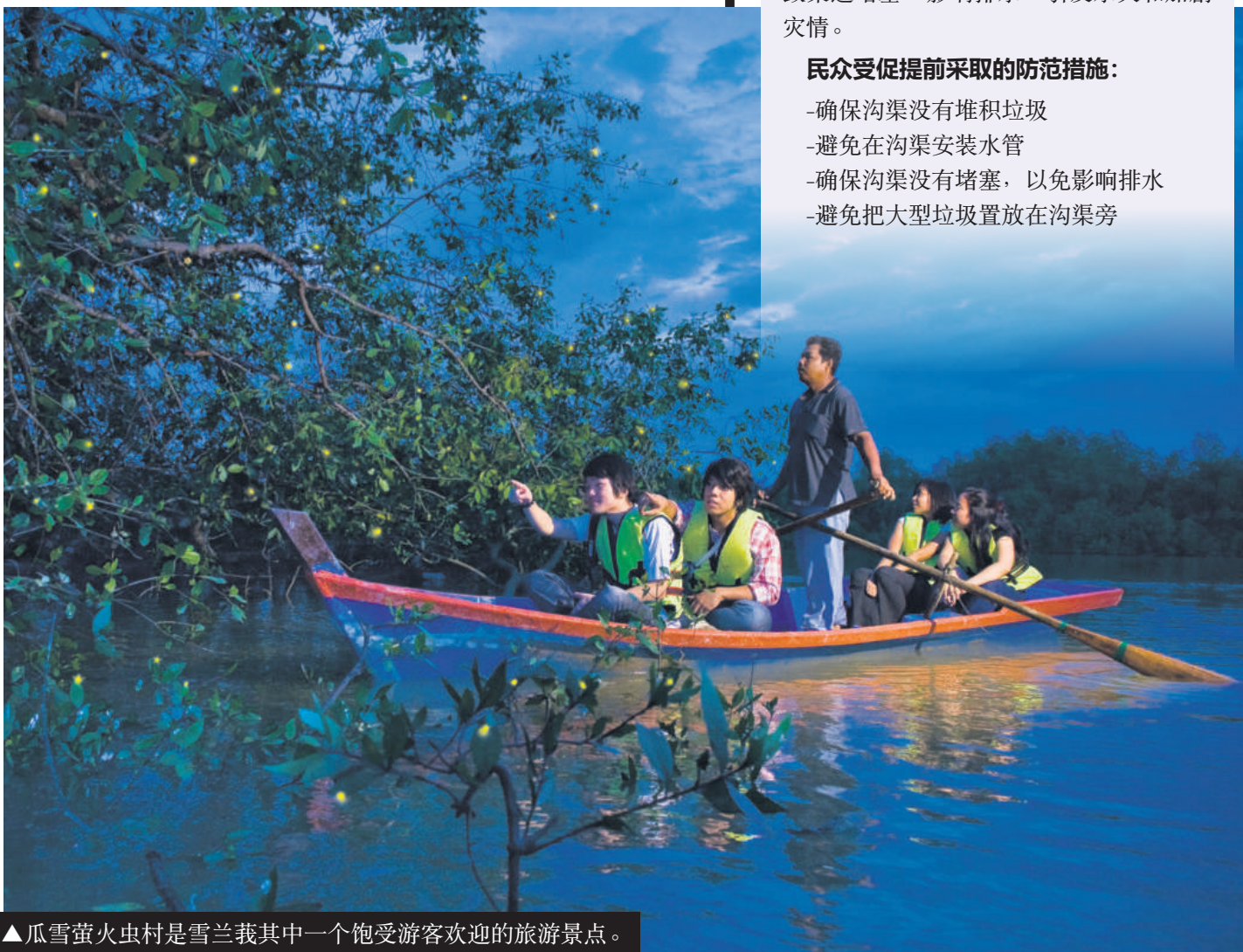
▲瓜雪萤火虫村是雪兰莪其中一个饱受游客欢迎的旅游景点。

相关的旅游刺激措施包括：提供旅游业复苏补贴、“先玩转雪州”旅游促销活动、执行雪州安全与健康旅游标准作业程序，以及发展旅游基设及手工艺品。