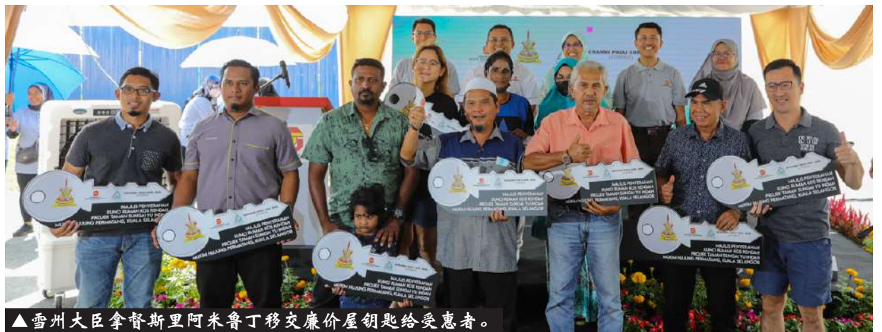
▲雪州大臣拿督斯里阿米鲁丁移交廉价屋钥匙给受惠者。

安邦黄金华园居民早前指控捷运第三干线的新路线穿梭当地，促请政府重新考虑和研究捷运的路线，以免他们的家园受影响。