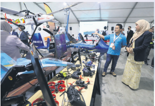
▲雪州航空展吸引64家公司参展，反应不俗。