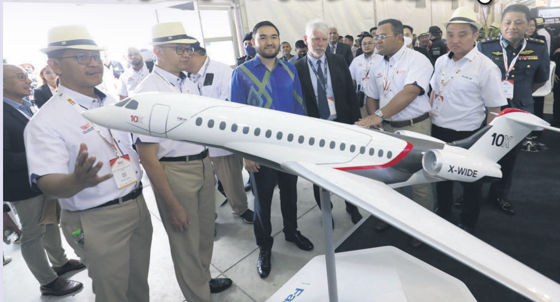
▲众嘉宾参观在雪州航空展上展示的各类飞机，左起拿督哈山阿兹哈里、拿督邓章钦、东姑阿米尔沙，右2起黄瑞林和拿督斯里阿米鲁丁。

(莎阿南讯) 规模更盛大的“第二届雪兰莪航空展”(SAS 2022)今年重磅回归，促成交易额高达17亿令吉的20项合作备忘录，成绩斐然。