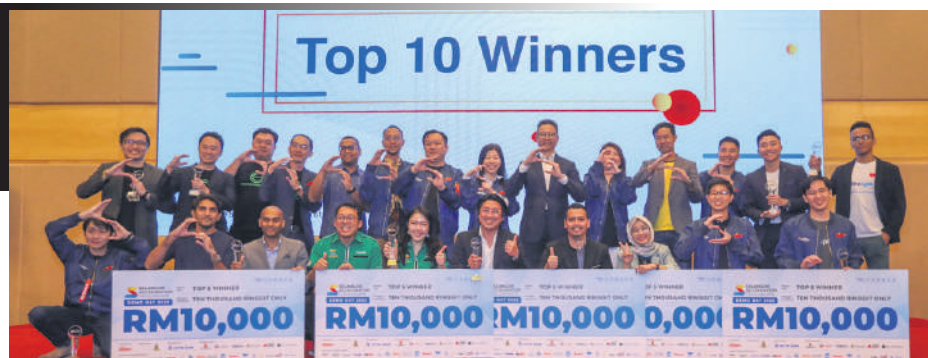
▲5间新创公司在“2022年雪州新创企业加速器计划”中脱颖而出, 与雪州行政议员邓章钦 (后排右6) 分享喜悦。

本届计划主题是“净零、永续和可循环经济生态”, 大会共接获225份申请, 较去年增加了36.4%。这项计划赞助单位有艾芬银行 (Affin Bank), 同时策略伙伴包括雪州投资机构 (PNSB)、微软、农业银行等。