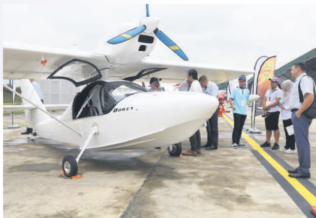
▲雪州航空展吸引逾1万2000名航空迷入场“朝圣”。