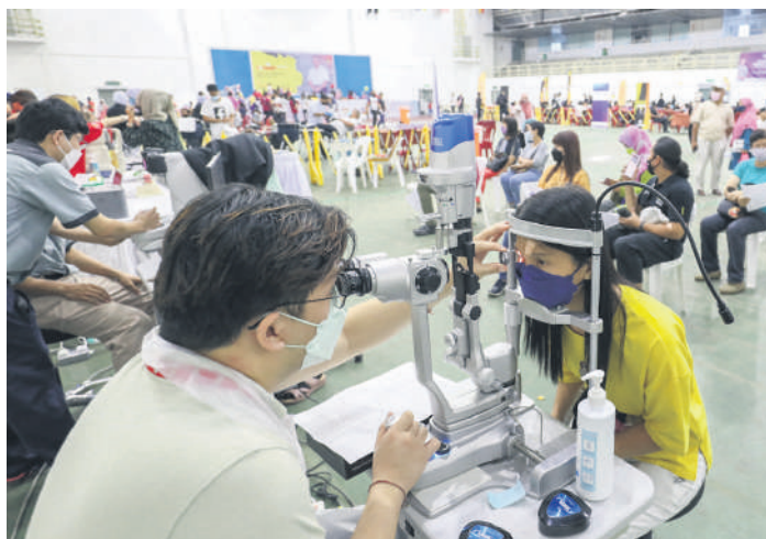
▲雪州免费检查计划将送出眼镜给有需要的民众。

雪州公共卫生咨询理事会(SelPHAC)成员法汉博士表示，州政府配合关爱巡展将举行免费健康检查，凡