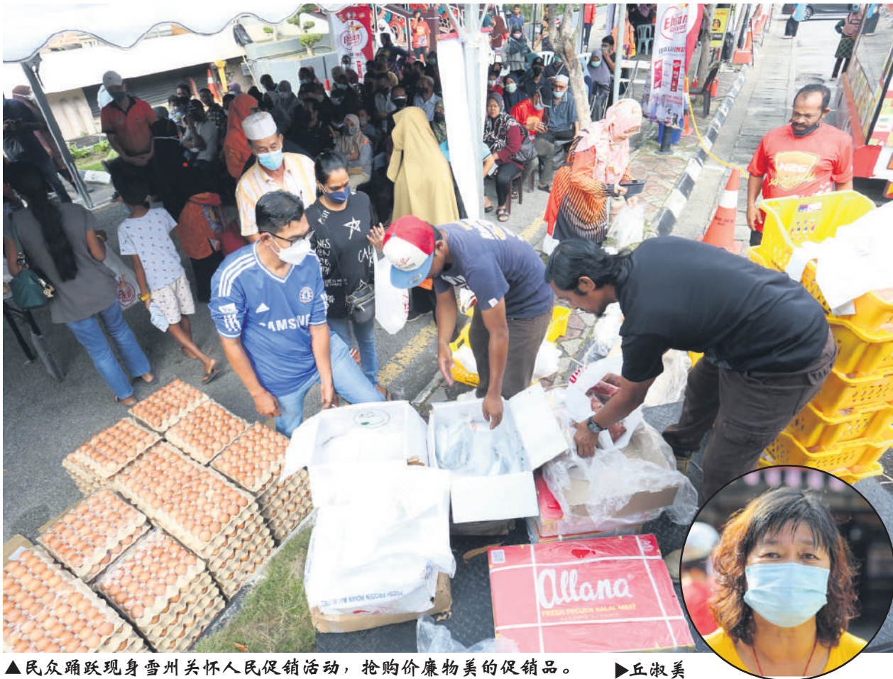
▲民众踊跃现身雪州关怀人民促销活动，抢购价廉物美的促销品。