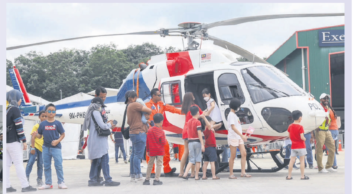
▲父母纷纷带孩子现身雪州航空展，一尝乘坐直升机的乐趣。

“自2019年以来，州政府通过雪州投资促进机构帮助航空业应对新冠大流行病，包括去年首度举办第一届雪州航空展，吸引许多行家及潜在投资者参与。”