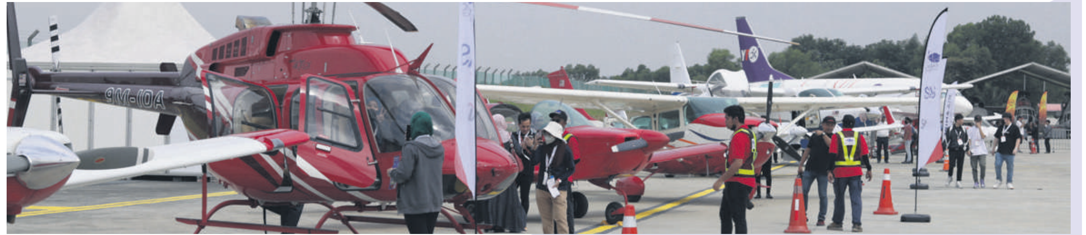
▲本届雪州航空展展示多达40架飞机和直升机。