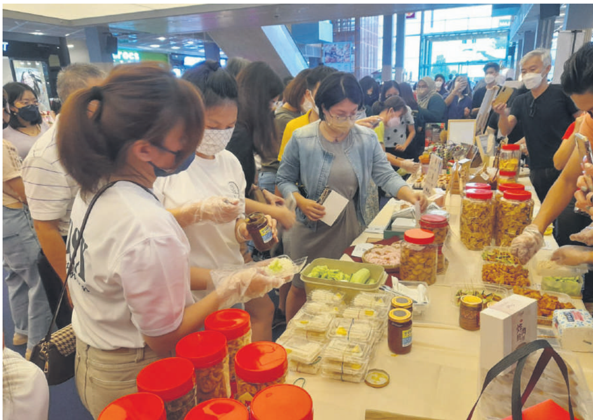
◀本届雪州新村好品大赛不只带出好产品,也呈现出马来西亚多元和包容性的一面。

“这彰显了新村业者的魄力,让大众看到了新村好品的魅力,直接让大众更想进一步了解雪州新村。”