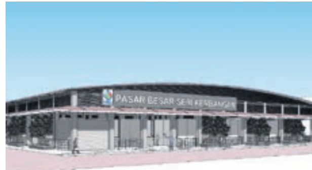
▲沙登新村早市新巴刹的蓝图。