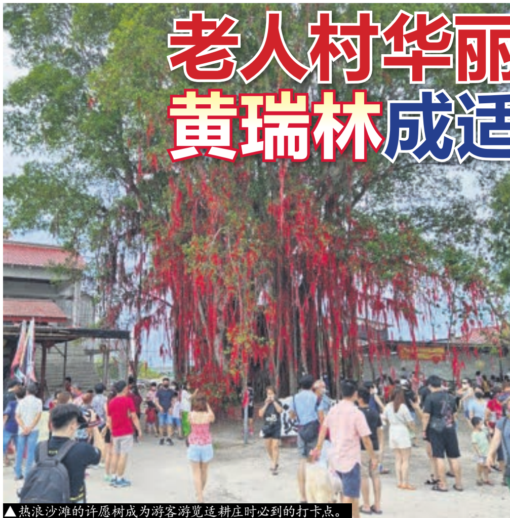
▲热浪沙滩的许愿树成为游客游览适耕庄时必到的打卡点。

渔米之乡”——适耕庄，是马来西亚火红的生态旅游小镇，也是适耕庄区州议员黄瑞林自2004年担任当地父母官以来，交出最满意的成绩单之一。