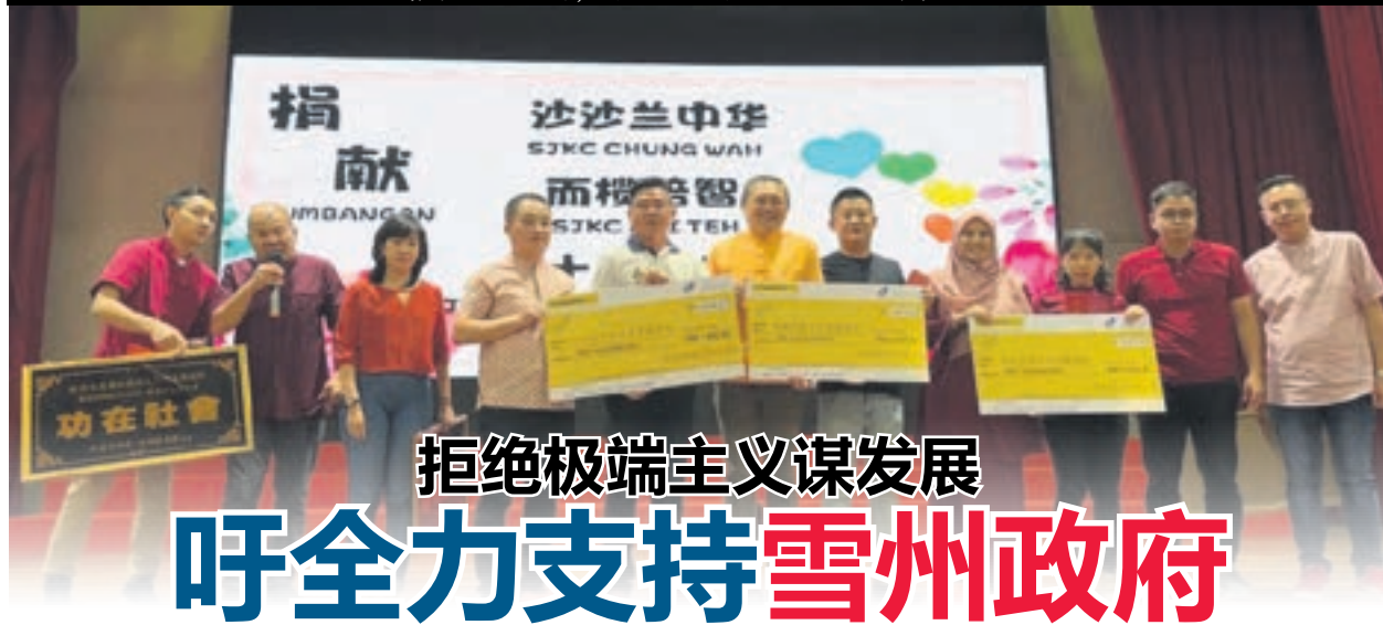
▼雪州社青团联合瓜雪社青团在嘉宾们见证下,捐赠1000令吉给瓜雪三所华小。

“如宰鸡小贩等业者需要更长的时间安排,因此我们将通过州议员与市政厅交涉讨论,是否能展延小贩的搬迁日期。”