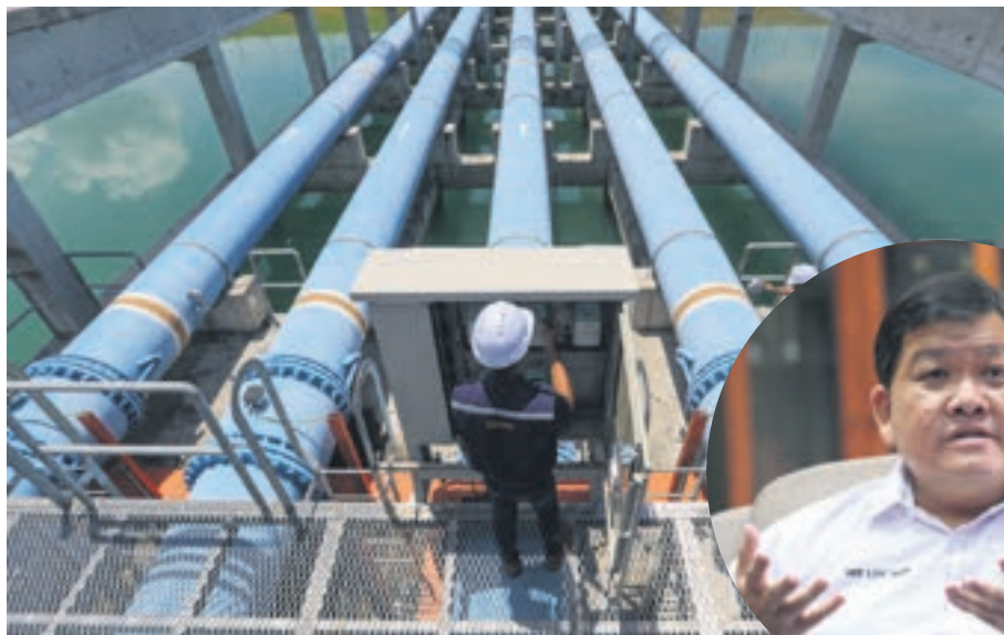
▲雪州政府落实的生水保障计划有助减低生水受污染的风险。

干净的水源,便是人民的生命泉源。雪兰莪州政府近年来不遗余力保障水供安全,以降低人民面对无预警制水的困扰。