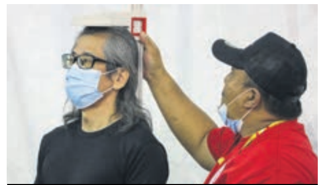
▲民众在关爱我们雪州巡展上接受免费体检。

该巡展从2022年6月开跑，每站皆举行各种活动，包括免费健康检查、食品促销、展览和体育赛事，造福民众。下一站的巡展将移师鹅唛和瓜拉雪兰莪举行。