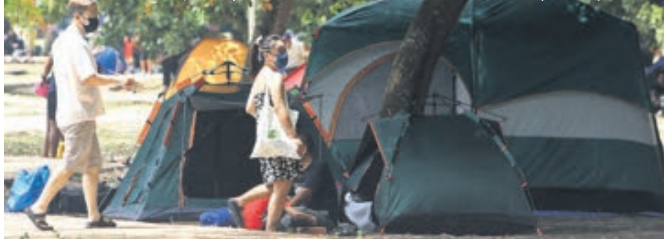
▼雪州露营地业者受促尽快向各地方政府登记，以有利申请临时执照。

(莎阿南讯)雪兰莪州政府吁请州内所有的露营地业者参与普查，尽快向各地方政府提呈营运资料，以便当局能够发出临时营业执照给业者。