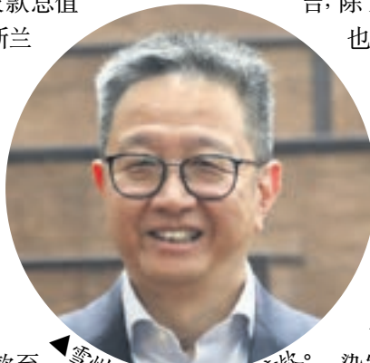
雪州行政议员拿督邓章钦。