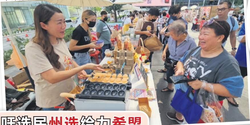
▼新村市集让民众品尝到雪州各新村的好滋味。

除了12个造型各异的新村馆, 博览会期间也设有文创及新村市集、分享会、文艺演出、图片展等多项活动。其中以“活力新村、美丽新村及生活新村”为主题的摄影展, 让人欣赏到各新村之美, 彰显新村独特的文化和特色。