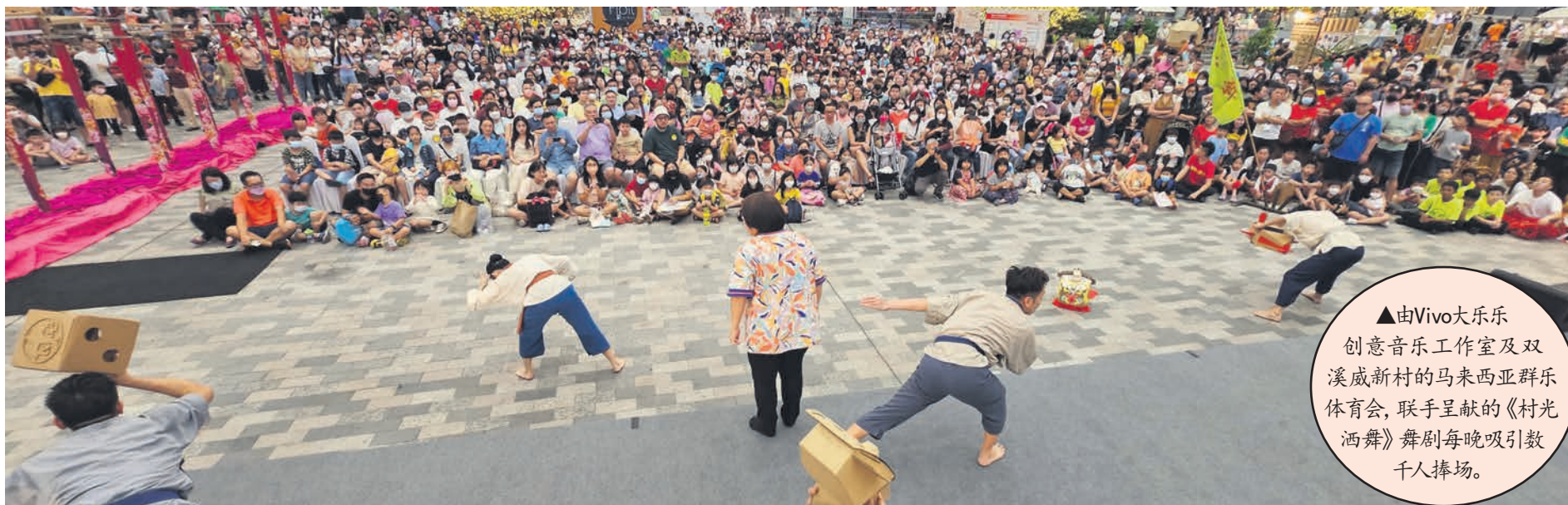
▲由Vivo大乐乐创意音乐工作室及双溪威新村的马来西亚群乐体育会, 联手呈献的《村光洒舞》舞剧每晚吸引数千人捧场。

们目前没法给答案, 因为雪州在100天内将举行州选举, 如果大家希望我们再举办, 那希望选民能在州选举时继续大力支持我们。”