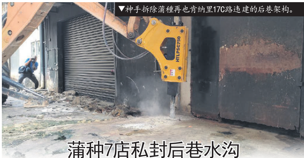
▼神手拆除蒲种再也肯纳里17C路违建的后巷架构。

加影市议会辖区内共有99个地区通报骨痛热症病例, 其中3个属于热点地区, 分别在加影区、无拉港区和双溪拉玛区。