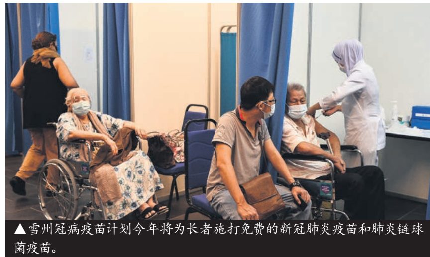
▲雪州冠病疫苗计划今年将为长者施打免费的新冠肺炎疫苗和肺炎链球菌疫苗。

雪州冠病疫苗接种计划耗资共2亿令吉, 也获得联邦政府的认可, 将其纳入国家冠病免疫计划(PICK)。