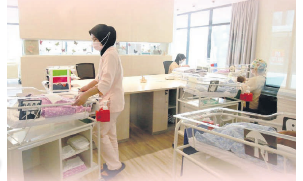
▼雪州产后母婴照顾陪月中心指南保障母婴和业者的权益。