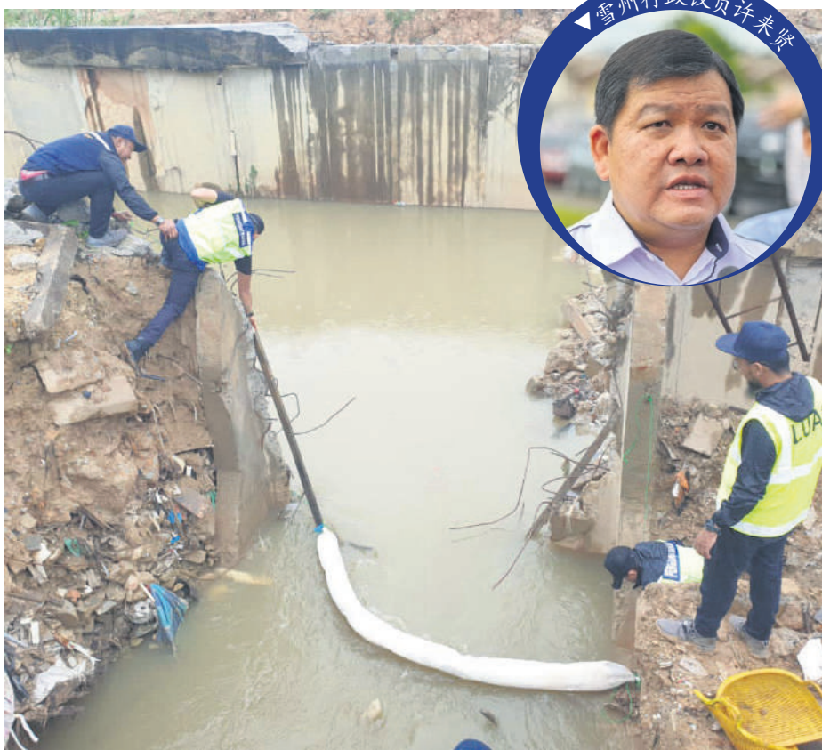
▲雪州水务管理局人员采取各项措施以降低水源受污染的风险。

他说, 当局在2019年对双溪毛糯保护区进行了土地使用活动的绘图和清单调查, 以确定可能导致污染的活动, 以及交由雪州水利灌溉局拟定2021年双溪毛糯流域综合管理计划。