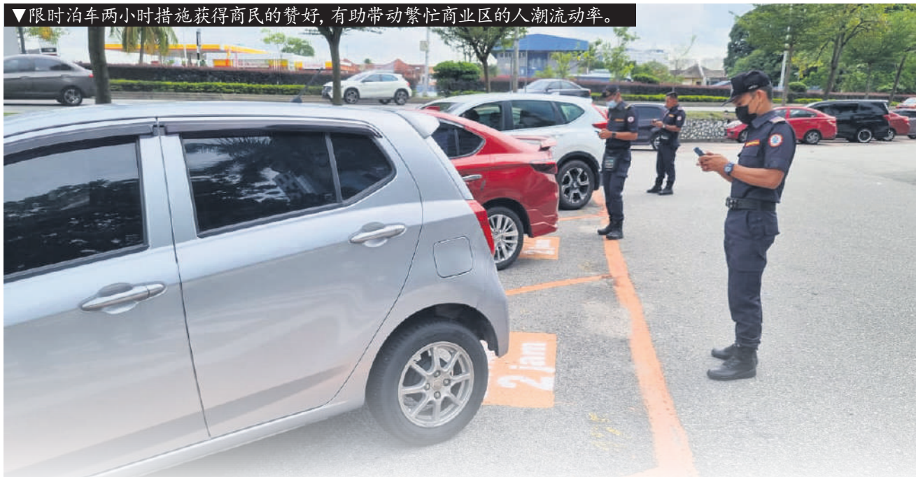
▼限时泊车两小时措施获得商民的赞好，有助带动繁忙商业区的人潮流动率。