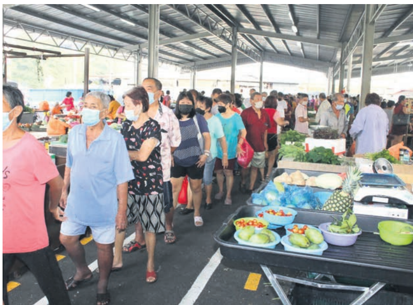
▲首日启用的沙登临时巴刹人气旺。

“至于有人称巴刹设备不完善, 这里毕竟是临时巴刹, 设备方面可能稍有不足, 但是基本的设备皆已齐全, 让小贩可以安心使用。”