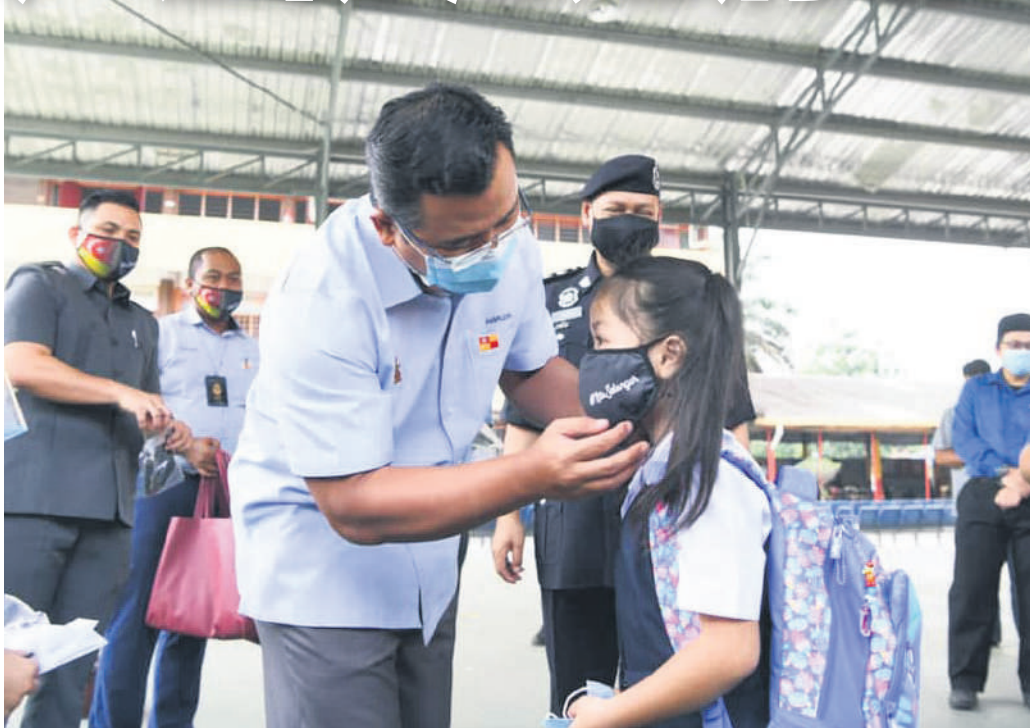
▲雪州大臣拿督斯里阿米鲁丁(左)细心为一名小学生调整口罩。

(莎阿南讯)雪兰莪州政府计划重新派发免费口罩给州内的学生，以遏制新冠肺炎疫情卷土重来。