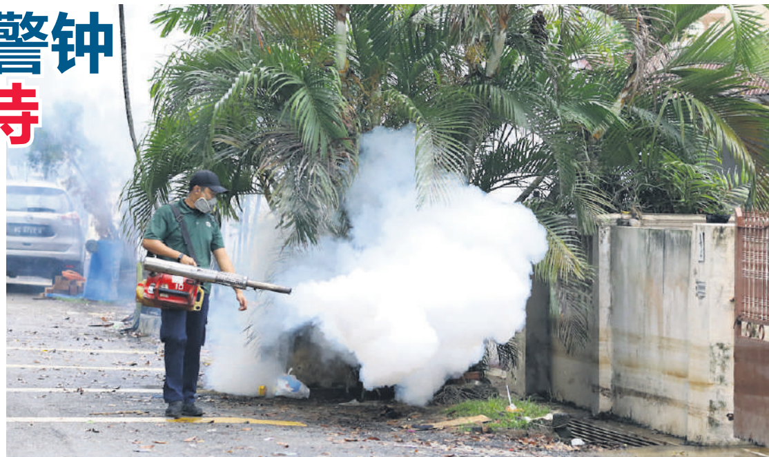
▲工作人员在骨痛热症黑区喷射灭蚊雾。