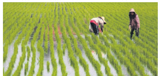
▲适耕庄稻农获得450令吉援助金。

他说, 适耕庄共有2500名登记的稻农受惠, 其中已提供银行账号的1806人, 以直接转账方式获得援助金, 另外694名稻农则可前往巴西班让农业组织局领取现金。