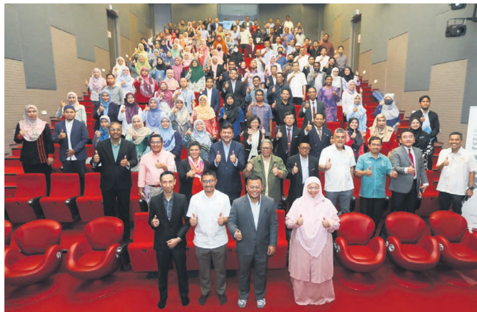
▲雪州大臣拿督斯里阿米鲁丁开幕“雪兰莪教育大方向和策略规划工作坊”后与嘉宾合影。

雪州苏丹沙拉夫丁4月30日将亲临在巴生斯里柯拉容花园草场举行的巡展，活动包括开斋节茶会，雪州大臣拿督斯里阿米鲁丁及州政府领导层也将出席，预计吸引1万人到场。