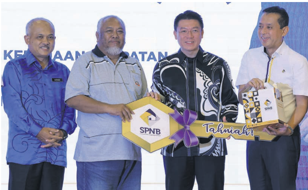
▼地方政府发展部长倪可敏 (右2) 移交人民亲善房屋的钥匙给购屋者。

“内陆税收局向所有人征税, 但拥有数十亿资产的个人不缴税, 或即使缴税, 缴纳的金额也很少。然而, 一般收入者则被期望缴税, 所以这就是我们必须纠正之处。”