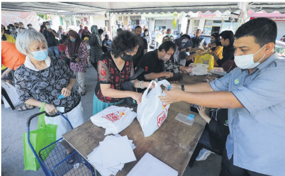
▲雪州人民市集售卖的物品比市价便宜30%，吸引大批民众采购。

(莎阿南讯) 雪兰莪人民市集2.0自今年1月重新开跑以来，在短短4个月内的销售额达到771万令吉，同时为民众省下375万令吉的买菜钱。