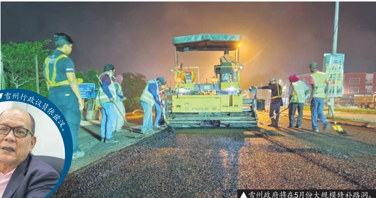
▲雪州政府将在5月份大规模修补路洞。

(莎阿南讯)雪兰莪州行政议会已批准250万令吉拨款,以在各地区安装300盏环保节能的LED路灯。