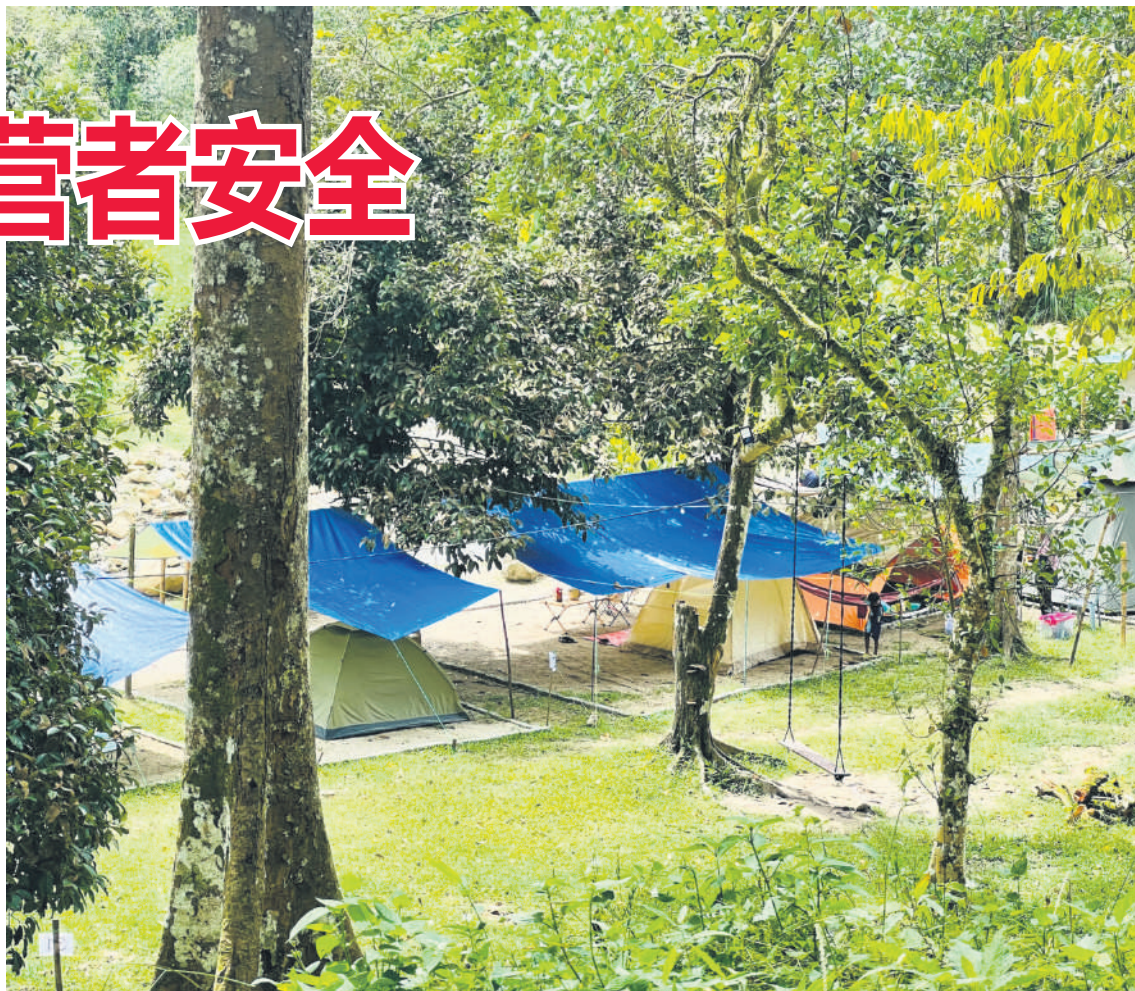
▲雪州政府将在今年中旬与露营地业者对话, 鼓励业者向各地方政府登记。