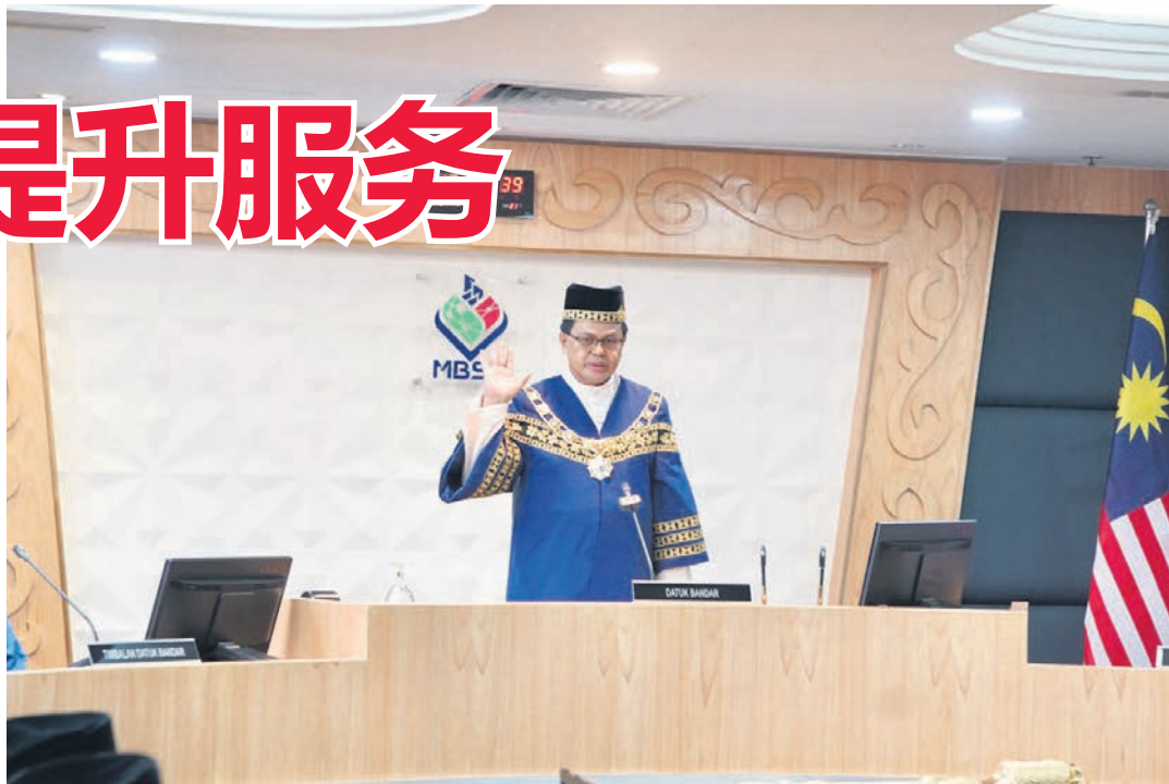
▲莫哈末夫兹宣誓就任为第三任的梳邦再也市长。