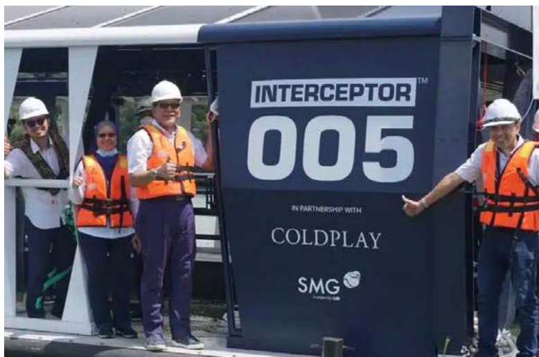
▲雪州行政议员依兹汉(左3)巡视清洁巴生河有功的垃圾拦截浮台。

雪州政府从2016年至2022年9月已从巴生河清理了7万5402吨垃圾,当中50%属于有机垃圾,例如园艺垃圾、塑料垃圾、罐头和纺织品。