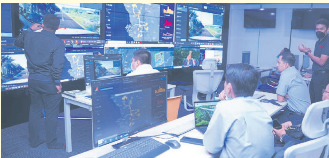
▲i-RAA系统指挥中心通过人工智能监控雪兰莪州内的路况。