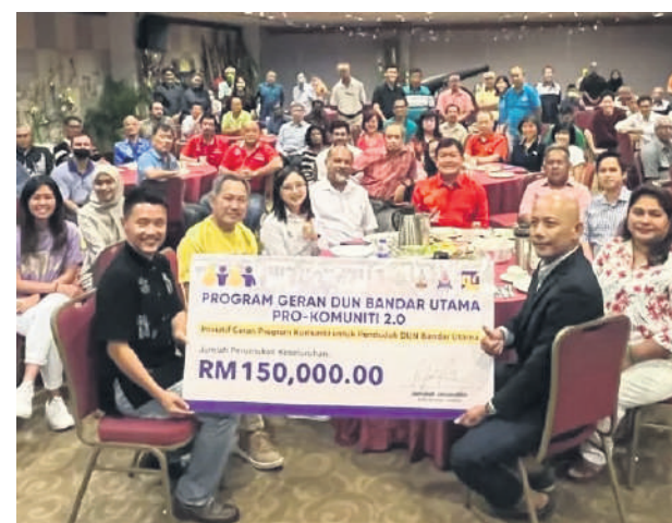
▲万达镇区州议员嘉玛丽雅与受惠的社区组织代表大合照。

出席支票移交仪式者包括雪州行政议员许来贤、白沙罗区国会议员哥宾星、八打灵再也市议员梁启靖、陈百强、莎琪娜、王绥生、古拉图兰、娜丽娜、莫哈末依山等。