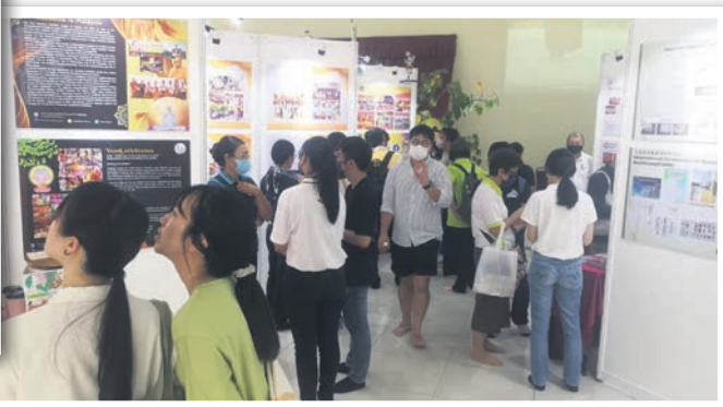
◀民众参观雪州卫塞节庆典的展览。

雪州卫塞节庆典吸引逾1000名各佛教团体的信徒参与,现场的活动精彩,包括文化演出、植树活动和展览。大会当天也捐款给雪州的三间学校和一个协会。