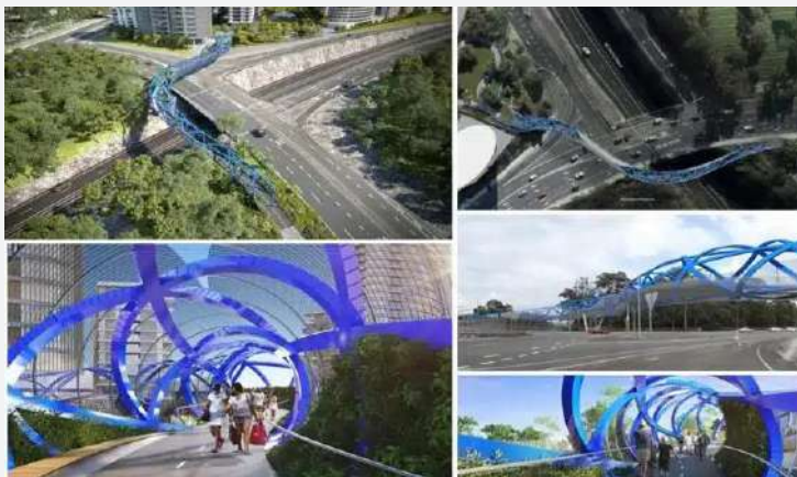
▼一座全长1.5公里的行人天桥将衔接八打灵再也13区和52区。

(八打灵再也讯) 雪兰莪州将迎来一座全长1.5公里, 衔接八打灵再也第13区和第52区的标志性行人天桥。