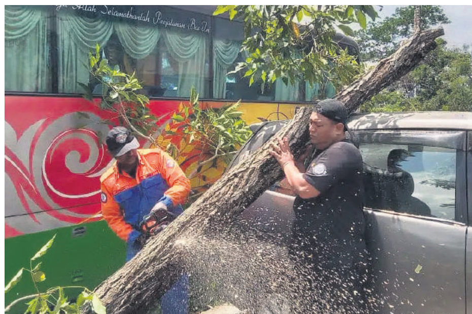
▲梳邦再也市政厅的快速行动部队随时待命，必要时可为市民施予援手。