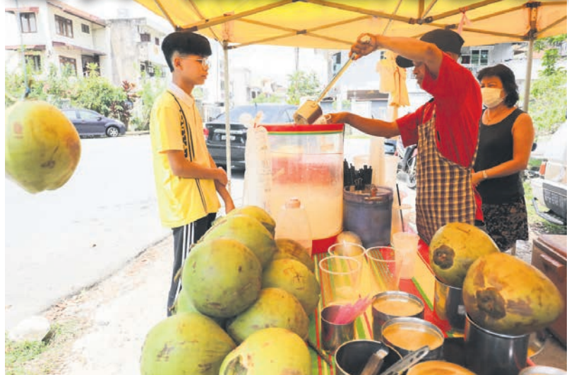
▲炎热天气令人吃不消, 喝杯清凉的椰水消暑吧!