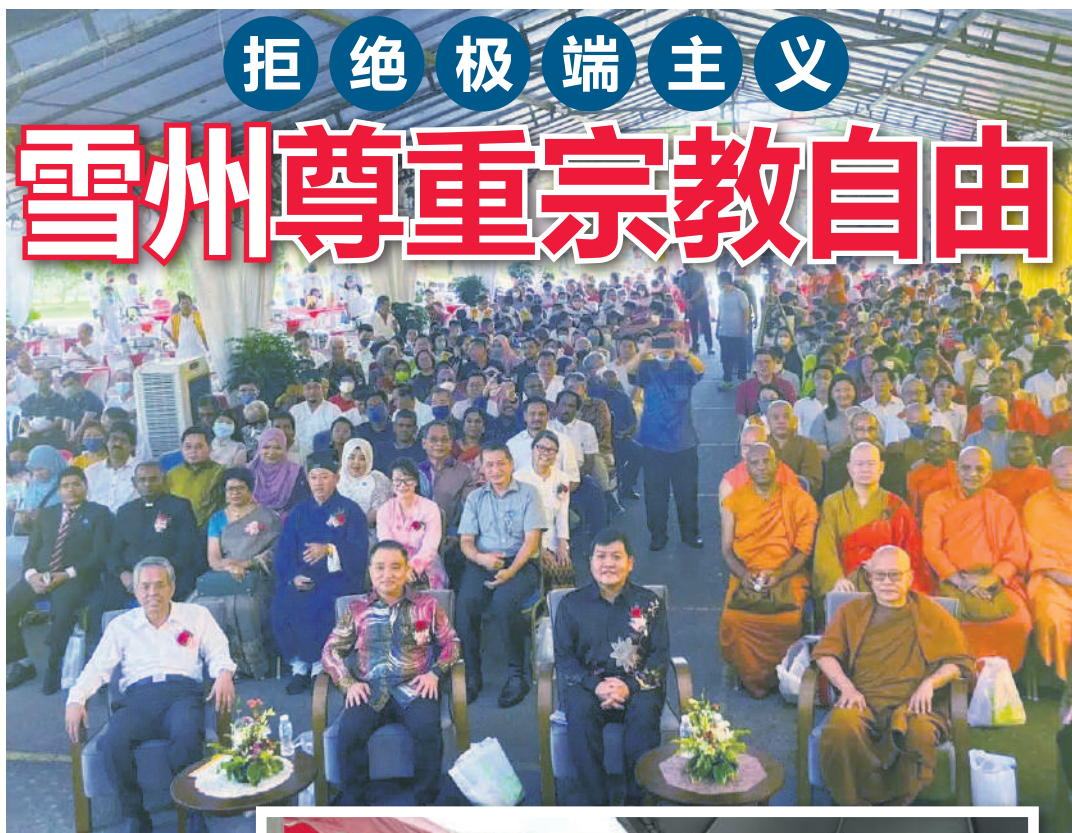
▲众多嘉宾和信徒出席雪州卫塞节庆典。