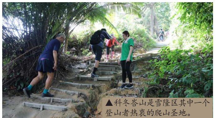
▲科冬峇山是雪隆区其中一个登山者热衷的爬山圣地。