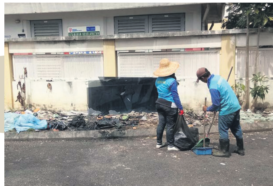
▲雪州需更有效的机制以处理惊人的垃圾量。