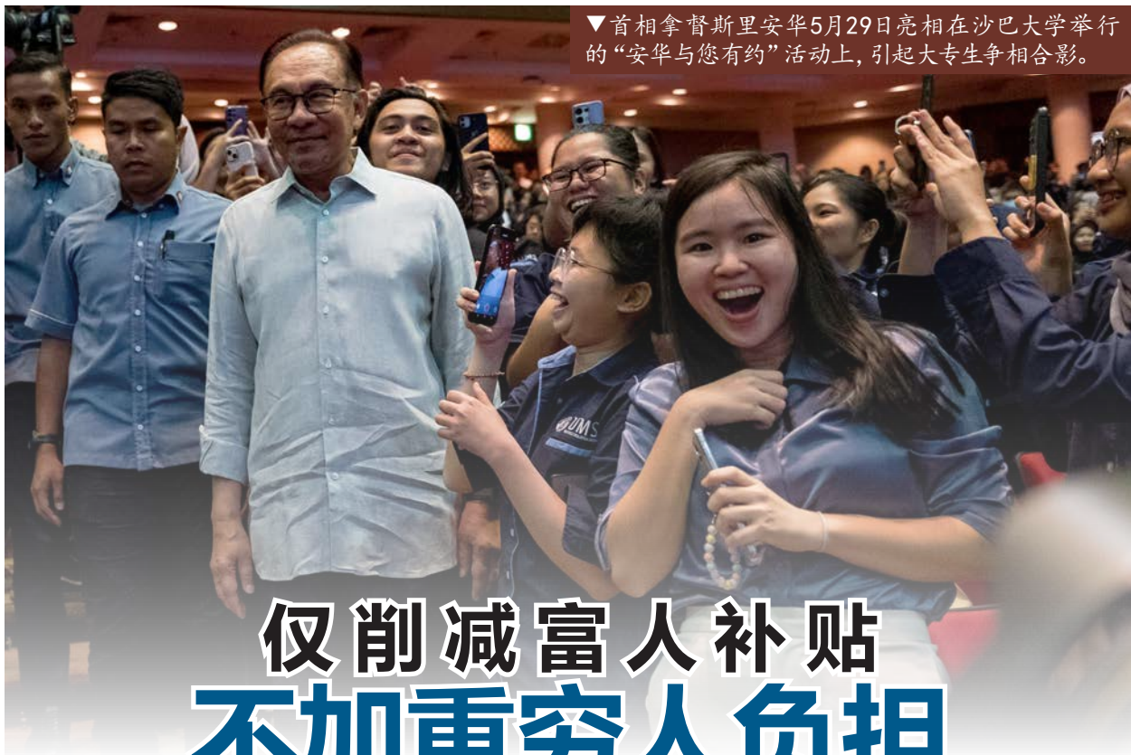
▼首相拿督斯里安华5月29日亮相在沙巴大学举行的“安华与您有约”活动上，引起大专生争相合影。