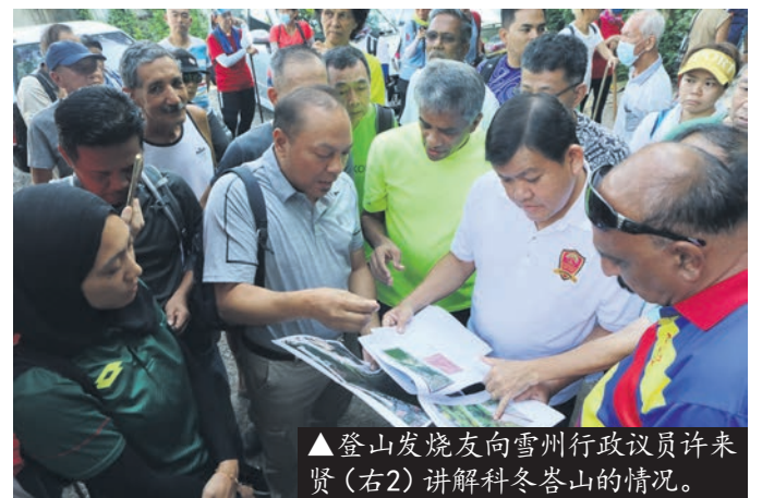
▲登山发烧友向雪州行政议员许来贤(右2)讲解科冬峇山的情况。

“社区森林也可以成为一个全新的旅游景点,藉此吸引更多的国内外游客。州政府也计划提升科冬峇山的登山走道,确保登山客有更舒适的环境。”