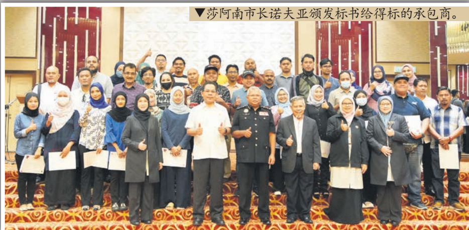
▼莎阿南市长诺夫亚颁发标书给得标的承包商。

他说,第一种错误时违反登记时的条件,包括伪造资料或文件;第二种错误是撤回或拒绝提供报价、串通报价,以及第三种是未能履行合约条件。