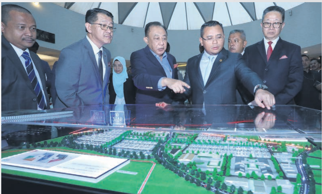
▲ 雪州南部综合发展区将催化雪邦和瓜拉冷岳县的经济。

其他项目包括雪州商业之都、雪州国际航空工业园、雪邦黄金海岸地球村、国浩雪邦屋业计划、新纪元大学学院、NCT智慧工业园、巴生加厘岛港口和巴生凯利岛经济特区。