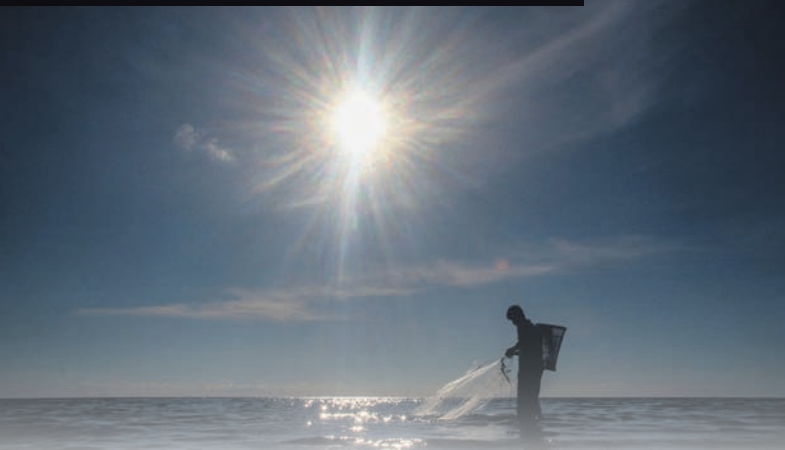
▼我国面对的厄尔尼诺现象料从6月起有所纾缓。

“公共领域改革特工队的试点计划已明显奏效，数据显示前来医院绿区的病患在三个月，即2月至4月份为30.6%。”