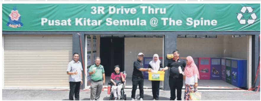
▲The Spine @ PJKita社区中心设有“得来速”环保中心,方便民众无需下车也能投放回收物品。

(莎阿南讯)八打灵再也市政厅耗资350万令吉打造的社区中心The Spine @ PJKita启用,今后为市民提供舒适的社区活动空间,同时成为市民新点子的展示区。