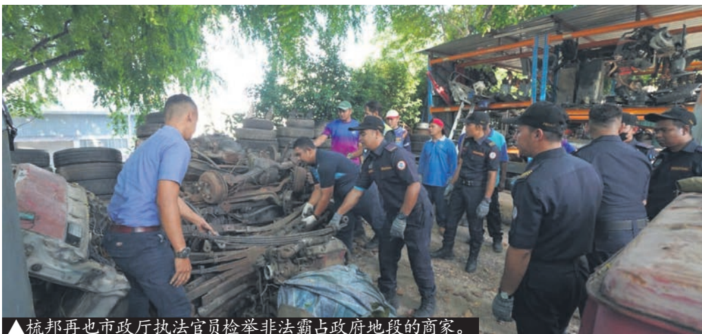
▲梳邦再也市政厅执法官员检举非法霸占政府地段的商家。

此外, 市政厅也充公了6辆车、一辆罗里车头、煤气桶、喷水式推进器、大铁剪、烂铁和各种物品等。违例业者也会在国家土地法典第425条文下, 面对法律对付。