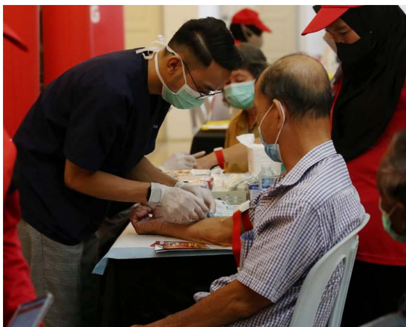
▲雪州免费体检计划成为马来西亚参与度最高的活动之一。