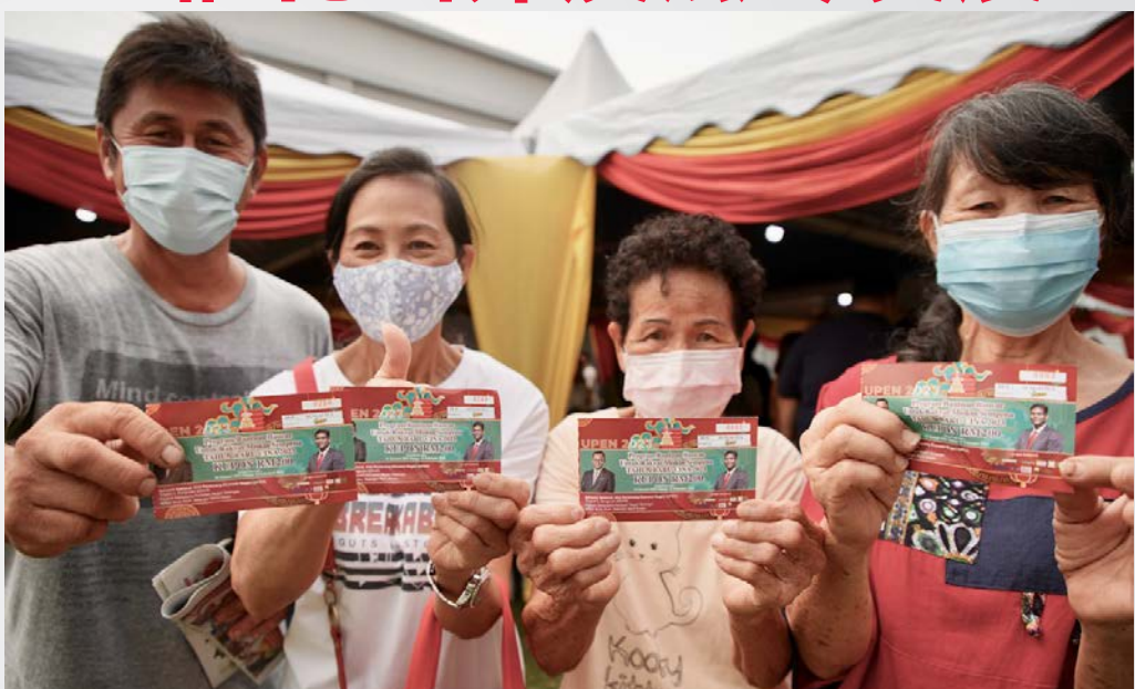
▲雪州政府推出全面的福利计划,照顾人民的福祉。