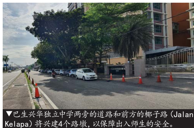
▼巴生兴华独立中学两旁的道路和前方的椰子路（Jalan Kelapa）将兴建4个路墩，以保障出入师生的安全。

他说，该路段在夜间时分更危险，而且车速也很快，因此希望一旦增建道路安全岛后能提高该路段的安全措施，保障驾驶者的安全。