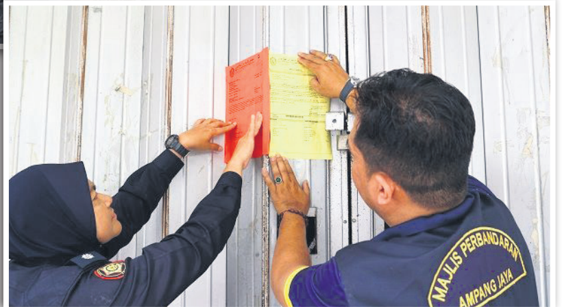
▲土拉央市议会官员将上门充公拖欠门牌税业主的财物。

雪州政府从2020年1月起授权各地方政府向管辖区的霸市、连锁超市及商店征收塑料袋费用, 既商家需上交贩售给消费者每个塑料袋20仙的收入, 以更有效的推动减塑和环保运动。