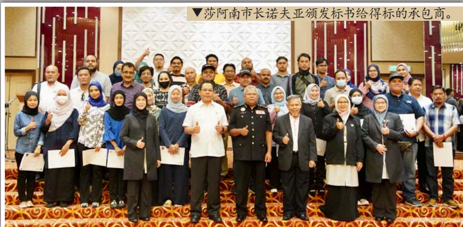
▼莎阿南市长诺夫亚颁发标书给得标的承包商。

他说,第一种错误时违反登记时的条件,包括伪造资料或文件;第二种错误是撤回或拒绝提供报价、串通报价,以及第三种是未能履行合约条件。