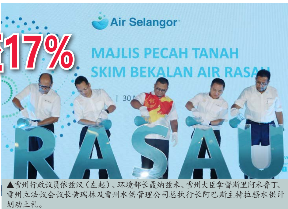
▲雪州行政议员依兹汉(左起)、环境部长聂纳兹米、雪州大臣拿督斯里阿米鲁丁、雪州立法议会议长黄瑞林及雪州水供管理公司总执行长阿巴斯主持拉骚水供计划动土礼。

“这项计划是州政府旨在确保雪州和巴生谷900万人口享有永续水供服务的努力之一。”