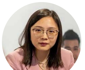
万达镇区州议员嘉玛丽雅