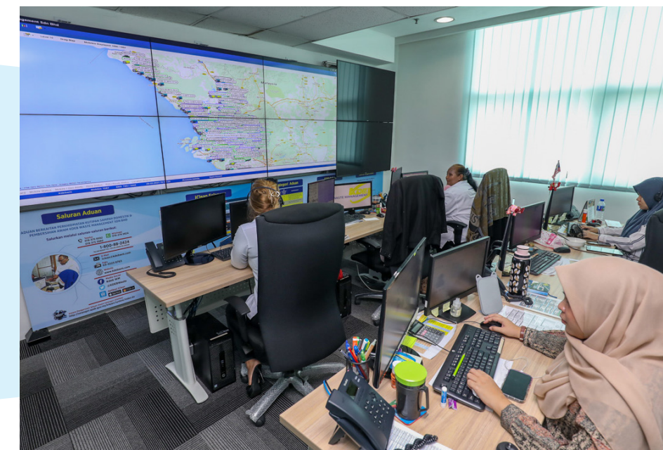
▲指挥中心 (CCC) 可全面监督各垃圾车的动向。