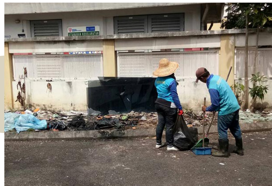
▲雪州需更有效的机制以处理惊人的垃圾量。