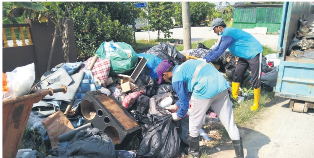
▼雪州需更有效的机制以处理惊人的垃圾量。

对化石燃料的需求。同时，废料中的金属和塑料等可回收材料也可通过再生工艺进行处理，减少对自然资源的开采。这种循环利用的模式有助于缓解土埋场的压力，也为民众创造一个更清洁、可持续的环境。