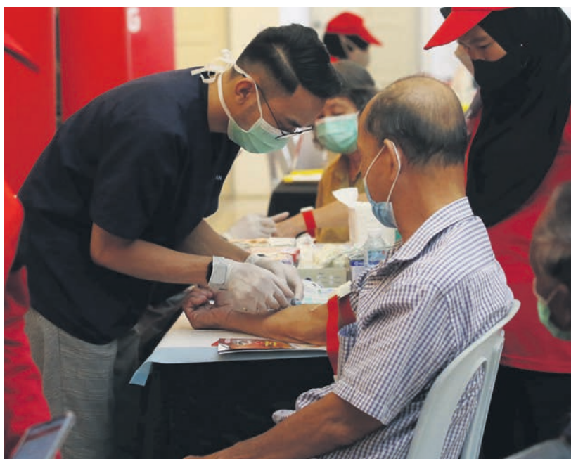
▲雪州免费体检计划成为马来西亚参与度最高的活动之一。