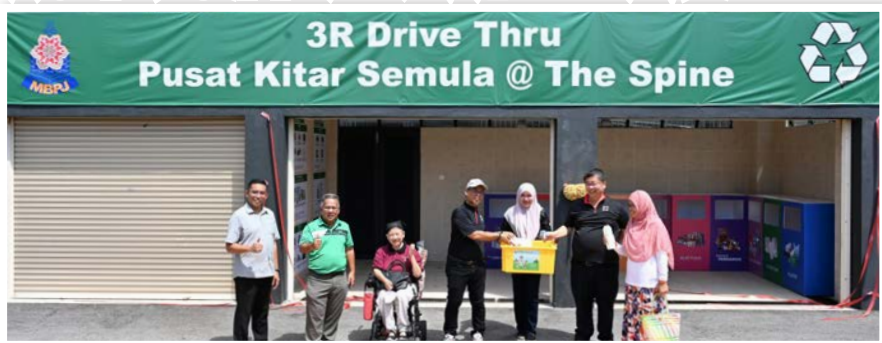
▲The Spine @ PJKita社区中心设有“得来速”环保中心,方便民众无需下车也能投放回收物品。

(莎阿南讯)八打灵再也市政厅耗资350万令吉打造的社区中心The Spine @ PJKita启用,今后为市民提供舒适的社区活动空间,同时成为市民新点子的展示区。