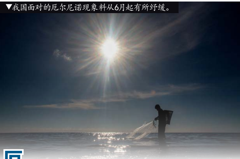
▼我国面对的厄尔尼诺现象料从6月起有所纾缓。

“公共领域改革特工队的试点计划已明显奏效，数据显示前来医院绿区的病患在三个月，即2月至4月份为30.6%。”