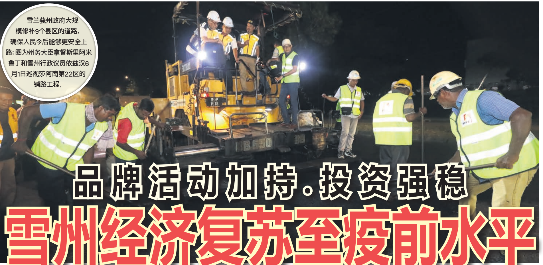
雪兰莪州政府大规模修补9个县区的道路，确保人民今后能够更安全上路；图为州务大臣拿督斯里阿米鲁丁和雪州行政议员依兹汉6月1日巡视莎阿南第22区的铺路工程。