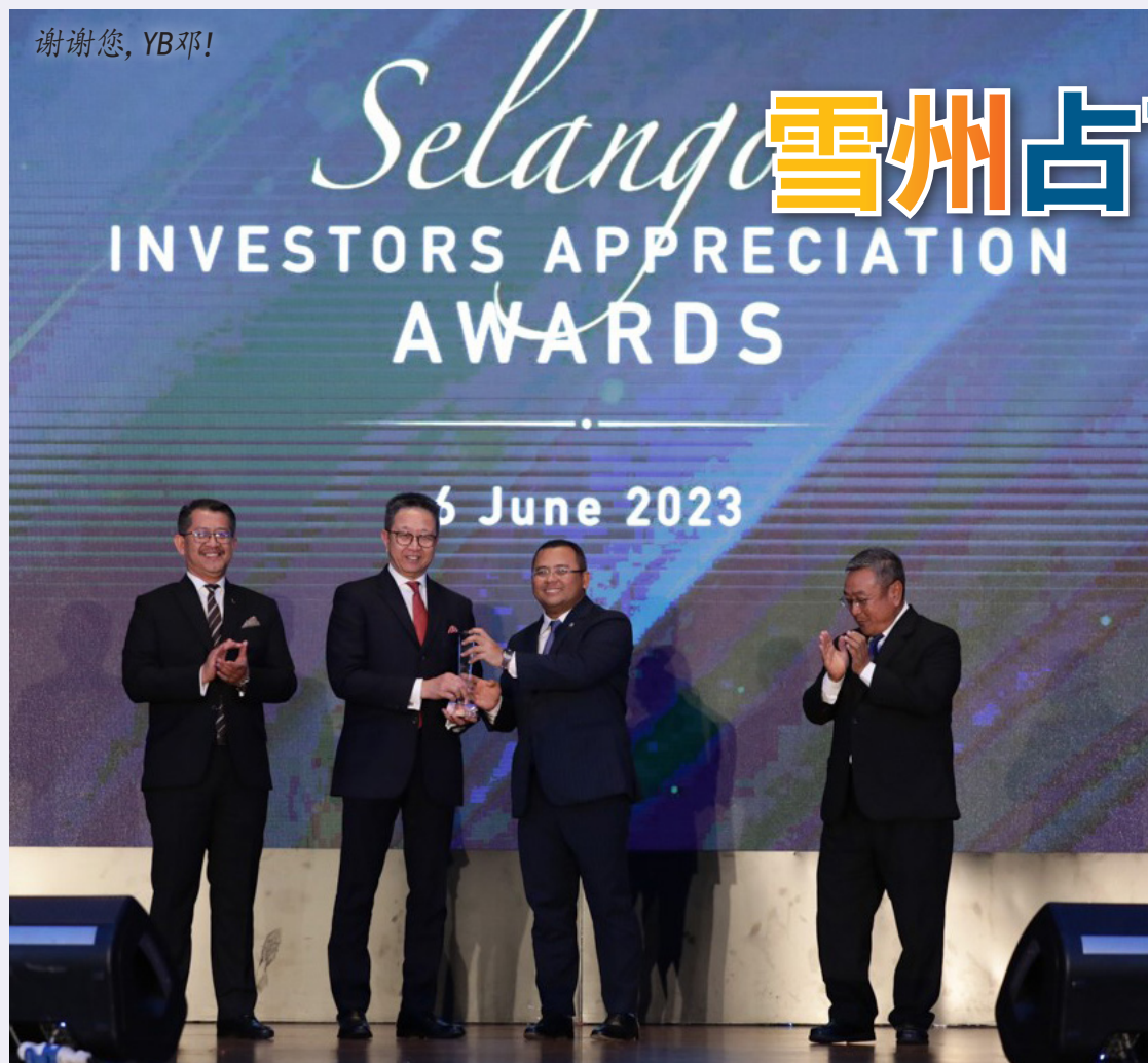
在雪州投资促进机构6月6日举办的2019至2022年雪州投资者感谢奖颁奖礼上，雪兰莪州务大臣拿督斯里阿米鲁丁(右二)颁发“终身成就奖”给即将荣休的雪州行政议员拿督邓章钦(左2)，感谢他在任期间成为雪州经济的推手；左为雪州投资促进机构总执行长拿督哈山阿兹哈里，右为雪州政府秘书哈利斯卡欣。

(莎阿南讯)雪兰莪是国内经济增长和基础设施领域的最大贡献州属，涉及的数额高达71亿令吉。