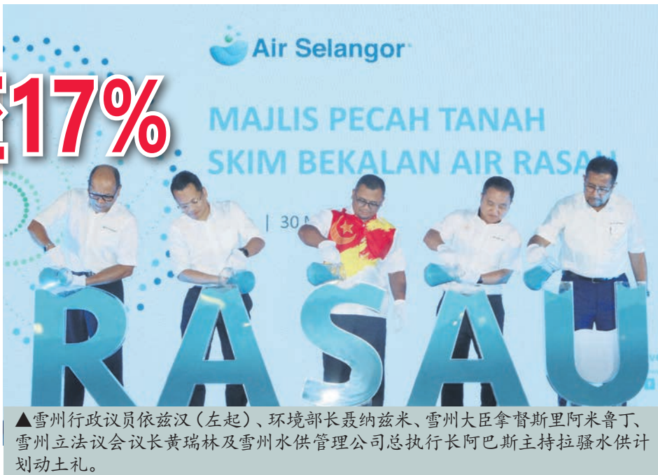
▲雪州行政议员依兹汉(左起)、环境部长聂纳兹米、雪州大臣拿督斯里阿米鲁丁、雪州立法议会议长黄瑞林及雪州水供管理公司总执行长阿巴斯主持拉骚水供计划动土礼。

“这项计划是州政府旨在确保雪州和巴生谷900万人口享有永续水供服务的努力之一。”