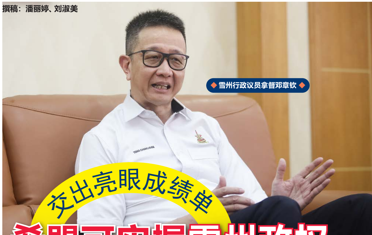
雪州行政议员拿督邓章钦