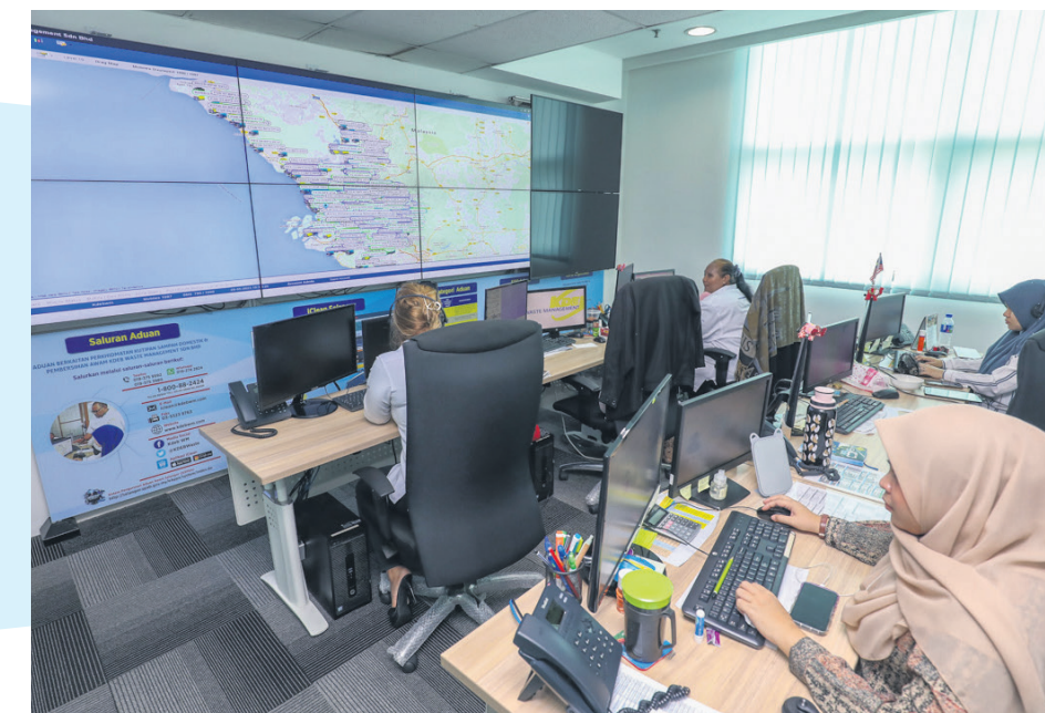
▲指挥中心 (CCC) 可全面监督各垃圾车的动向。