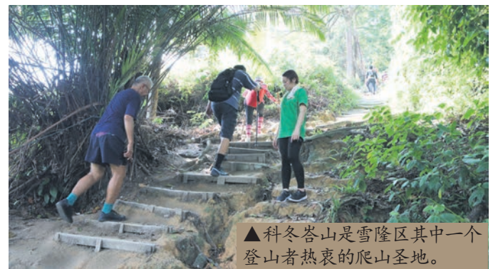
▲科冬峇山是雪隆区其中一个登山者热衷的爬山圣地。