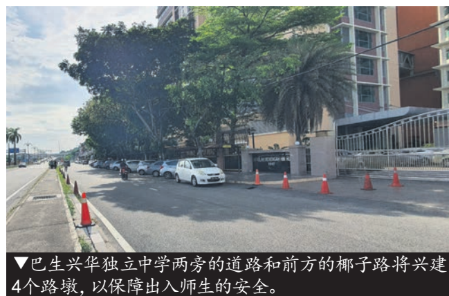
▼巴生兴华独立中学两旁的道路和前方的椰子路将兴建4个路墩,以保障出入师生的安全。

他说,该路段在夜间时分更危险,而且车速也很快,因此希望一旦增建道路安全岛后能提高该路段的安全措施,保障驾驶者的安全。