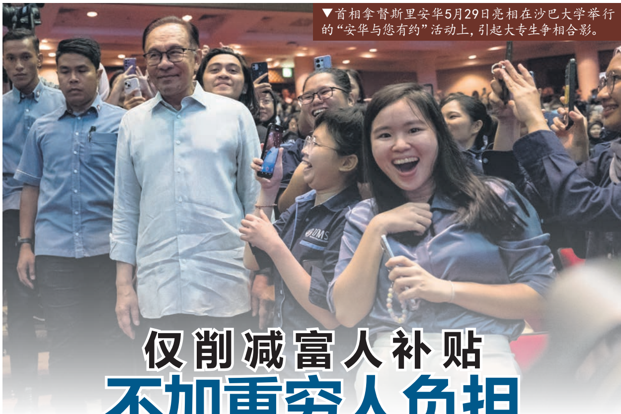
▼首相拿督斯里安华5月29日亮相在沙巴大学举行的“安华与您有约”活动上，引起大专生争相合影。