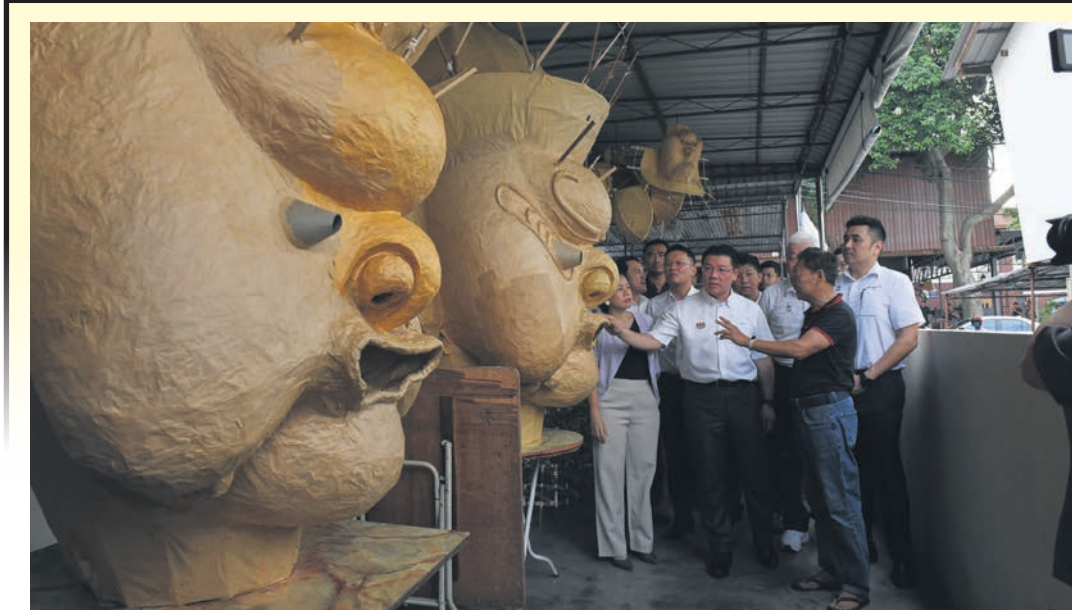
▲地方政府发展部长倪可敏(左2)在武拉必新村参观当地的文化遗产。