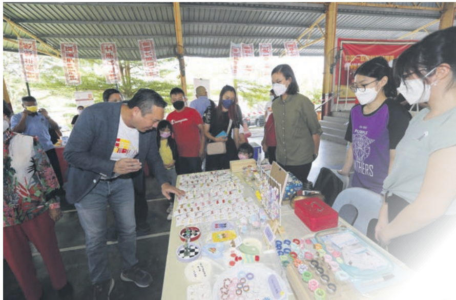
▲黄思汉在任期内致力于推广新村文化。

金銮区州议员黄思汉在2018年首次进入雪州内阁，掌管地方政府、公共交通及新村发展重要职务。他在5年任期内孜孜不倦，力求为各掌管职务带来革新及活力，其中更火力全开地推广新村文化。