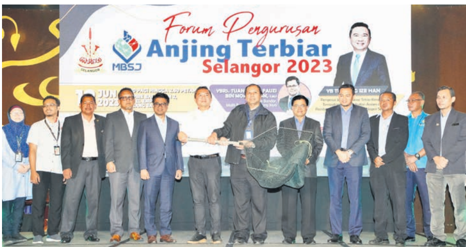
▲雪州行政议员黄思汉 (左6) 在开幕“雪州流浪狗管理研讨会”后与嘉宾们大合照。

“雪州政府今年更拨出800万令吉作为非伊斯兰宗教拨款, 以协助这些宗教组织提升和维修宗教场所, 同时推动正向的宗教活动。”