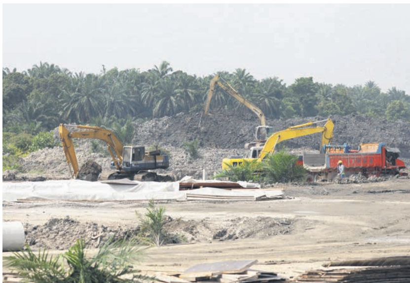
▲雪州政府耗资巨款打造的生水保障计划如火如荼施工中。

2020年11月通过雪州水务管理局(修正)条例，通过强制监禁和大幅度提高罚款数额，以严惩水源污染祸首。