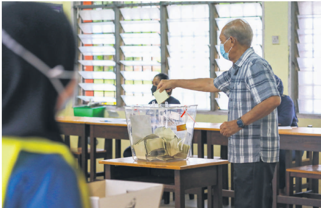
▲雪兰莪选民将在8月12日通过手中一票选出新一届州政府。