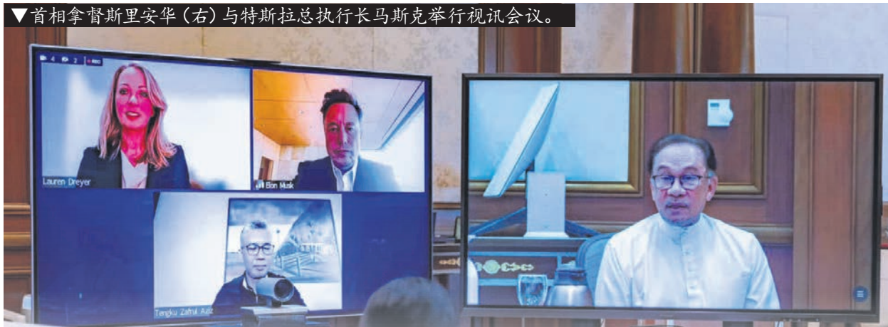
▼首相拿督斯里安华(右)与特斯拉总执行长马斯克举行视讯会议。