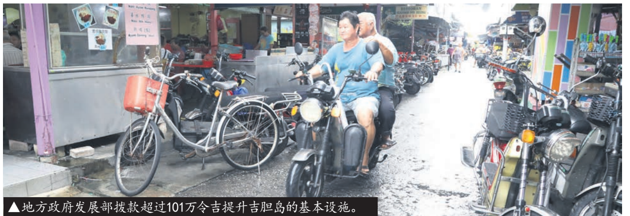
▲地方政府发展部拨款超过101万令吉提升吉胆岛的基本设施。

吉胆岛志愿消防队成立于1972年, 目前有25名受过训练的志愿消防员, 肩负照顾6000名岛民的安全。