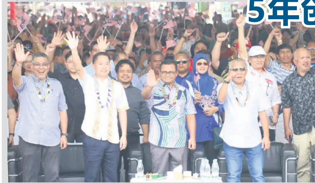
▼雪州大臣拿督斯里阿米鲁丁(前排左3)出席2023年雪州丰收节活动。

“此外,我们也同意在星链和互联网方面的合作,这将为所有郊区、学校和大学提供更廉价的上网服务。”