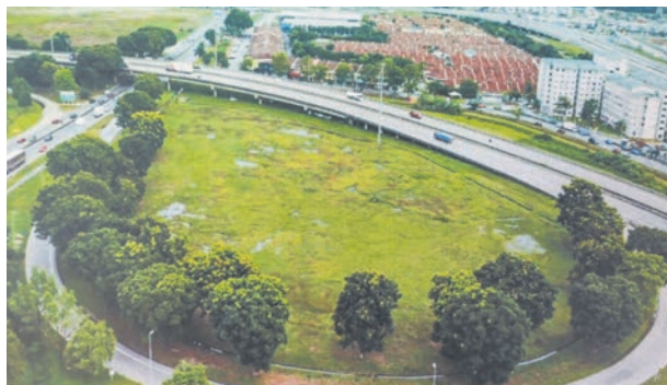
▲雪州政府拨款730万令吉兴建一座蓄水池, 以降低武吉拉惹珍珠花园的水灾风险。