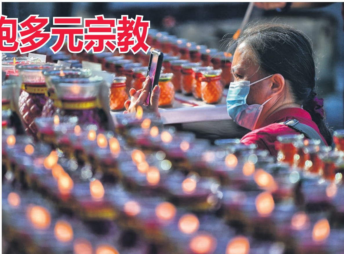
▲希盟雪州政府常年拨款给非穆斯林宗教团体。

雪州政府在过去15年的执政中，通过行动证明了希盟从不边缘化任何宗教信仰，从拨款到土地分配都一视同仁，展现出公平对待各宗教的态度。