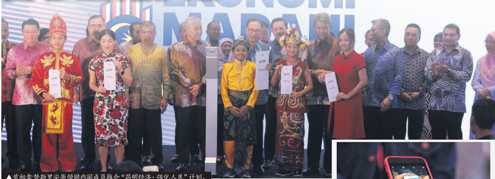
▲首相拿督斯里安华偕同内阁成员推介“昌明经济：强化人民”计划。