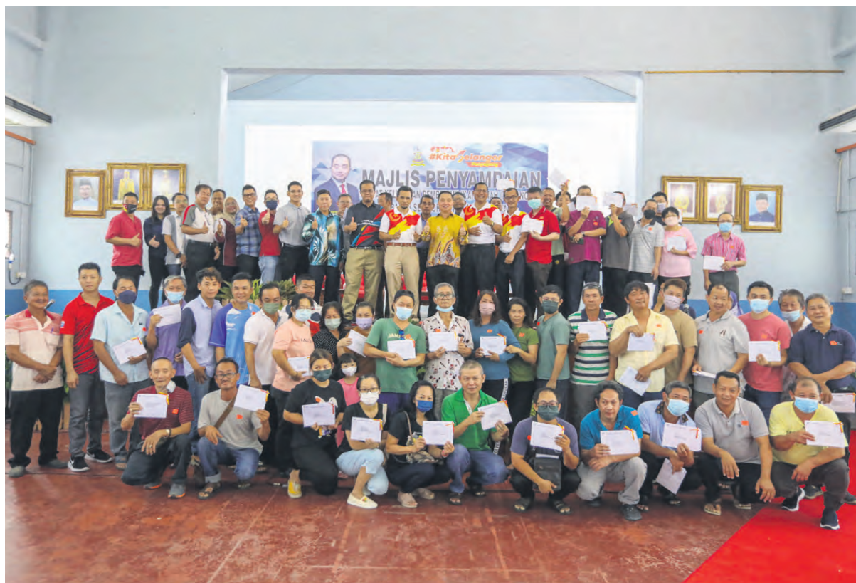
▲适耕庄海口渔村的51户村民在今年3月20日从适耕庄区州议员黄瑞林手中喜领5A表格。