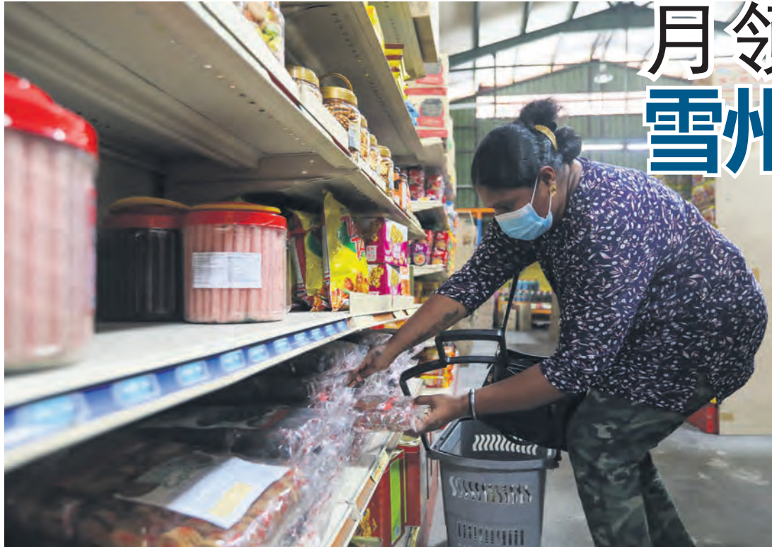
▲雪州生活快乐补助金减轻了贫穷家庭的生活负担。

在当今生活负担日渐沉重的年代，许多生活在贫困边缘的家庭需要援助，而雪兰莪州政府绝不会袖手旁观。