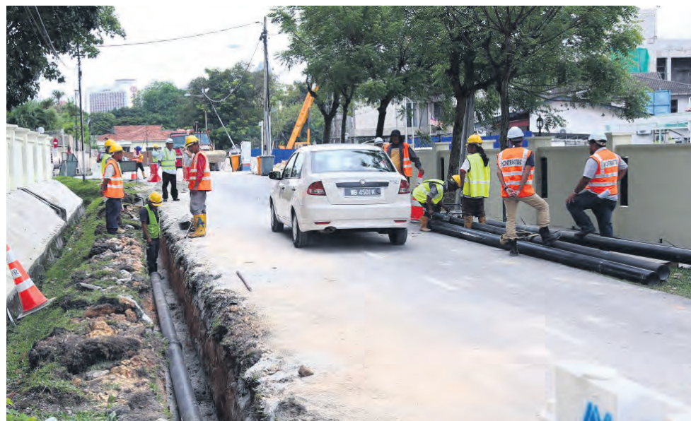
▲雪州政府分阶段更换陈旧的输水管。