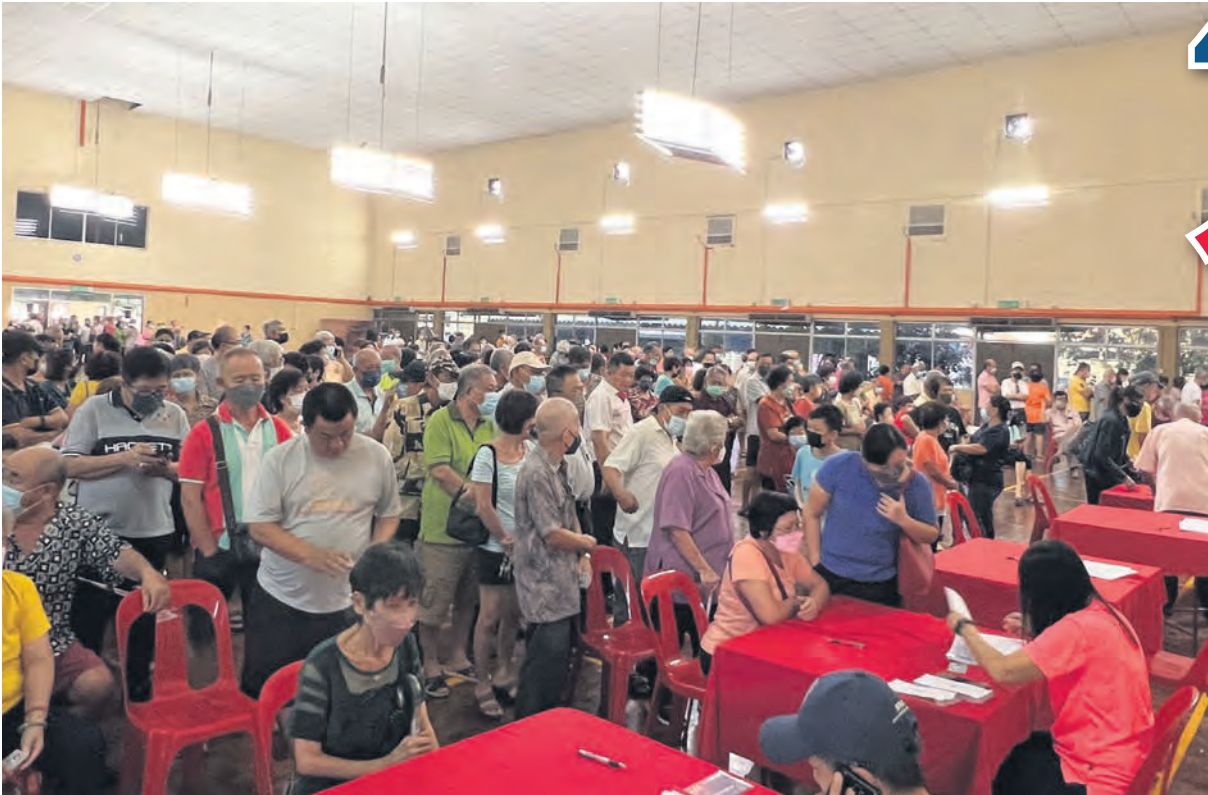
▲巴生新城州选区的大批长者今年2月领取雪州乐龄亲善基金购物券的场面