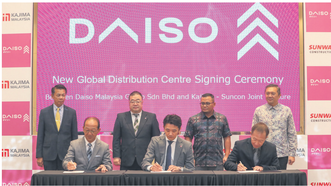
▲雪兰莪州务大臣拿督斯里阿米鲁丁（后排右2）见证大创马来西亚集团有限公司与鹿岛-顺康 Kajima-Suncon 签署合作备忘录。

（莎阿南讯）雪兰莪投资魅力无法挡，吸引日本家居用品供应商大创（Daiso）投资10亿令吉，在巴生兴建全球最大的配送中心。