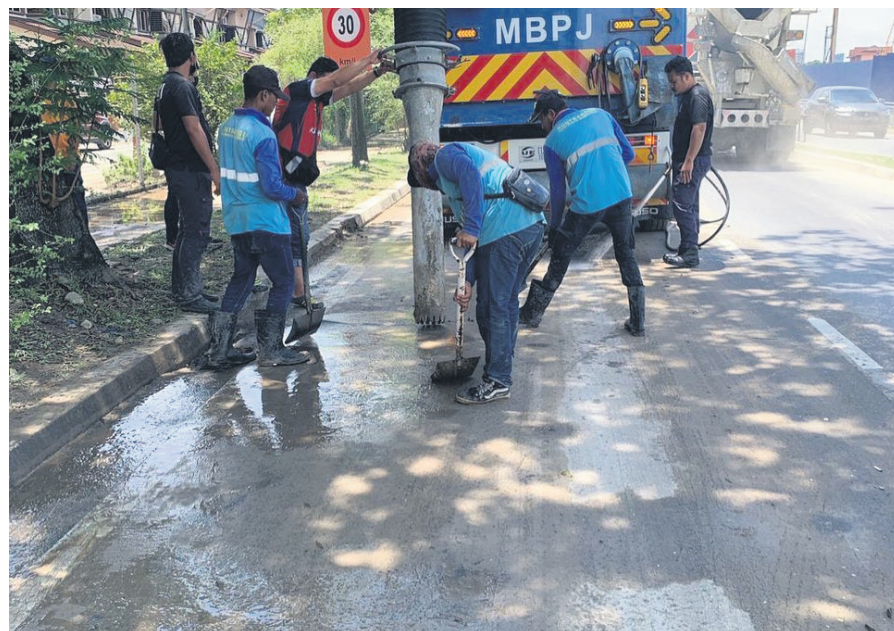
▲达鲁益山垃圾管理公司计划扩大夜间清理商业区的范围。

“这项研究对达鲁益山极为重要,以便我们获得正确的数据来加强未来的废物管理,以及设立更策略性的资源回收中心。”