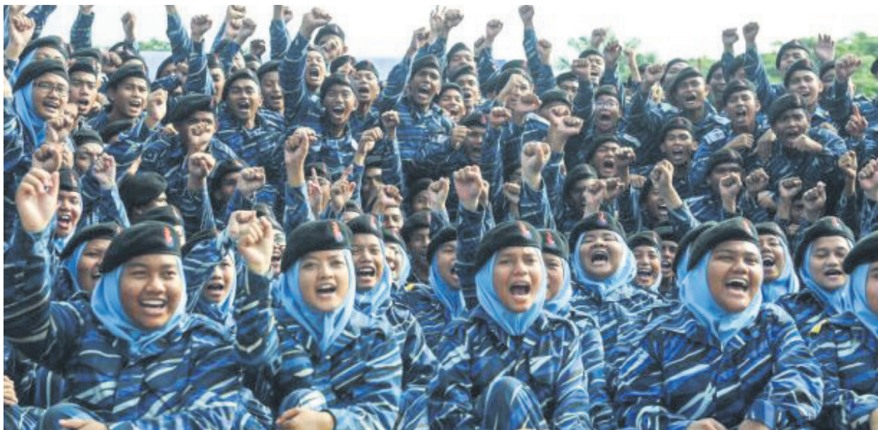
▲政府准备重新启动国民服务计划，让参与者接受为期45天的培训。