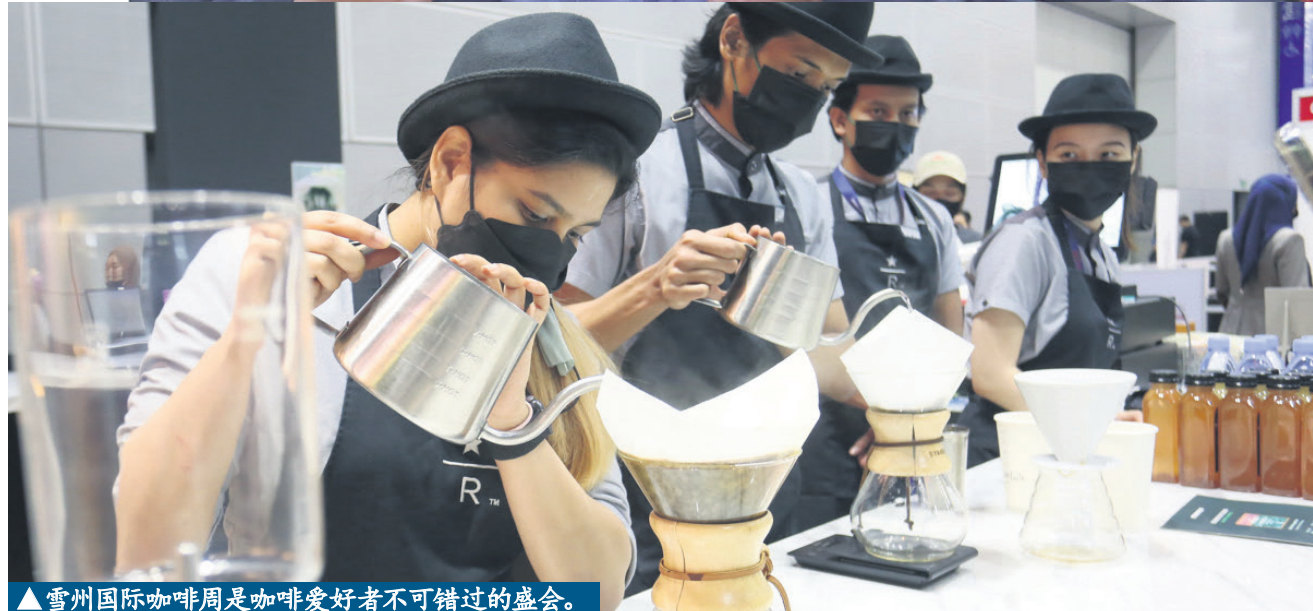
▲雪州国际咖啡周是咖啡爱好者不可错过的盛会。

雪兰莪国际商务峰会 (SIBS) 日期: 10月19日至22日 地点: 吉隆坡会展中心 电话: (+6) 03 5510 2005 网站: https://selangorsummit.com/sibs-2023/