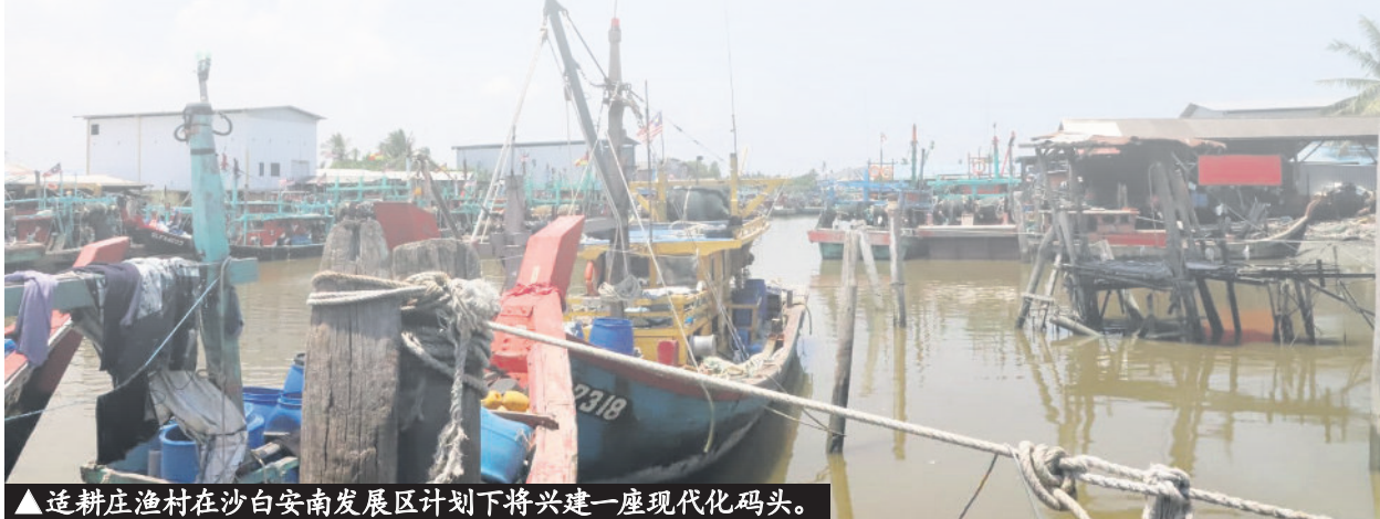
▲适耕庄渔村在沙白安南发展区计划下将兴建一座现代化码头。

(莎阿南讯) 雪兰莪州政府通过沙白安南发展区 (SABDA) 计划, 将在水柳头渔村和适耕庄渔村打造两座现代化码头, 以造福当地渔民和吸引外资。