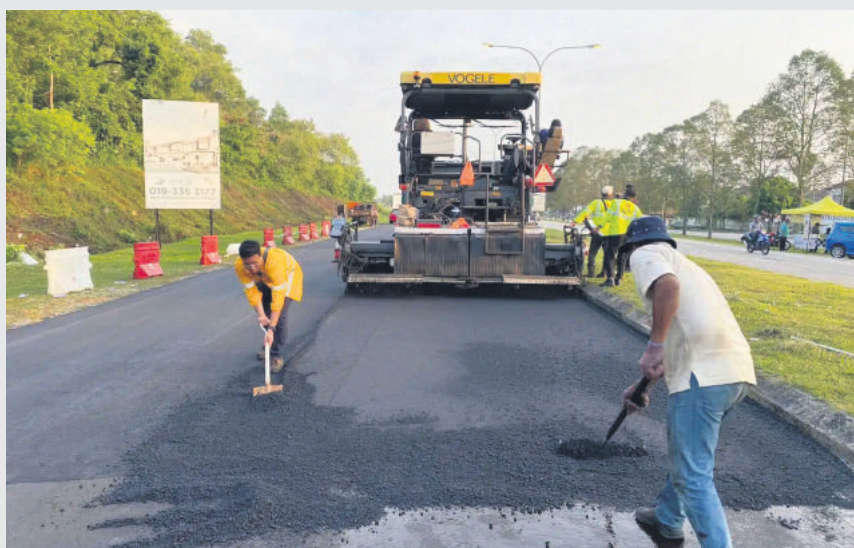
▲八打灵再也市政厅提醒市民不要付费给铺路承包商。