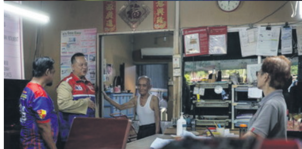
▲拿督利占(左2)在雪州选举期间拜访华裔选民。