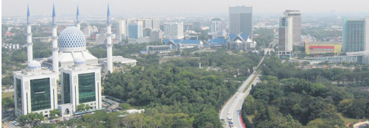
▲莎阿南市政厅提呈耗资逾5亿8000万令吉的2024年财政预算案，进一步加强管辖区的基本设施和公共服务效率。

(莎阿南讯) 莎阿南市政厅 (MBSA) 提呈总额达5亿8756万2450令吉的2024年财政预算案，财政赤字从14%降至10%，即5707万3910令吉。