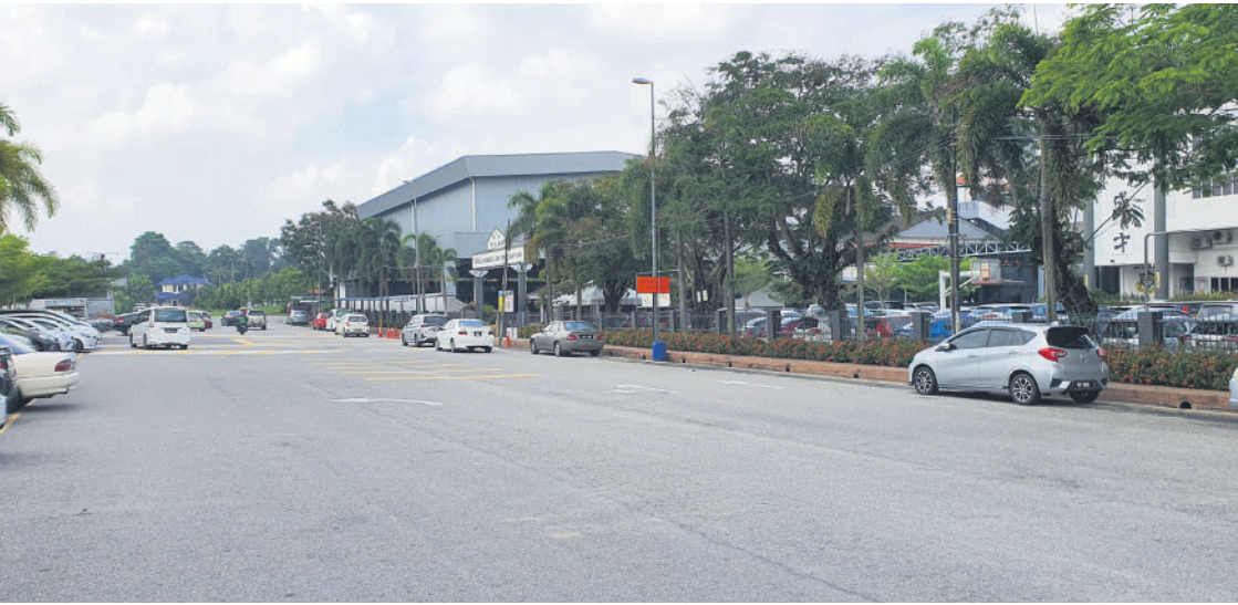
▲加影市议会提升排水系统以根治刘治国路的水灾问题。

(加影讯) 加影市议会 (MPKJ) 耗资52万令吉提升加影刘治国路的排水系统, 以解决困扰当地人民近10年的水灾问题, 同时纾缓当地育华国民型中学所面对的水劫。