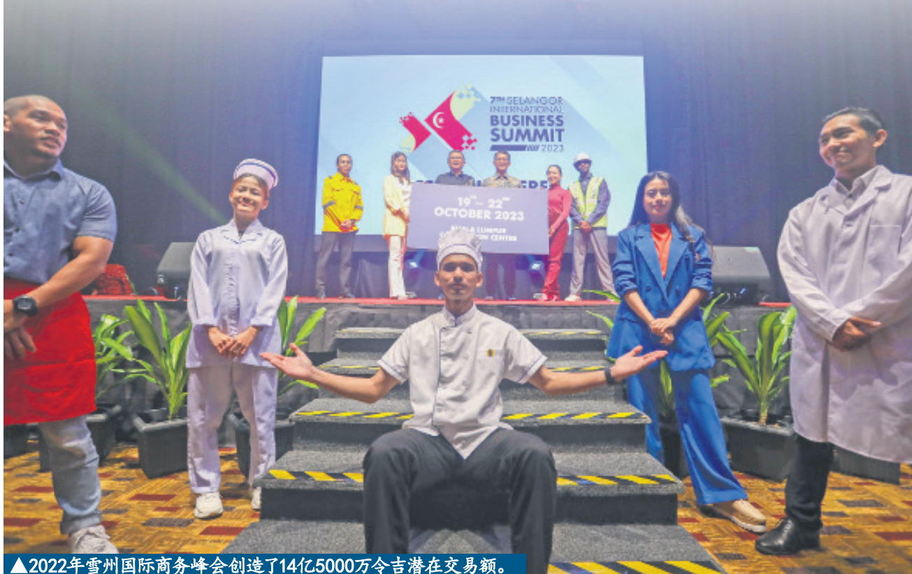
▲2022年雪州国际商务峰会创造了14亿5000万令吉潜在交易额。