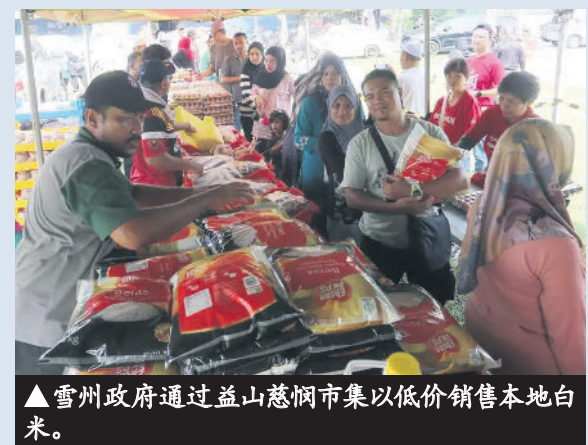
▲雪州政府通过益山慈悯市集以低价销售本地白米。

如今, 雪州政府与国内贸易及生活成本部合作推动此促销计划, 计划也易名为益山慈悯市集。