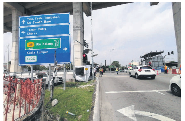
▲从柏迈E路往左驶入特拉花园路的局部路段将关闭。

“我们在这两年来常常接获居民投诉水供问题, 包括水供中断、干扰或水压偏低等。自冷岳河2滤水站计划启用后, 情况已大有改善, 希望居民谅解和忍耐施工期间的不便。”