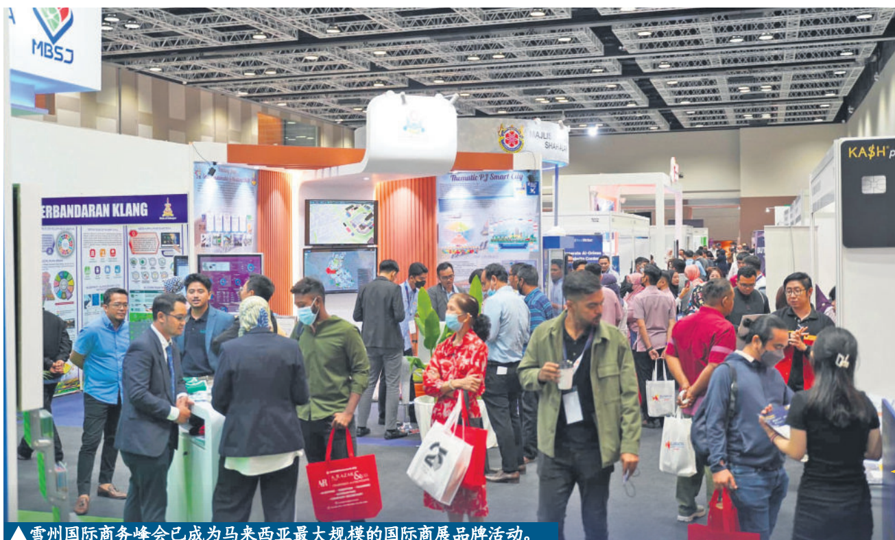
▲雪州国际商务峰会已成为马来西亚最大规模的国际商展品牌活动。