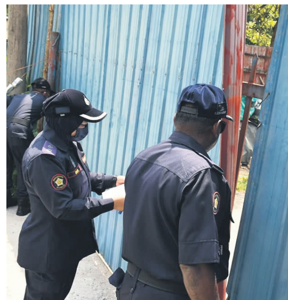
▲瓜拉雪兰莪市议会执法组日前在八丁燕带一带展开突击行动。