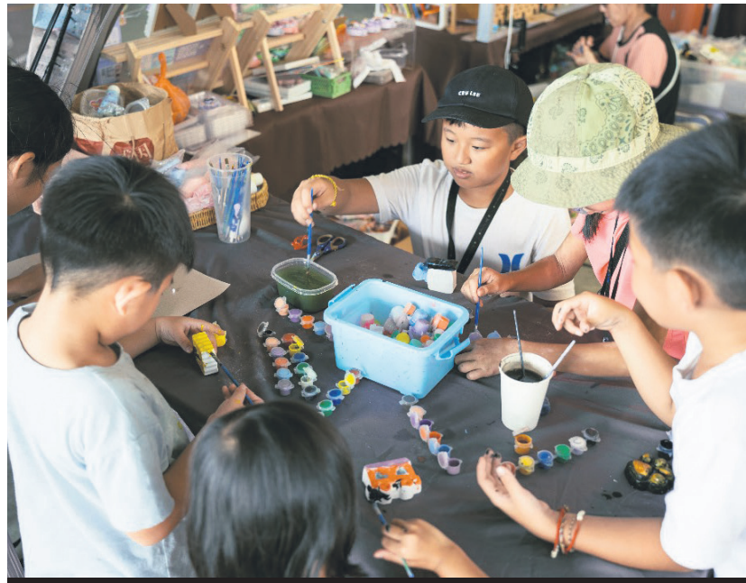
▲第一届马来西亚露营风文化节期间的活动丰富,让孩童可以好好消磨时光。

雪州峇冬加里一有机农场的露营地,在2022年12月16日发生震惊全国的土崩悲剧,导致31人不幸罹难。雪州政府随后宣布将制定露营活动指南,以保障各方的安全。