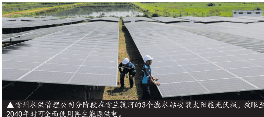
▲雪州水供管理公司分阶段在雪兰莪河的3个滤水站安装太阳能光伏板,放眼至2040年时可全面使用再生能源供电。