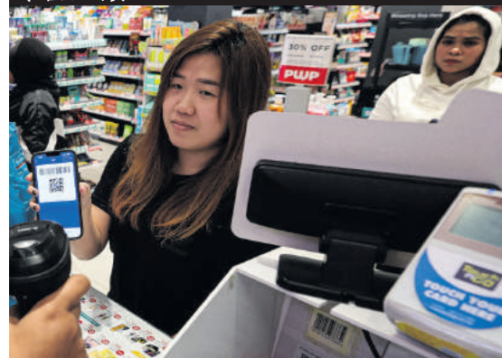
▼国人在获得100令吉的eMadani电子现金后于零售店消费。

“通过现金汇款方式采取的合理化补贴机制将会比目前的补贴制度更理想,确保只有符合资格者获得政府的补贴。”