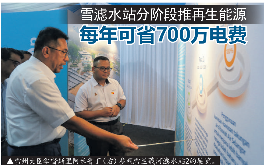
▲雪州大臣拿督斯里阿米鲁丁(右)参观雪兰莪河滤水站2的展览。

“州政府也与各州议员服务中心、新村管理委员会、印裔社区领袖和宗教场所密切合作,以派发传单宣传资讯,确保协助到有需要者。”