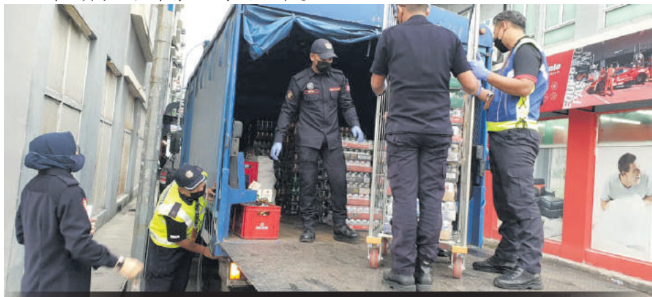
▼工作人员分工合作清理太子园的街道。

他说,领养区内的4个工业区皆涌现非法外籍小贩,自己将配合加影市议会陆续执法,以恢复工业区的原貌。