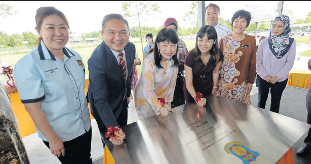
▼雪州行政议员黄思汉(左2起)、教育部副部长林慧英和通讯及数码部副部长张念群开幕敦化华小。

在场者有通讯及数码部副部长张念群、雪州行政议员黄思汉、敦化国民型华小董事长叶玉珍、校长陈贵珠、绿盛世总裁兼执行长拿督曾建华等。