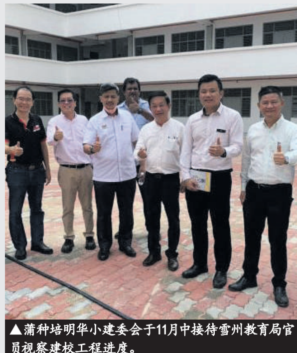
▲蒲种培明华小建委会于11月中接待雪州教育局官员视察建校工程进度。

蒲种区目前共有6间华小，即坐落在八打灵县的竞智华小、益智华小、沙登岭华小、琛静哈古乐华小、汉民华小和新华小(雪邦县)，各学校的学生人数约2000人；汉民华小学生则3000人。