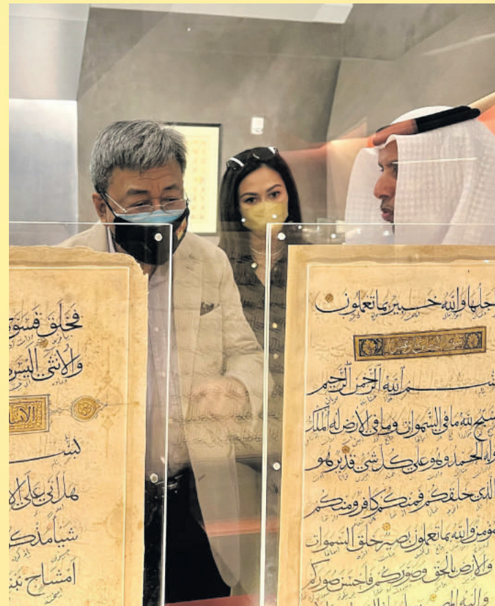
▲雪兰莪苏丹沙拉夫丁参观杜拜的博物馆。