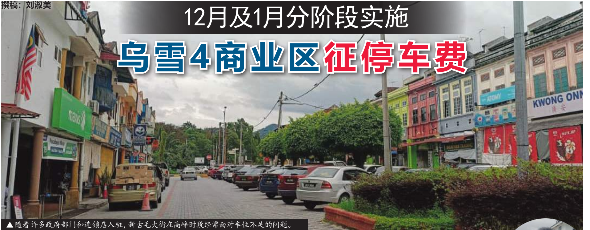
▲随着许多政府部门和连锁店入驻，新古毛大街在高峰时段经常面对车位不足的问题。

（新古毛讯）乌鲁雪兰莪市议会（MPHS）从12月1日起正式实施停车收费制，并率先在武吉柏兰东（Bukit Beruntung）和桃源岭（Bukit Sentosa）开跑，当地商家和居民受促记得缴付停车费，以免受取缔对付。