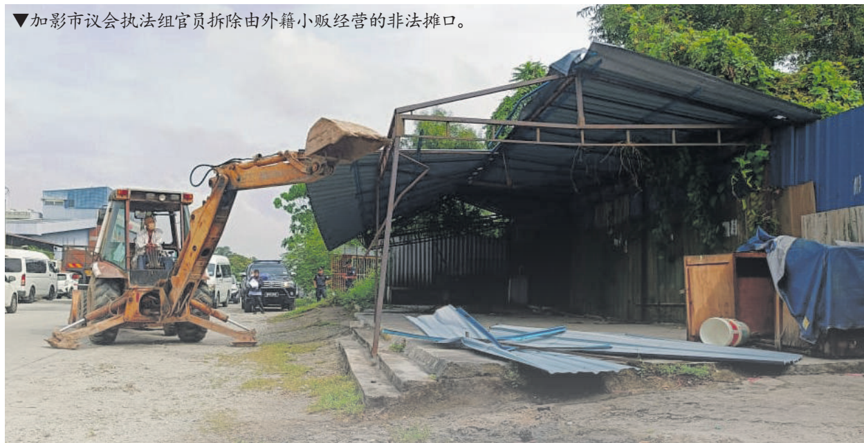
▼加影市议会执法组官员拆除由外籍小贩经营的非法摊口。

另一方面,神建华指出,考虑到工业区员工的用餐便利,自己将向市议会建议让餐车业者申请执照,以在