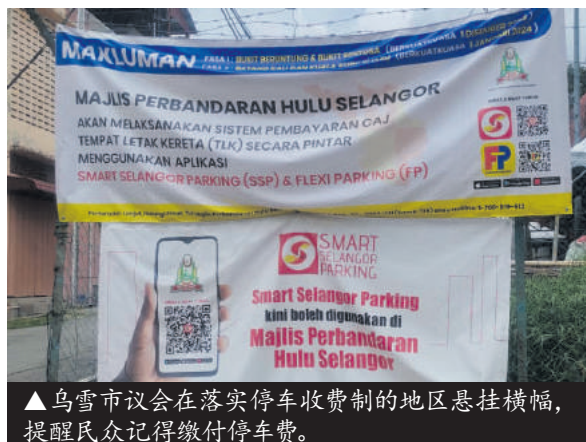
▲乌雪市议会在落实停车收费制的地区悬挂横幅，提醒民众记得缴付停车费。

她说，雪州政府多年来豁免新村和甘榜门牌税和小贩执照费，直接影响市议会的收入，因此相信征收停车费可以补贴回这笔损失。