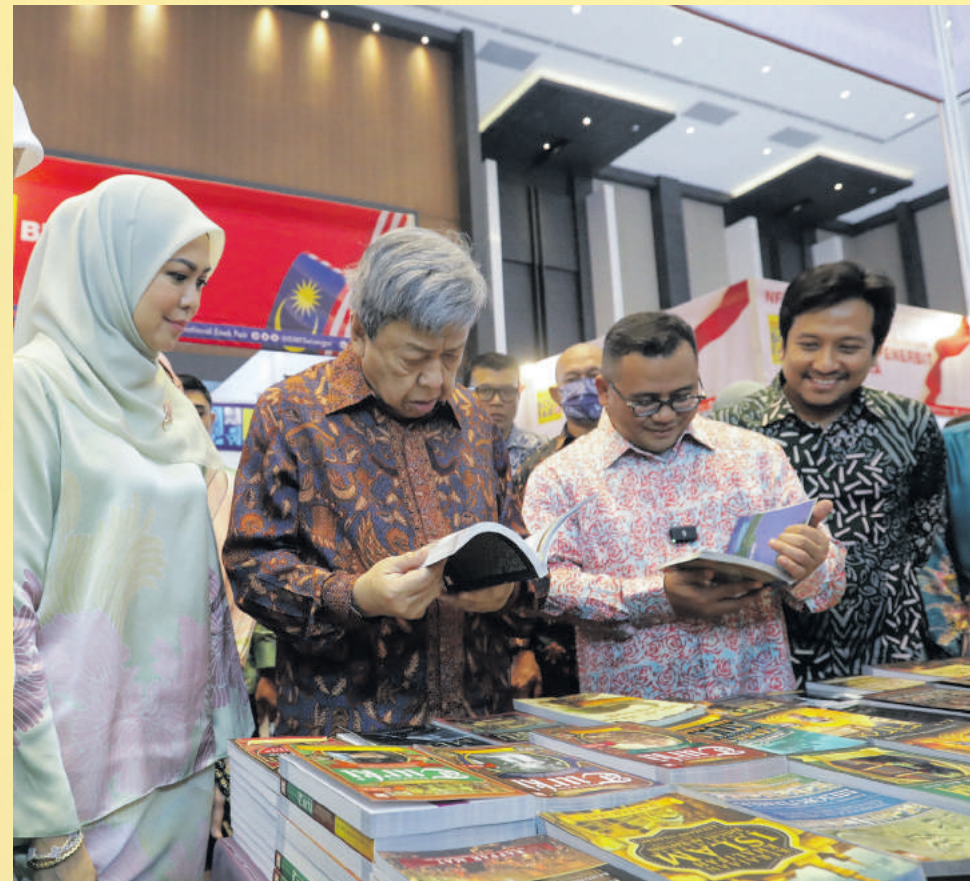
▲雪兰莪苏丹沙拉夫丁伉俪(左2起)与雪州大臣拿督斯里阿米鲁丁参观2023年雪兰莪国际书展。