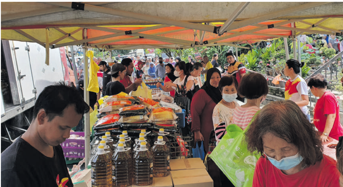
▼民众排队购买益山慈悯市集的商品。

该市集促销的食品包括了肉鸡(每只10令吉)、B级鸡蛋(每托10令吉)、冷冻牛肉(每包10令吉)、甘望鱼(每包6令吉)、5公斤食用油(每罐25令吉), 以及5公斤包装白米(每包13令吉)。