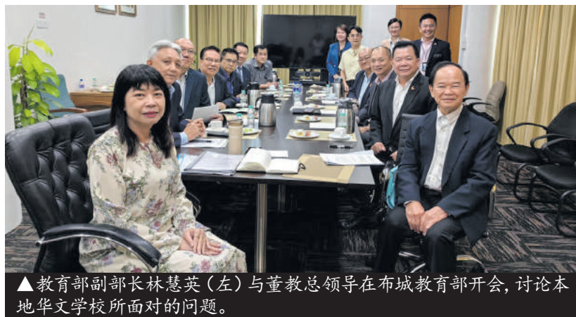
▲教育部副部长林慧英(左)与董教总领导在布城教育部开会,讨论本地华文学校所面对的问题。

资特别委员会(简称:华校师资特委会),以全面探讨华校师资课题,并依据华小、华中实际需求,制定短期、中期、长期方案,改善教育