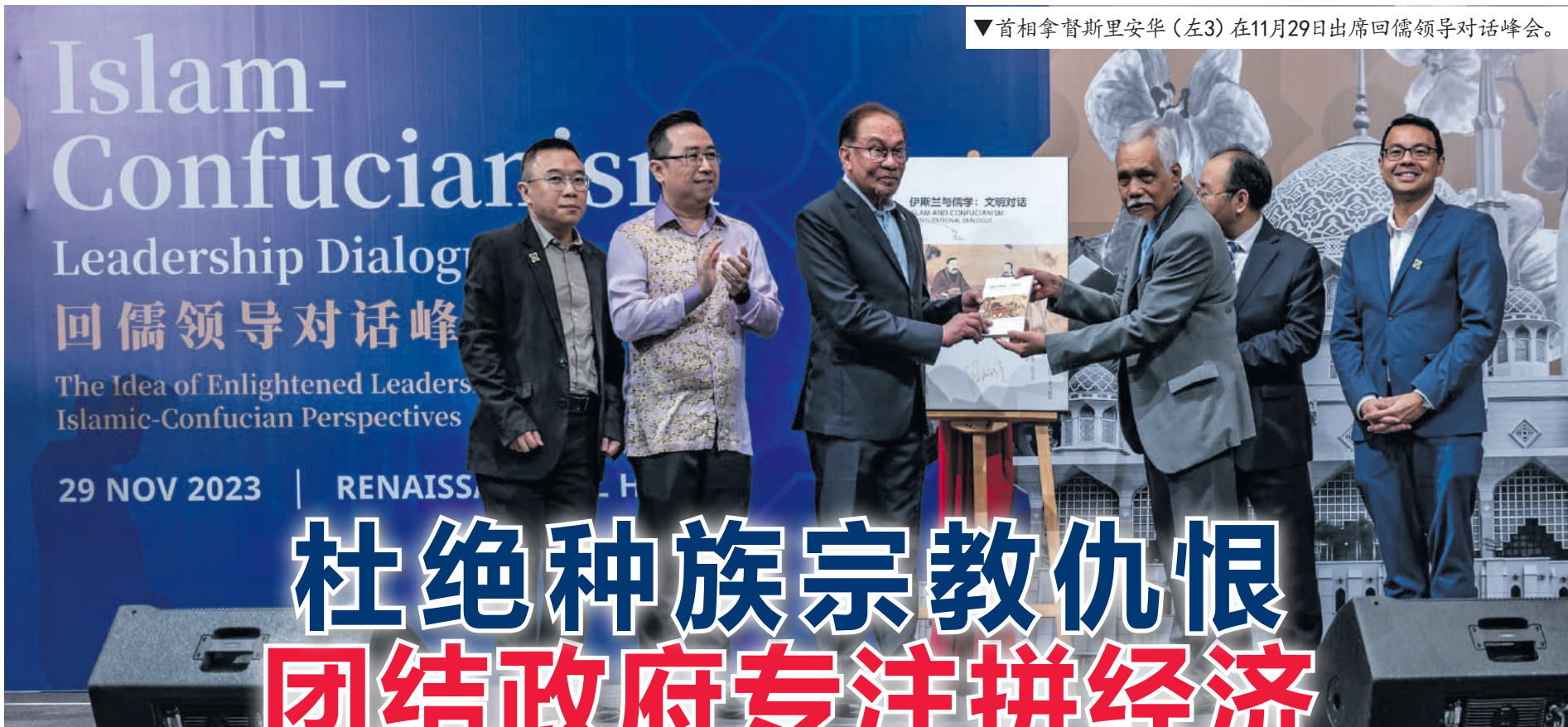
▼首相拿督斯里安华(左3)在11月29日出席回儒领导对话峰会。