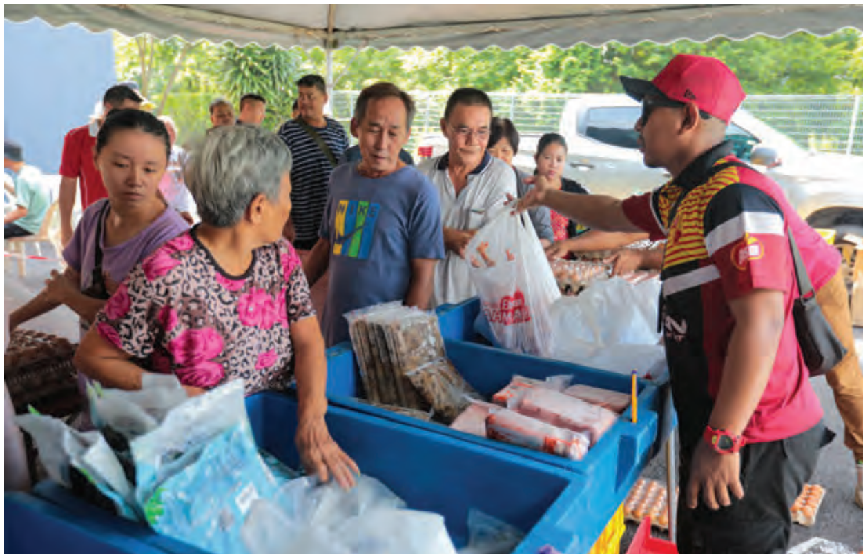
▲村民踊跃前往慈悯市集采购食材。