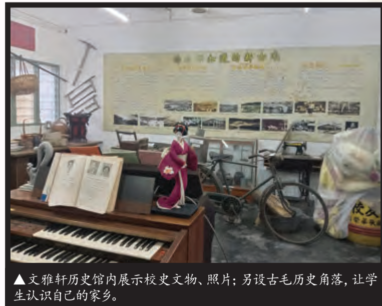
▲文雅轩历史馆内展示校史文物、照片；另设古毛历史角落，让学生认识自己的家乡。

2023年，校方正式成立廿四节令鼓班，由国内著名打击乐团一手集团教练授课，与已成立多年的舞蹈课，让学生在功课之外亦可展现文化才艺。