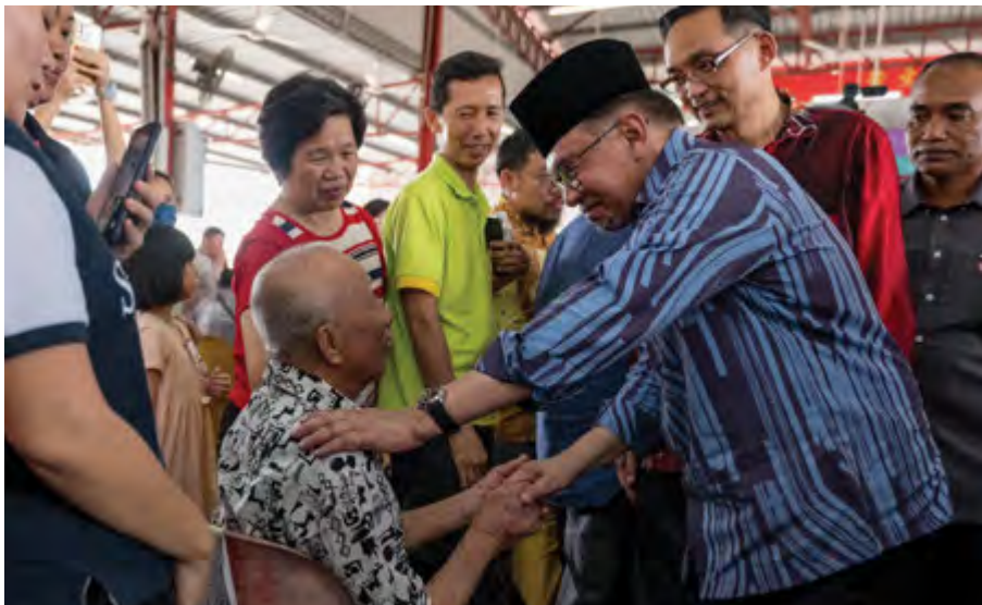
▲首相拿督斯里安华(右)5月4日在珠宝瓜拉光新村出席与华社有约昌明关爱计划时,向在场的华裔居民问好。

(北海讯)首相拿督斯里安华强调,我国从6月起并没有削减燃油补贴,内阁至今还没对此做出最终决定。