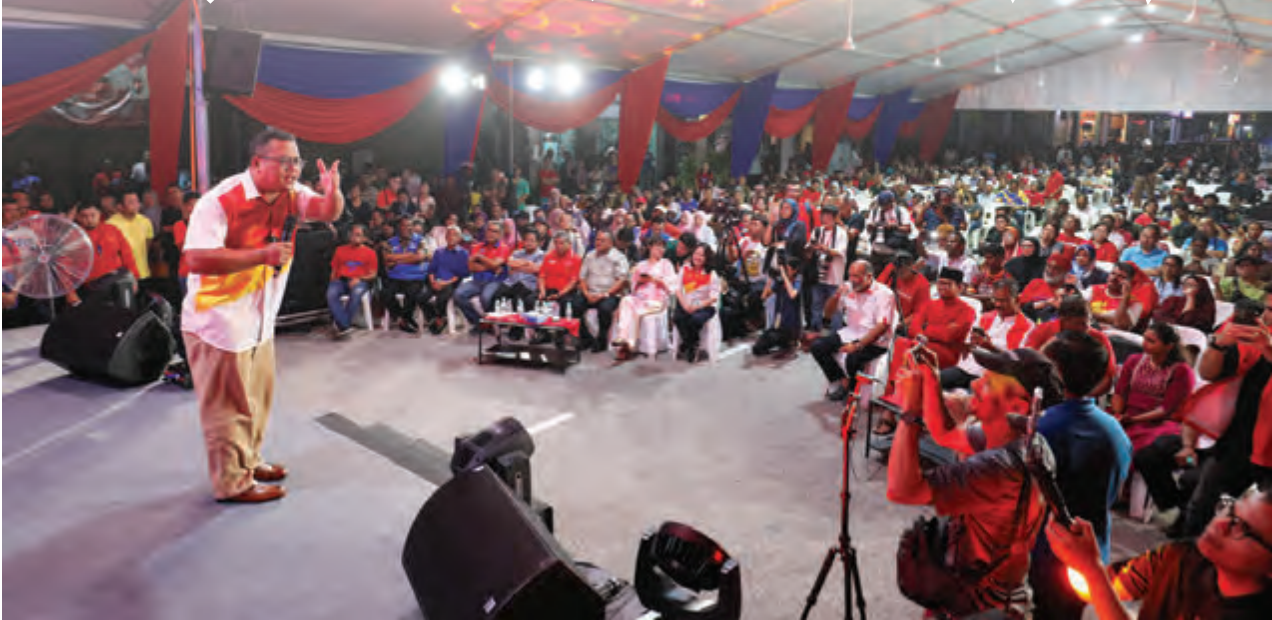
▲雪州希盟主席拿督斯里阿米鲁丁5月3日在团结政府造势活动上, 呼吁新古毛选民在补选中投选希盟候选人彭小桃。