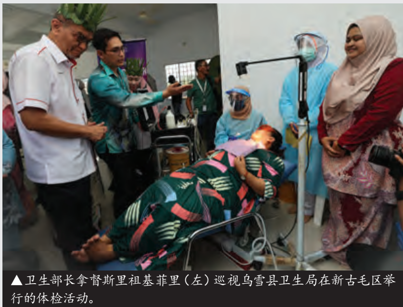
▲卫生部长拿督斯里祖基菲里(左)巡视乌雪县卫生局在新古毛区举行的体检活动。

(乌鲁雪兰莪讯) 卫生部将增加新古毛中央医院的专科医生, 进一步改善该医院的医疗服务。