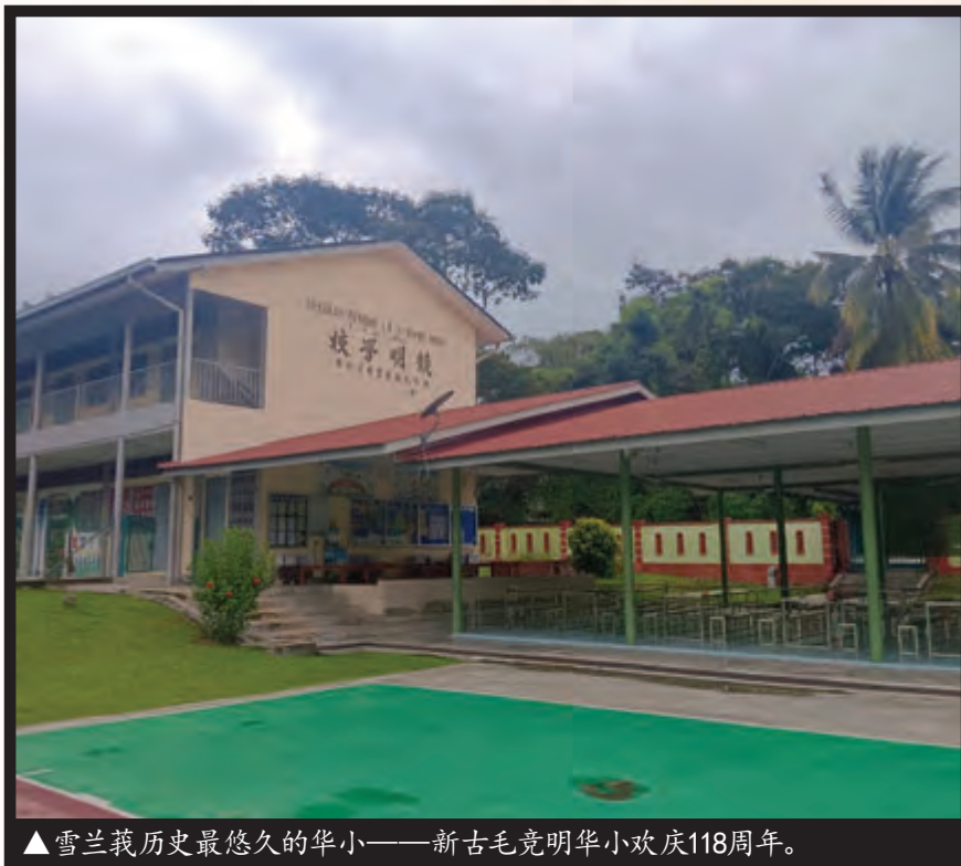
▲雪兰莪历史最悠久的华小——新古毛竞明华小欢庆118周年。